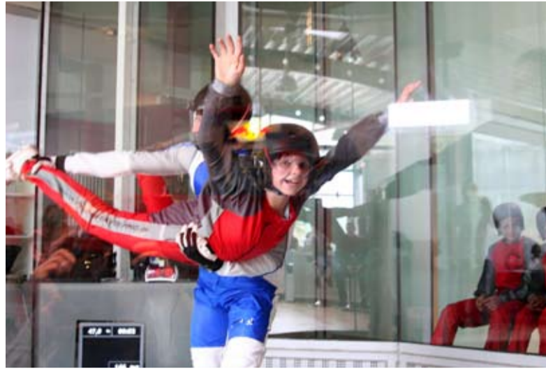
Fast so, als ob der Traum vom Fliegen Wirklichkeit worden wäre: Kinder aus der Dortmunder Nordstadt beim Bodyflying.

Das Gesamtprojekt läuft seit dem letzten Herbst. Maximal zwölf Gründungsprojekte kommen darin für jeweils drei Monate in den Genuss des Intensivcoachings. Die Ideen können zum Beispiel aus den Bereichen Design, Journalistik, Literatur, Film, Musik oder Kunst kommen. Parallel können sich die Teilnehmerinnen und Teilnehmer in speziellen Abendveranstaltungen weiterbilden und mit anderen Kreativen austauschen. Informationen und Anmeldung: www.kultur-unternehmen-dortmund.de .