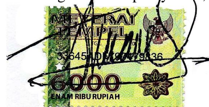
Tabhita Ratna Prasastiningtyas