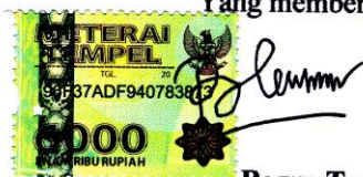
Bagus Try Hambodo