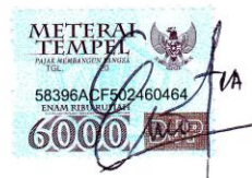
EMA ROSYIDAH A