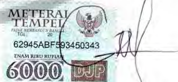
Candra Dwi Saputro