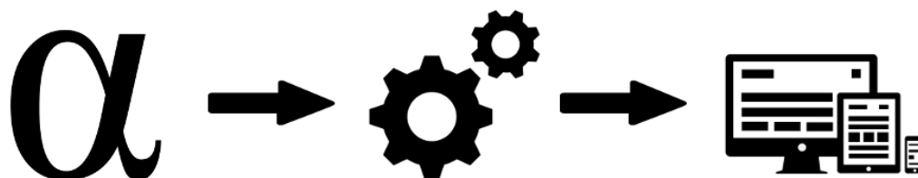
Slika 2.1: Jezikovna zasnova, izvajalni pogon in ciljna platforma.

Izvajalni pogon (angl. execution engine ) je v večini primerov izmenljiv in služi kot povezava med jezikom in ciljno platformo. Izvajalne pogone delimo na generatorje, ki kodo domensko-specifičnega jezika preoblikujejo v kodo primerno za izvajanje na ciljni platformi (ponavadi kodo napisano v splošno-namenskem jeziku) in interpreterje, ki kodo naložijo in jo neposredno izvajajo na ciljni platformi [4].