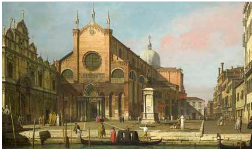
Canaletto (1697-1768), Venezia, Campo Santi Giovanni e Paolo (1736-1740), Londra, Royal Collection

mo. Personaggi di riconosciuto prestigio culturale come Giordano Bruno e Tommaso Campanella rappresentavano nell'universo domenicano i principali soggetti da sorvegliare, e particolarmente da tener d'occhio era la loro produzione letteraria. Ecco spiegata l'attenzione vigile rivolta ai libri, considerati dalla Chiesa uno dei maggiori veicoli di diffusione delle idee eretiche. Bruno era controllato e seguito da tempo ma, essendo contumace, bisognava in tutti i modi riportarlo in Italia ed entrare in possesso delle sue opere.