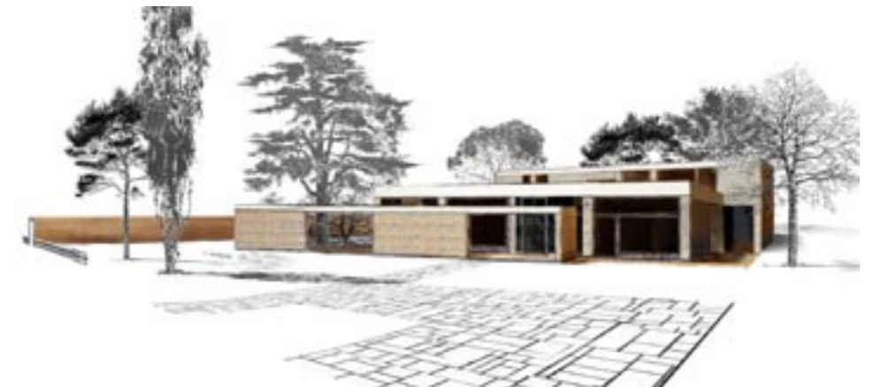
Ferienvilla mit verschiedenen Terrassen

DER WETTBEWERB für eine neue Touristenstation im Westen Marokkos umfasst ein Gebiet, dass durch bedeutende Ruinen und den Fluß Lukus geprägt wird. Drei unterschiedliche Wohnanlagen sollen an einem Hügel mit Blick auf den Fluß entstehen. Hierfür wurden neue Wohntypologien entwickelt, die insbesondere auf touristische Bedürfnisse abgestimmt sind. In allen Entwicklungsstufen stand der enge Bezug zur marokkanischen Landschaft im Vordergrund.