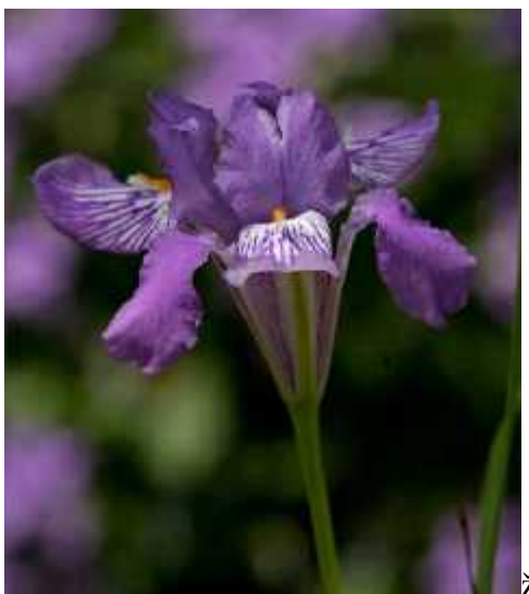
Slika 10. Iris collettii Hooker, cvijet

Iris collettii Hooker (sl. 10) minijaturan je iris koji potječe sa Himalaja, Kine, Burme i Tajlanda. Raste na sunanim suhim travnjacima na visinama od 1650 do 3500 metara nadmorske visine. Ima jako kratak rizom, te jako zadebljalo korijenje (gomolje). Listovi su dugi desetak centimetara u vrijeme cvatnje, a poslje se izdužuju do oko trideset centimetara. Cvjetovi su ljubičaste boje i nose bradu. (Köhlein 1981., http://www.bulbsociety.org/GALLERY_OF_THE_WORLDS_BULBS/GRAPHICS/Iris/Iris_collettii/Iris_collettii.html )