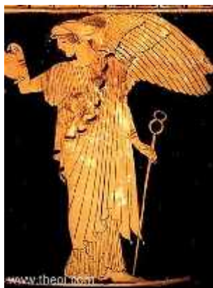
Slika 1. Božica Irida

Naziv Iris dolazi od grčke božice duge te glasnice bogova Iride (sl. 1). Starogrčke legende pišu da je božica Irida ljudima prenosila poruke bogova pomoću duge. Vjerovalo se da bi tamo gdje bi duga dotaknula zemlju, izrastao cvijet iris. Legende se zasnivaju na činjenici da irise možemo naći u raznim bojama, a svaka vrsta ima velike cvjetove koji privlače oko i pozornost.