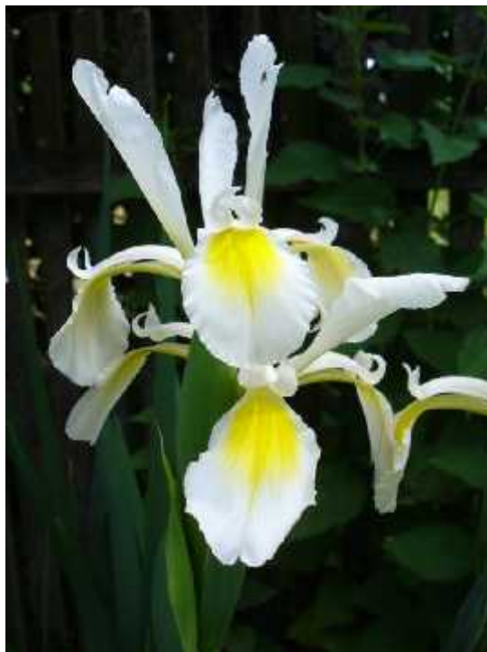
Slika 8. Iris orientalis Mill, izgled cvijeta

Iris orientalis Mill (sl. 8) jest je iris u kulturi. Cvjetovi su mu bijeli sa žutim oznakama ili potpuno žuti bez brade. Listovi prije cvjetanja su uspravni i visoki do 1 m, a cvjetne stapke sa cvjetovima nadvisuju listove. Prirodno stanište biljke je od Grčke, Turske, Male Azije do Sirije. (Köhlein 1981. http://en.wikipedia.org/wiki/Iris_(plant) , http://hr.wikipedia.org/wiki/Perunika , http://rsabg.org/iris/content/view/13/26/ , http://rsabg.org/iris/content/view/77/26/ )