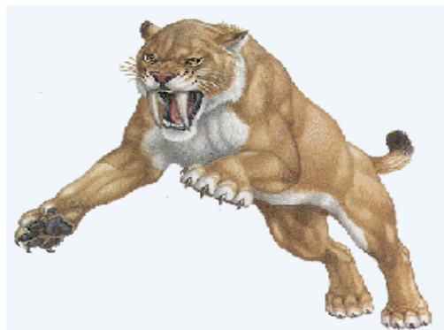
Slika 10. Sabljozubi tigar

Veličinom i robusnom građom tijela više je nalikovao medvjedu, stoga je i lovio veće životinje poput bizona, jelena, konja, američkih deva, pa čak i mlade mamute i mastodonte ( http://www.ucmp.berkeley.edu/mammal/carnivora/sabretooth.html ).