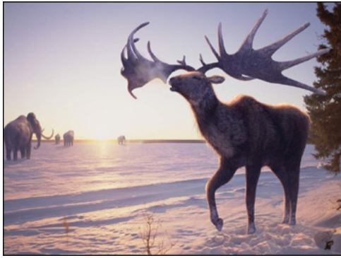
Slika 7. Golemi jelen