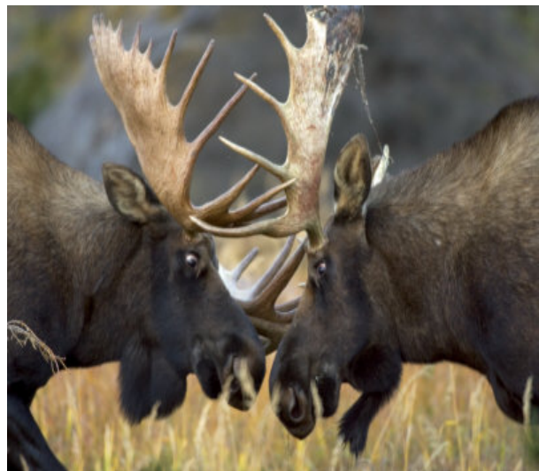
Slika 15. Losovi u borbi