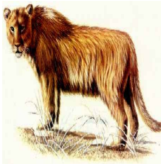
Slika 12. Špiljski lav