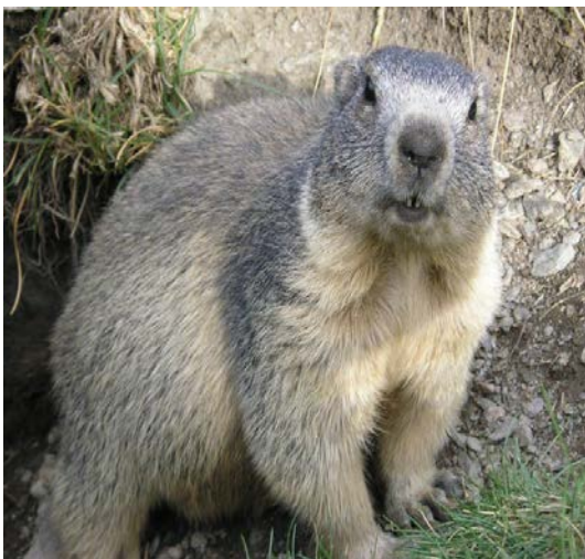
Slika 20. Alpski svizac

Ta životinjica velika je do 15 centimetara i ima sivosmeđe krzno. Živi u skupinama i kopa hodnike ispod zemlje (Rukavina, 1996).