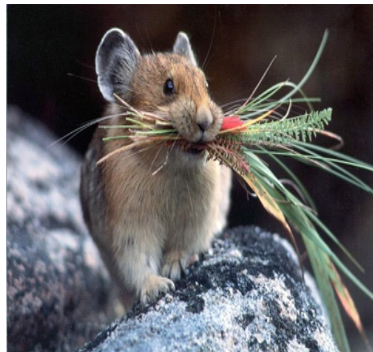
Slika 21. Stepski zviždar