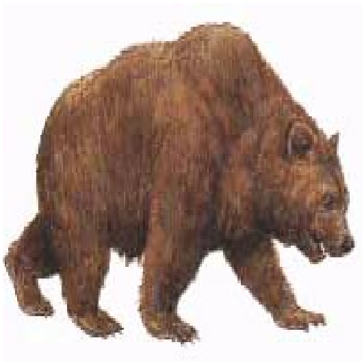
Slika 11. Špiljski medvjed