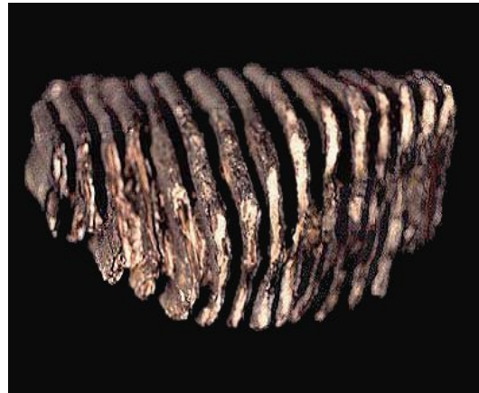
Slika 5. Visokokruni kutnjak mamuta

Većina populacije mamuta i mastodonta izumrla je krajem posljednjeg ledenog doba. Definitivno objašnjenje za njihovo masovno izumiranje još nije potvrđeno. Fascinantna je činjenica da je jedna populacija vunastog mamuta na izoliranom Wrangel otoku u sjeveroistočnom Sibiru izumrla tek oko 1700. godine prije Krista ( http://www.bbc.co.uk/nature/wildfacts/factfiles/3004.shtml ).