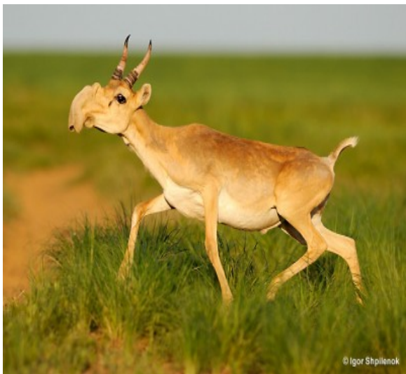
Slika 14. Sajga antilopa

Sajga antilopa (sl. 14) živjela je u ledenom dobu u travnatim stepama periglacialnih područja Europe i Azije. Areal joj se prostirao od Britanskog otočja, kroz centralnu Aziju i Beringov prolaz pa sve do Aljaske. Početkom 18. stoljeća mogla se vidjeti na obalama Crnog mora i u podnožju Karpata ali zbog pretjeranog izlova, danas živi samo u stepskim i brežuljkastim, pjeskovitim područjima oko rijeke Volge. Ova antilopa ima glavu s rogovljem dugačkim do 25 centimetara u obliku nepravilno oblikovanog glazbala - lire a nosni joj je dio glave izbočen poput malog rila (Rukavina, 1996).