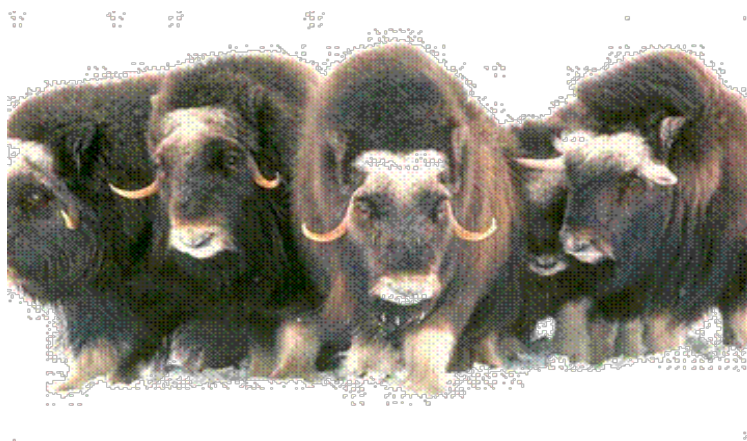
Slika 13. Krdo mošusnih goveda

Mošusno govedo dugačko je oko 2 metra, visoko oko 1 metar, a teži i do 400 kilograma. Tijelo mu je robusne građe s kratkim tijelom i nogama, prekriveno tamnosmeđom, gustom i do jedan metar dugom dlakom. Na glavi se nalaze oštri rogovi savinuti prema dolje i van. Mošusno govedo se hrani travom, mahovinom i polarnom vrbom. Živi u krdima (sl. 13) od 6 do 9 jedinki (Rukavina, 1996).