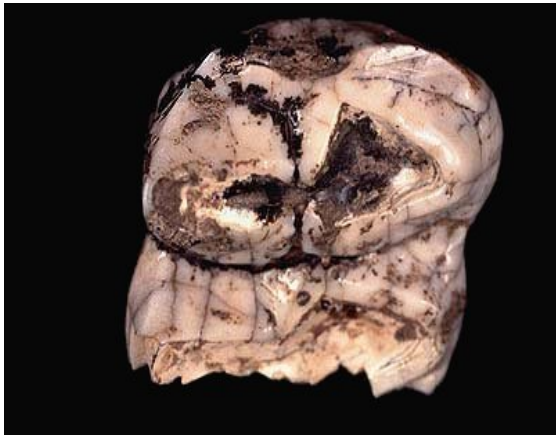
Slika 4. Čunjasti kutnjak mastodonta