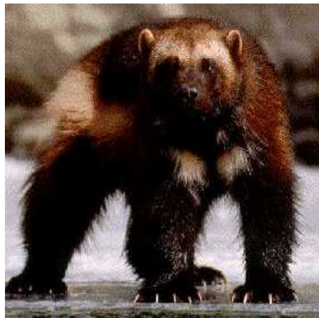
Slika 18. Žderonja

Žderonja (rosomah) je velika kuna (sl. 18) koja je za maksimalnih zahlađenja tijekom ledenog doba bila široko rasprostranjena. Danas obitava na ograničenim prostorima šumovite tundre i tajge u južnim područjima Norveške, Finske, na Grenlandu, u sjevernoj Aziji i sjevernoj Americi. Žderonja je veličine vidre, oko 80 centimetara, tamno smeđeg je krzna i živi osamljeno na samo jednom stalnom teritoriju. Hrani se raznim životinjama, strvinama ali i raznim bobicama (Rukavina, 1996).