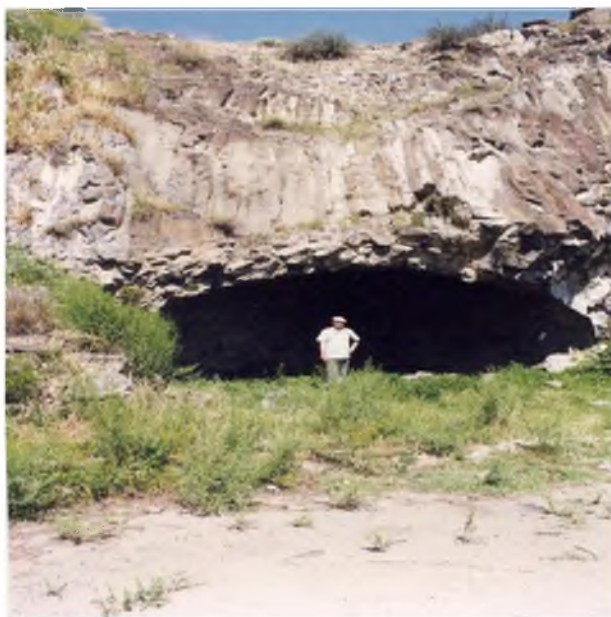
Рис. 1. Пещерная стоянка Ереван I