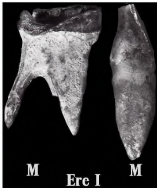
Рис. 2. Второй верхний, правый молочный моляр