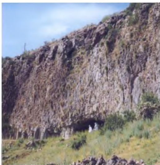
Рис. 3. Пещерная стоянка Лусакерт I