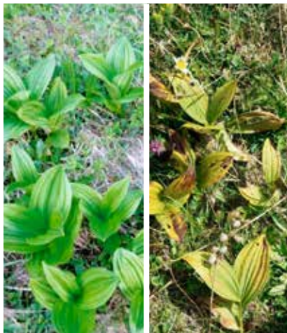
Vératres blancs en mai (à g.) et en juillet (à d.) de cette année.

Aucun vératre blanc n'a fleuri cette année en Suisse. Les jeunes plantes ont poussé aussi vigoureusement que d'habitude au printemps puis elles ont dépéri lentement pendant l'été sans que