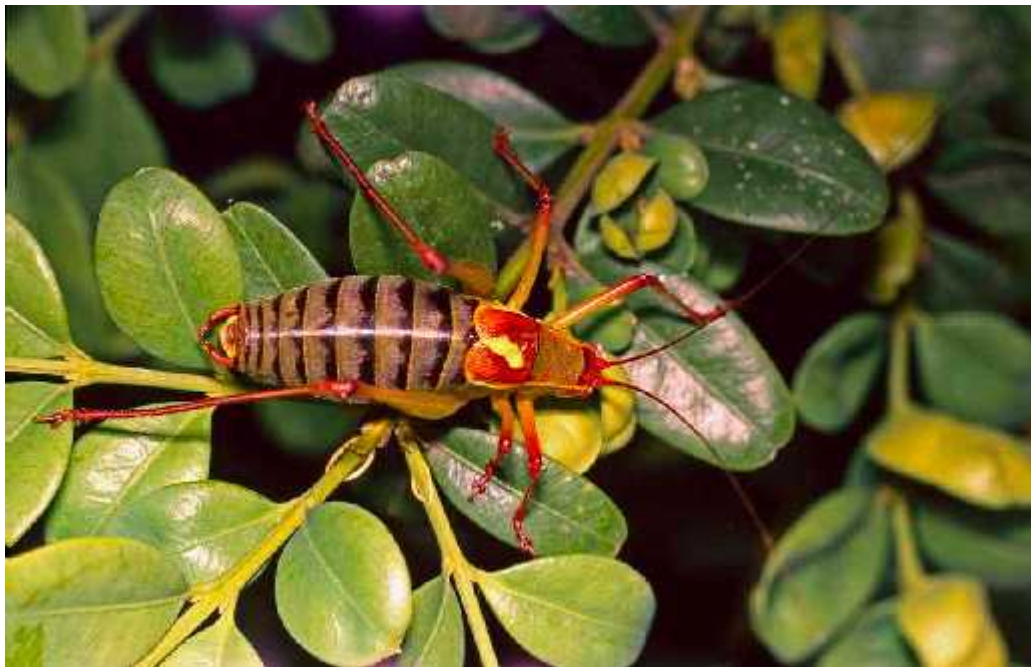
Slika 1. Barbitistes kaltenbachi , Bogomolje na otoku Hvaru

mjesta s imenom Lukovo, nemogu e je sa sigurnoš u zaklju iti o kojem je lokalitetu rije , no najvjerojatnije se radi o mjestu Lukovo smještenom u Primorskoj Hrvatskoj, otprilike 14 km zra ne linije južno od Senja (Karta 1.). Prisutnost ove vrste na spomenutim lokalitetima vrlo je upitna, budu i da do danas nije potvr ena, a sama vrsta nije prona ena niti na jednom drugom mjestu duž obale, zbog ega je trenutno poznati areal veoma fragmentiran (Karta 1.). U nedavnoj publikaciji talijanski stru njaci osporavaju nalaz iz Trsta (Massa i sur. 2012). Prisutnost B. kaltenbachi na tipskom lokalitetu u novije je vrijeme potvr ena, i to 2006. godine, kada je njema ki ortopterolog Klaus-Gerhard Heller pronašao jedinke ove vrste na dva mjesta na otoku Hvaru (Bogomolje i Su uraj; Karta 1.), fotografiraju i pritom jednog mužjaka (Slika 1.). To je prvi nalaz ove vrste od njezina opisivanja. Postoji mogu nost da je B. kaltenbachi stenoendem otoka Hvara, no potrebno je podrobno istražiti i druge potencijalne lokalitete duž obale i na obližnjim otocima, kako bismo dobili stvarnu sliku o veli ini i obliku areala ove vrste.