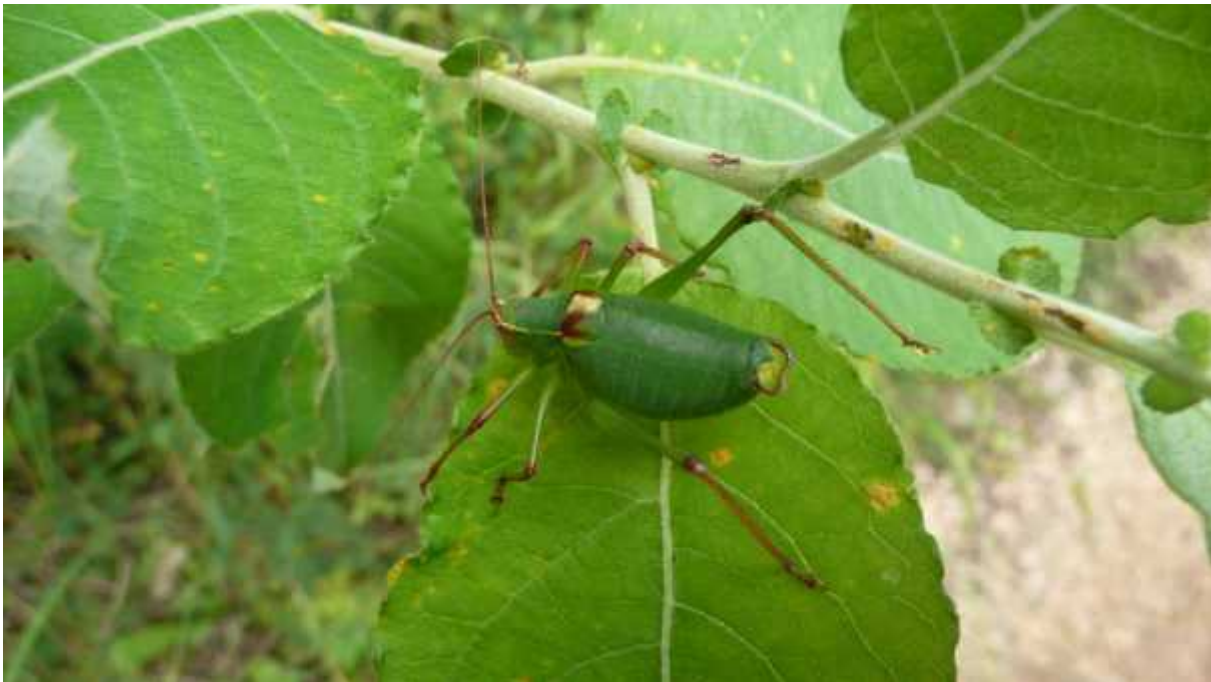
Slika 2. Barbitistes yersini , JZ obala jezera Kruš ica

krivo zapisanom nazivu mjesta. Vrsta je ina e rasprostranjena duž cijele jadranske obale i na pripadaju im otocima (otok Hvar i Obrovac nazna eni su kao terra typica restricta ; vidi Rezultati), pri emu se areal B. yersini velikim dijelom preklapa s arealom B. ocskayi , izuzev u svojem središnjem dijelu (Dalmacija), kao što je prethodno navedeno u raspravi. Osim toga, B. yersini ulazi i nešto dublje u kontinent (usporedi Karta 4. i Karta 2.), iako kao termofilna vrsta dolazi isklju ivo na toplijim staništima, gotovo redovito s primjetnim mediteranskim utjecajem. Zna ajna iznimka je nalaz s Plitvi kih jezera (Ramme 1931; vidi Rezultati), što je najsjeverniji poznati lokalitet za B. yersini u Hrvatskoj, no s obzirom na ekološke predispozicije ove vrste taj je nalaz vrlo upitan, no nije ga mogu e niti potvrditi niti osporiti. U pregledanom materijalu iz zbirke ravnokrilaca Hrvatskog prirodoslovnog muzeja u Zagrebu pronašao sam jednu jedinku s Plitvi kih jezera, no radi se o neodraslom mužjaku, tako da je mogu e ustvrditi jedino pripadnost rodu Barbitistes , ali ne i determinirati jedinku do vrste. S obzirom na geografski smještaj spomenutog lokaliteta, puno je izglednije da na tom podru ju dolazi B. serricauda , no daljnja terenska istraživanja su potrebna kako bi se sa sigurnoš u ustanovila sjeverna granica rasprostranjenosti B. yersini .