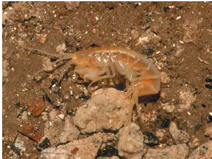
Slika 3. Endemična vrsta Niphargus miljeticus Straškraba, 1959, špilja Ostaševica, otok Mljet

Tipiska Niphargus s. steueri Schellenberg, 1935 na području Istarskog poluotoka, N. s. subtypicus Sket, 1960 u jugoistočnoj Sloveniji i sjeverozapadnoj Hrvatskoj, N. s. liburnicus Karaman, G. & Sket, 1989na području otoka Krka i na području Gorizia u Italiji. Podvrsta N. s.kolombatovici se rasprostire najjugoistočnije te ima najveći areal rasprostranjenosti od svih podvrsta vrste N. steueri (Fišer i sur., 2006).