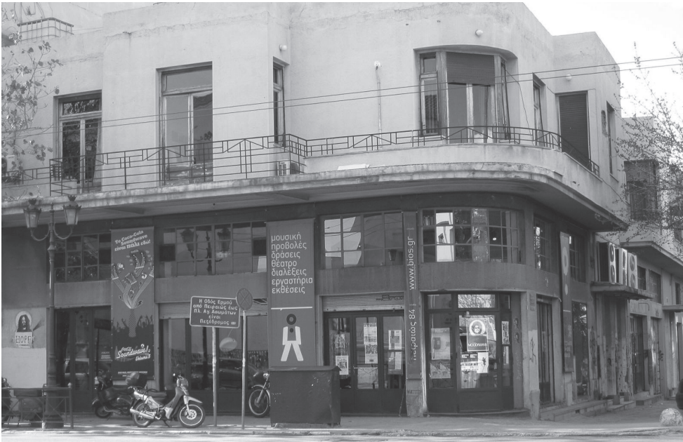
Κάτω: Πολυχώρος Bios, γωνία Πειραιώς & Σαλαμίνας, Κεραμικός