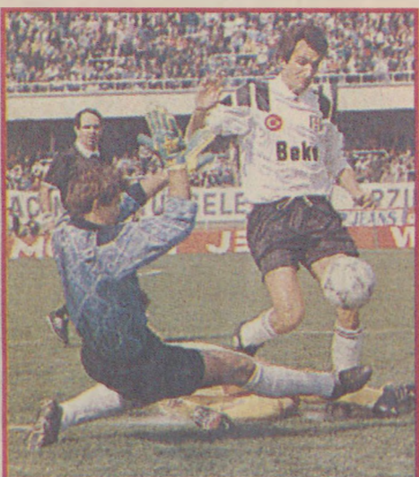
MRKELA (Siyah beyazlı futbolcu kararlı)