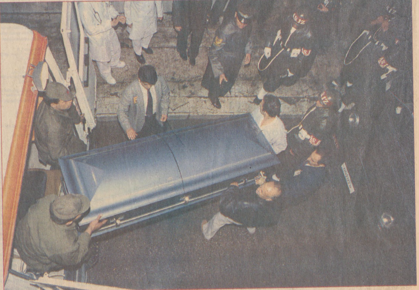
ÖZEL YAPIM TABUT Sekizinci Cumhurbaşkanı Turgut Özal'ın naaşı, Hacettepe Tıp Fakültesi Hastanesi'nden Gülhane Askeri Tıp Akademisi Hastanesi'ne önceki gece götürülürken, özel yapım bir tabuta konuldu. Siyah metalden yapılan, çift kapaklı tabutun yan tarafına, rahat taşınabilmesi için beyaz metal boru yerleştirilmişti.