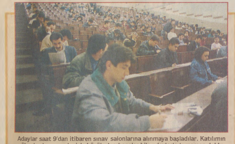
Adaylar saat 9'dan itibaren sınav salonlarına alınmaya başladılar. Katılımların yüksek olması nedeniyle büyük derhaneler bile adaylarla tamamen doldu.

Zorlu sınav ÜNİVERSİTE Seçme Sınavı, dün 76 il merkezinde, 50 ilçede ve Lefkoşa'da 1 milyon 85 bin 183 kişinin katılımıyla dün yapıldı. Bazı merkezlerde, Cumhurbaşkanı Turgut Özal'ın ölümü nedeniyle saygı duruşunda bulunuldu. ÖSS puanının, yeni sınav sistemine göre, bu yıl ÖYS puanlarına katkı getirmesi, sinava giren aday sayısını artırdı. İki sınav için ÖSYM'ye 1 milyon 154 bin 327 aday başvurdu ancak, 1 milyon 85 bin 183'ü ÖSS'ye girdi. Adaylara, 77 sözel, 77 sayısal olmak üzere toplam 154 soru soruldu. Saat 12.00'de sona eren sinava, İstanbul'da sinavlara Sağlıkçılar Cezaevi'nden 11, Metris Cezaevi'nden de 4 mahkûm katıldı. HABER MERKEZİ