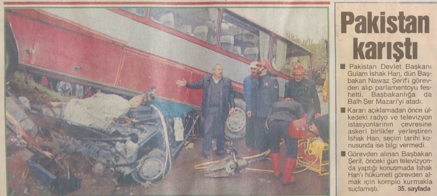
KORKUNÇ MANZARA İçinde gelin damat ile üç kişinin bulunduğu otomobili sürükleyen otobüs, yoldan çıkarak durabildi. Gelin arabasında bulunanlar parçalanarak öldü.

Bekleyen tasarı Hâkimler ve savcılara, bir türlü yasalasamadığı için isyan bayrağı açtın tasarısı, yüzde 100'ü geçen bir maas artışı öngörüyor. Tasarının yasalasması halinde, mesleğe yeni başlayan 8'inci derecenin birinci kademesindeki hâkimin maası, 4 milyon 602 bin liradan 10 milyon 641 bin liraya yükselecek. Hâkim adaylarının maaşları ise 4 milyon 925 bin lira olacak. Birinci sınıfa ayrılmış bir hâkim de, 15 milyon 320 bin lira maaş alacak. Birinci sınıfa ayrılmış, 15 yıllık bir hâkimin maası, 21 milyona yükselecek. Yüksek yargı organlarının üyeleri ile birinci sınıf hâkimler de, 23 milyon 340 bin lira almaya başlayacak.