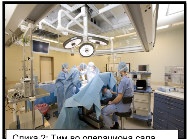
Слика 2: Тим во операциона сала Picture 2: Team in the Operational Hall