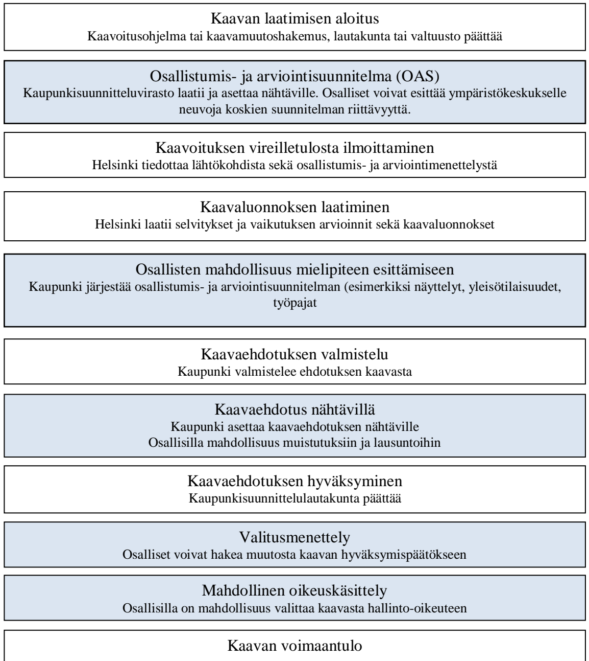
Kuvio 1: Kaavoitusprosessi. (Jauhiainen ja Niemenmaa 2006, 254 pohjalta)

Poliittista prosessia kaavoituksessa edustaa yksinkertaisemmissa tapauksissa kaupunginvaltuusto yleiskaavan suhteen ja kaupunkisuunnittelulautakunta tarkemman ohjauksen ja lopullisen hyväksynnän osalta. Kaavaluonnoksen jälkeiseen työstämiseen kaupunkilaiset pääsevät osallistumaan joko jättämällä kirjallisia mielipiteitä, soittamalla valmistelijalle tai osallistumalla asukastilaisuuksiin. Tärkeämpien kaavamuutosten kohdalla jo kaavaluonnos käytetään lautakunnan kautta.