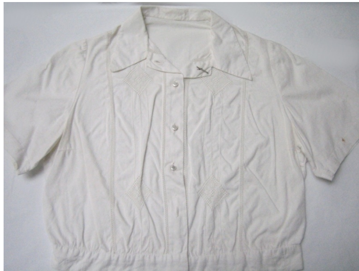
Kuva 42. Reikäompeleilla koristeltu pusero (47:1). (AL)

Virkki käsityömuseon kokoelmista löytyi aineistoon kolme (47:1–3) reikäompelulla koristeltua, naisten lyhythaisia, kauluksellisia puseroita, joissa on nappikiinnitys. Puseron 47:1 erikoisuutena olivat irrotettavat napit ja puserossa on kiinniomeltujen nappien tilalla napinlävet (kuva 42). Kaikki puserot on valmistettu vuonna 1943. Materiaalina puseroissa on käytetty val-