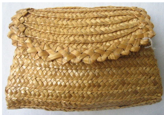
Kuva 30. Olkikukkaro (815). (AL)

Ommellut olkikukkaro (815) ja olkilaukku (814) ovat samanmallisia ja samalla tyyllillä valmistettuja. Pussiosa on saumaton, yhtenäisestä nauhasta ommeltu. Olkipalmikko on valmistettu seitsemällä oljella. Ompeleminen on aloitettu pohjasta, läppä jatkuu samasta nauhasta ja sen reunassa kiertää koristeellisesti neljällä oljella palmikoitu nauha. Kukkaron (815) koko on 12 cm x 15 cm, suuaukko on 14 cm leveä (kuva 30). Lämpän korkeus on 8 cm. Olkipalmikon leveys on 1 cm. Lämpän sivuihin ja suuaukkoon on kiinnitetty olkipalmikkoa vahvikkeeksi. Olkilaukun (814) korkeus on 18 cm ja leveys pohjassa 25 cm ja suuaukossa 20 cm. Lämpässä on ollut kiinnitin, joka on irronnut. Laukussa on pitkä hihna, joka on ommeltu laukkuun kiinni erillisenä.