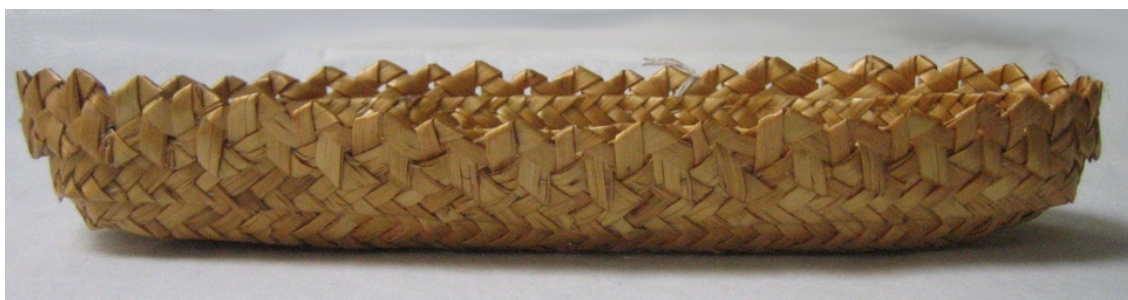
Kuva 28. Kynäkaukalo (811:2). (AL)

Leipävadit (649:1-3) ovat pyöreitä, matalareunaisia vateja, joiden halkaisija vaihtelee 21 ja 23 cm välillä (kuva 27). Leipävadit on valmistettu luonnonvärisestä olkipalmikosta. Niiden tasaiset pohjat ovat tiukalle kiepille kieritettyä olkipalmikkoa, joka on palmikoitu seitsemällä oljella. Leipävadeissa (649:1 ja 649:2) olkipalmikko jatkuu yhtenäisenä vatien reunoiksi ja viimeisenä kierroksena reunoissa on koristeellinen neljällä oljella palmikoitu reunanauha. Leipävadissa (649:3) reuna on valmistettu pitsimäisestä olkipalmikosta. Leipävadeissa on voinut olla myös sanko, mutta ne on katkaistu. Aineiston leipävadit on valmistettu vuonna 1942, ja niitä on ollut myynnissä Aunuksen työtuvalla vuosina 1942–1944.