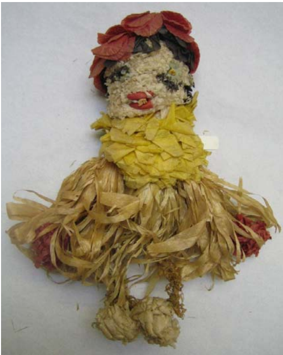
Kuva 36. Haapalastusta valmistettu nukke 435:3 edestä. (AL)

Toisenlaisiin haapalastusta valmistettuihin nukkeihin (435:1-4) käytettiin lastumateriaalin lisäksi paperinarua, silkkipaperia ja rautalankaa. Nuken 435:3 runko on tehty paperinarusta ja rautalangasta, mikä on peitetty haapalastu hapsulla (kuvat 36–37). Nuken pää, kädet sekä jalat ovat kukkia, ja ne on muodostettu silkkipaperipaloista, joiden reunat on kiharrettu. Nuken korkeus on 20 cm ja leveys 16 cm. Näiden nukkien korkeus vaihtelee 20 ja 30 cm ja leveys 10 ja 15 cm välillä. Näistäkin nukeista on olemassa sekä tyttö että poika mallit. Poikanukella 435:4 haapalastuhapsut on sidottu nippuun jalkojen rautalankoihin, päässä ja käsissä on kukkia, kuten tyttö nukellakin. Nuket on tarkoitettu koristekäyttöön, ja niitä pystyi ripustamaan päässä olevasta ripustuslenkistä. Haapalastusta valmistettuja nukkeja myytiin esimerkiksi Rajaseudun ystävien myyjäisissä Suomessa.