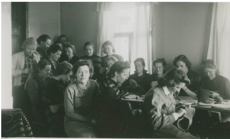
Kuva 44. Toiset opettajien tallukkakurssit.