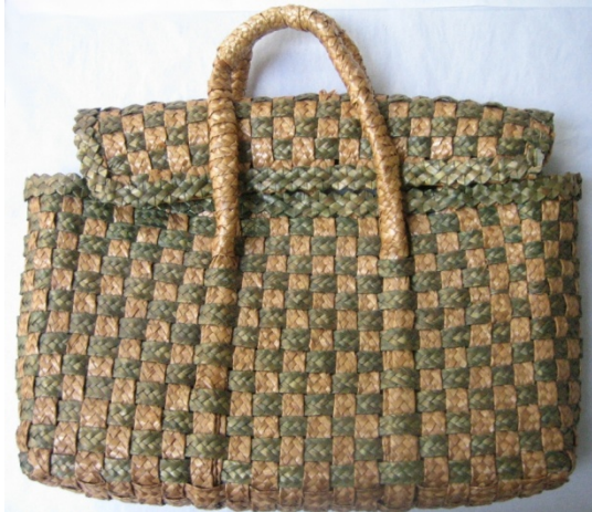
Kuva 24. Punottu olkilaukku (623:1). (AL)

oljesta. Kirjavaa olkipalmikkoa on käytetty laukussa kauttaaltaan. Myös tässä laukussa on koristeellista, neljällä oljella palmikoitua koristeellista reunanauhaa. Laukku on malliltaan ja kooltaan muuten samanlainen kuin laukku (623:1), mutta siinä ei ole läppää. Olkilaukut on valmistettu vuonna 1942.