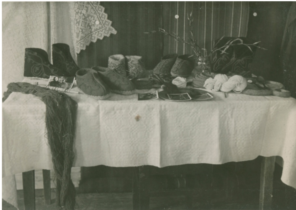
Kuva 47. Aunuksen työtuvan näyttely 1943–1944.