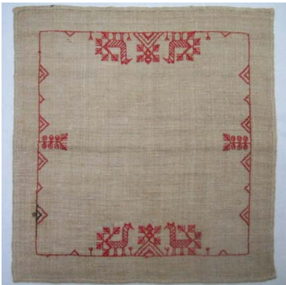
Kuva 7. Luotoksittain ommeltu pikkuliina. (AL)

Luotoksittainompelussa, josta voidaan käyttää myös nimitystä nurjaton etupistokirjonta, pienet ruudut valmistuvat sarjassa asteittain nelisivuisiksi. Pistot kulkevat kankaan lankojen suuntaisesti ja näyttävät nurjalta sekä oikealta puolelta samalta. Kuoseja ommeltaessa kangas pingotetaan suorakaiteen muotoiseen ompelukehään, ”pialaan”. 227 Luotoksit-