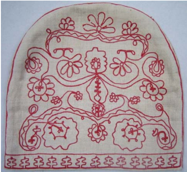
Kuva 10. Ketjuvirkkauskirjonnalla koristeltu pannumyssi (3066). (AL)

Kuvioaiheina aineiston ketjuvirkkauskirjonnassa on käytetty perinteisiä kasvi- ja eläinaiheita. Lisäksi teksteille on nauhamaisia kuvioiteja. Pannumyssiissä (3066 ja 3816) pellavakankaalle on punaisella langalla kirjottu koukeroisia kasviaiheita, ja niiden alareunassa kiertää ketjuvirkattu nauha (kuvat 10 ja 11). Kuviointi voi peittää valmistetusta tekstiilistä lähes koko pinnan, kuten esimerkiksi pannumyssiissä (3066) (kuva 10) tai olla pienempänä yksityiskohtana, kuten pannumyssiissä (3816) (kuva 11). Suuremmissa kuviokokonaisuuksissa on huomattavissa kuvioinnin symmetrisyys, kuten pannumyssiissä (3066).