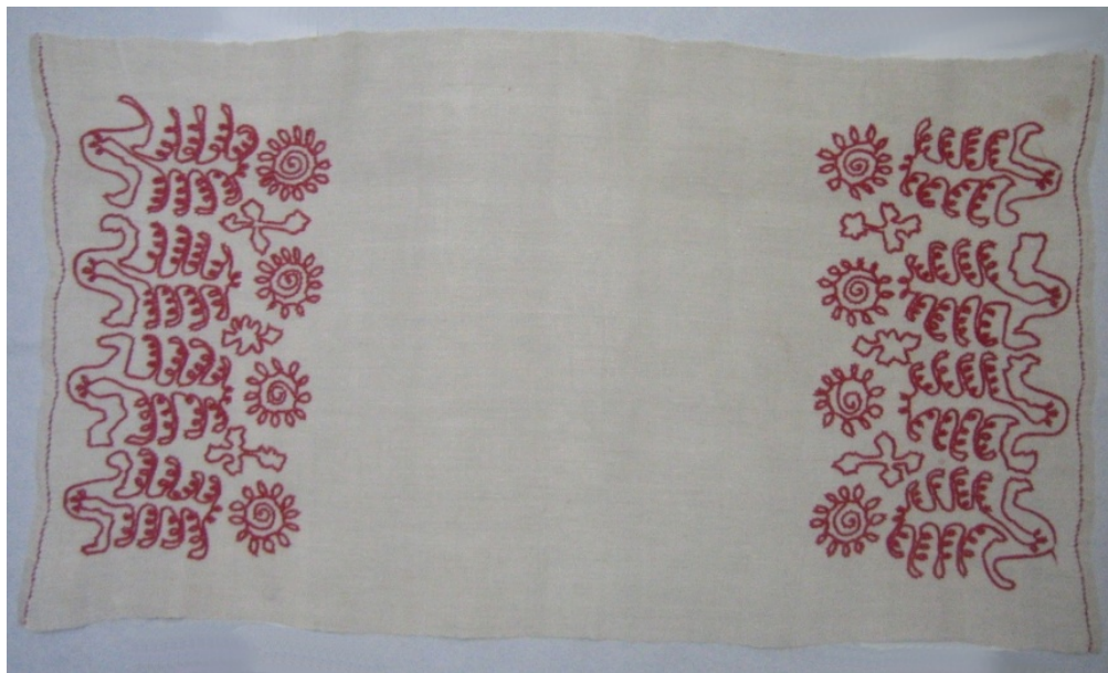
Kuva 9. Ketjuvirkkauksella koristeltu kaitaliina. (AL)

Pellavapalttinaisessa kaitaliinassa (3131) kuviot toistuvat liinan kummassakin päässä samanlaisena, kuten käspaikoissa, ja muodostuvat kolmesta erilaisesta kuviosta, jotka eivät ole jatkuvia ja jotka toistuvat useasti (kuva 9). Kirjonta on tehty valkealle pellavalle punaisella langalla. Kuvion korkeus on 16 cm. Myös kaitaliinan kuvio vastaa käspaikan pään kuviota, joka oli esillä Itä-Karjalaisten käsitöiden näyttelyssä Ateneumissa vuonna 1942 (kuva 3).