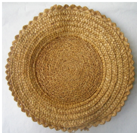
Kuva 27. Leipävati (649:2). (AL)

Leipävadit (649:1-3) ovat pyöreitä, matalareunaisia vateja, joiden halkaisija vaihtelee 21 ja 23 cm välillä (kuva 27). Leipävadit on valmistettu luonnonvärisestä olkipalmikosta. Niiden tasaiset pohjat ovat tiukalle kiepille kieritettyä olkipalmikkoa, joka on palmikoitu seitsemällä oljella. Leipävadeissa (649:1 ja 649:2) olkipalmikko jatkuu yhtenäisenä vatien reunoiksi ja viimeisenä kierroksena reunoissa on koristeellinen neljällä oljella palmikoitu reunanauha. Leipävadissa (649:3) reuna on valmistettu pitsimäisestä olkipalmikosta. Leipävadeissa on voinut olla myös sanko, mutta ne on katkaistu. Aineiston leipävadit on valmistettu vuonna 1942, ja niitä on ollut myynnissä Aunuksen työtuvalla vuosina 1942–1944.