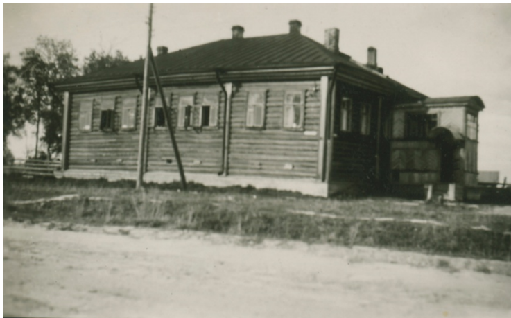
Kuva 2. Aunuksenlinnan työtupa 1941–1944. (VSA)

Aunuksen alue-esikunta oli varannut työtupaa varten talon, jonne oli saatu koneita ja tarvikkeita Suomesta. 173 Aunuksen työtupa aloitti talossa n:o 1 Nuorisoliittolaiskadun varrella 6.10.1941. Työtuvan yhteyteen oli tarkoitus järjestää lisäksi suutarinverstas sotasaaliskien korjausta varten, työtuvalla olikin aiemmin toiminut jalkinevalmistamo. Pesula järjestettiin työtuvasta erilliseen rakennukseen erityisesti lumppujen pesua varten. Pesulassa työskenteli noin kymmenen karjalaisnaista. Työtupa muutti marraskuussa 1941 taloon n:o 9 Lokakuunkadun, myöhemmin Vetehisenkatu 9:n varrelle, jonka sai kokonaan käyttöönsä joulukuun 1941 aikana (kuva 2). Uuteen tilaan muuttaminen mahdollisti työtuvan toiminnan laajentamisen. 174 Työtupa toimi Lokakuunkadulla hirsirakennuksessa miehityksen päättymiseen saakka.