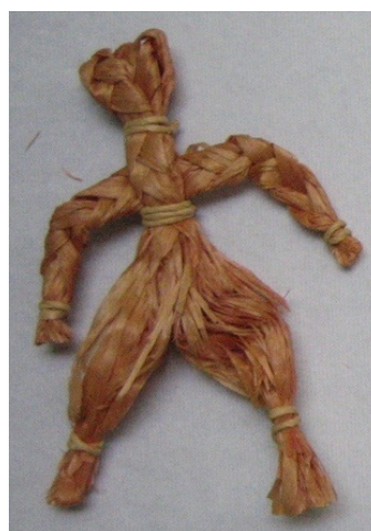
Kuva 35. Lastunukke ukko. (AL)