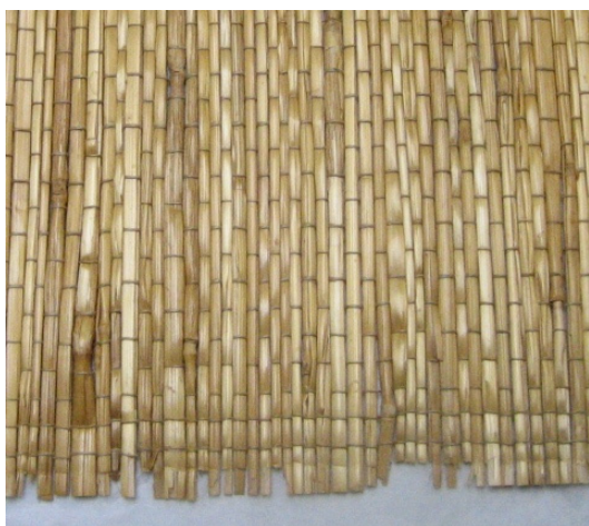
Kuva 19. Olkikaitaliina (3254:1). (AL)

Aunuksen työtuvalla olleilla kangaspuilla kudottiin pellavakangasta revinnäistöihin. Lisäksi kudottiin ikkunaverhoja ja kaitaliinoja käyttämällä materiaalina olkea ja haapalastua ja paperilankaa. 242 Aineistossa oli kudottuja olkikaitaliinoja sekä haapalastuliinoja yhteensä neljä 243 . Haapalastusta ja oljesta kudotut kankaat olivat jäykkiä käyttäen, eivätkä laskostuneet millään lailla. Niistä valmistettiinkin suoria ikkunaverhoja ja liinoja. Suomalaiset halusivat ikkunoihinsa Itä-Karjalassa jonkinlaisia verhoja, joten työtuvalla kudottiin heitä varten lastukangasta. 244 Kudotusta kankaasta oli aineistossa ainoastaan luonnonvärinen, punaruskea tasaruudullinen mallitilkku.