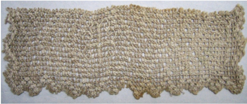
Kuva 17. Revinnäistyönä valmistettu hihankalvosin (0053). (AL)

Virkki käsityömuseon kokoelmissa olevissa vaatteissa reikäompeleet ovat yksinkertaisempia ja pienempiä kuin koristetekstiileissä. Vaatetuksessa käytetyt reikäompeleet ovat olleet vaatteissa yksityiskohtina. Puseroissa käytetyt reikäompeleet ovat aiheiltaan geometrisia ruutukuvioita ja nauhoja. Puseroiden reikäommelkuvioissa on käytetty hammasrivireikäommelta (kuva 18).