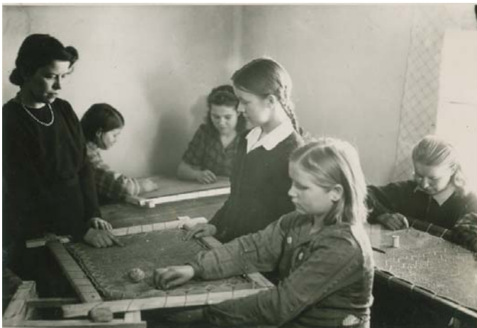
Kuva 45. Tammiukuussa 1944 järjestetty revinnäis- kurssi. (VSA)

piti vuorostaan levittää taitoa koulupiirissään koulun käsityötunneilla sekä järjestää yhdes- sä kerhoneuvojan kanssa kursseja myös aikuisväestölle. 309 Kansakoulunopettajien talluk- kakursseja pidettiin Aunuksen työtuvalla 7.–12.12.1942 ja 14.–17.12.1942. Ensimmäiselle kurssille osallistui 19 ja toiselle kurssille osallistui 18 opettajaa. 310 Tallukoiden valmista- minen onnistui hyvin myös kotioloissa. 311 Kuitenkin erikokoisten lestien ja muiden työvä- lineiden saaminen kouluille oli hankalaa, eikä varmuutta kouluissa valmistetuista tallukois- ta ole. 312