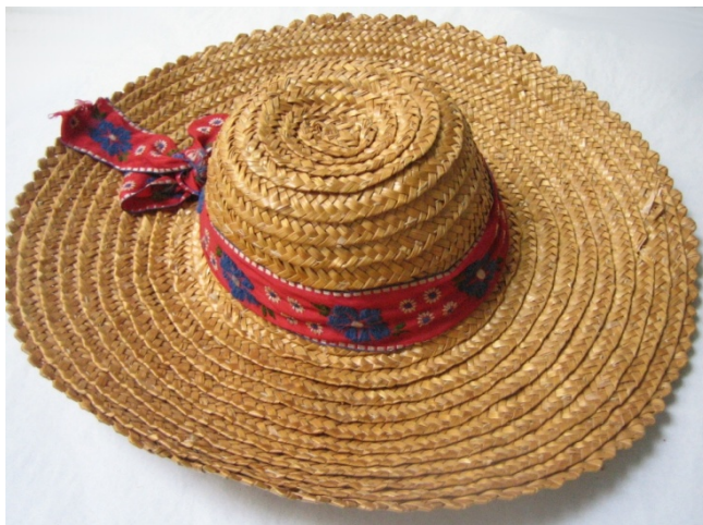
Kuva 31. Olkihattu (633). (AL)

Aineiston olkihatut 259 on valmistettu luonnonvärisestä seitsemällä oljella palmikoidusta nauhasta ompelemalla vuonna 1943. Hatun (633) kupua kiertää punainen koristenauha, jossa on sinisiä kukkia (kuva 31). Samanlainen nauha kiertää myös hatun (634) kupua. Hatun (633) lierin reunaa kiertää lisäksi koristeellinen, neljällä oljella palmikoitu nauha. Olkihatun lierin halkaisija on 37 cm ja lierin leveys on 11 cm. Kuvun korkeus on 8 cm. Olkihatussa (633) on lisäksi pukemista varten kuminauhakiinnitys leuan alle, mitä muissa hatuissa ei ole. Olkihatut (633 ja 634) ovat malliltaan samanlaisia. Kaikkien olkihattujen lierin halkaisija vaihtelee 35 ja 40 cm välillä. Hattujen kuvun halkaisijat ovat 15 cm ja korkeudet vaihtelevat 6 ja 8 cm välillä. Hatussa (632) lieri kohoaa reunoistaan hieman ylöspäin, muuten lieri on hatuissa suora. Hatun (632) lierin reunassa ei myöskään ole koristeellista olkipalmikkoa.