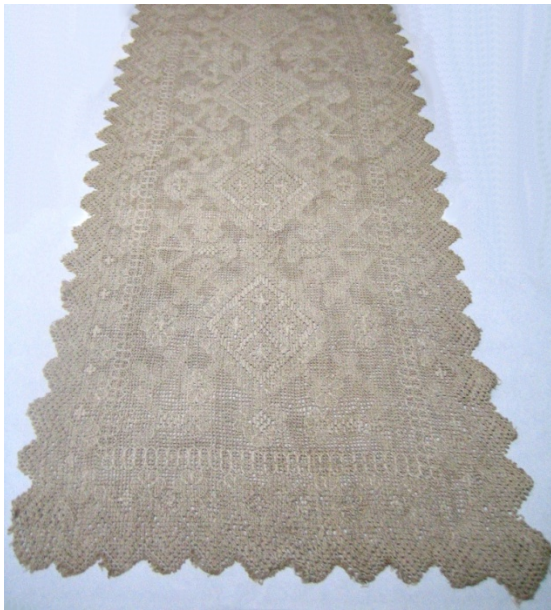
Kuva 14. Revinnäisliina (28) jonka kuviointi on geometrinen. (AL)

Aineistossa revinnäistöinä tehtyjä sisustustekstiilejä olivat revinnäisliinat ja hurstisen reuna. Revinnäisliinoissa (28 ja 30) on käytetty valkaisematonta, käsinkudottua pellavaa. Liina (30) on valmistettu harvaan kudotulle kankaalle. Molempien liinojen koko on 50 cm x 164 cm. Työt on suunnitellut Tyyne-Kerttu Virkki. Kumpaankin liinaan on valmistettu harkkoreuna aunukselaisittain. Liinan (28) kuviointi on aiheeltaan geometrinen (kuva 14). Kuviot on ommeltu vaaleammalla pellavalangalla kuin pohjakangas. Liinassa toistuu vinoruutukuvio ympäristöineen viisi kertaa kokonaan ja kuudes vinoruutukuvio on puolikas. Ruutukuviota kiertää kehys. Kuviointi on symmetrinen pitkillä sivuilla. Kuvioinnissa on käytetty ohuempaa lankaa paulapistoihin ja paksumpaa lankaa parsinpistoihin.