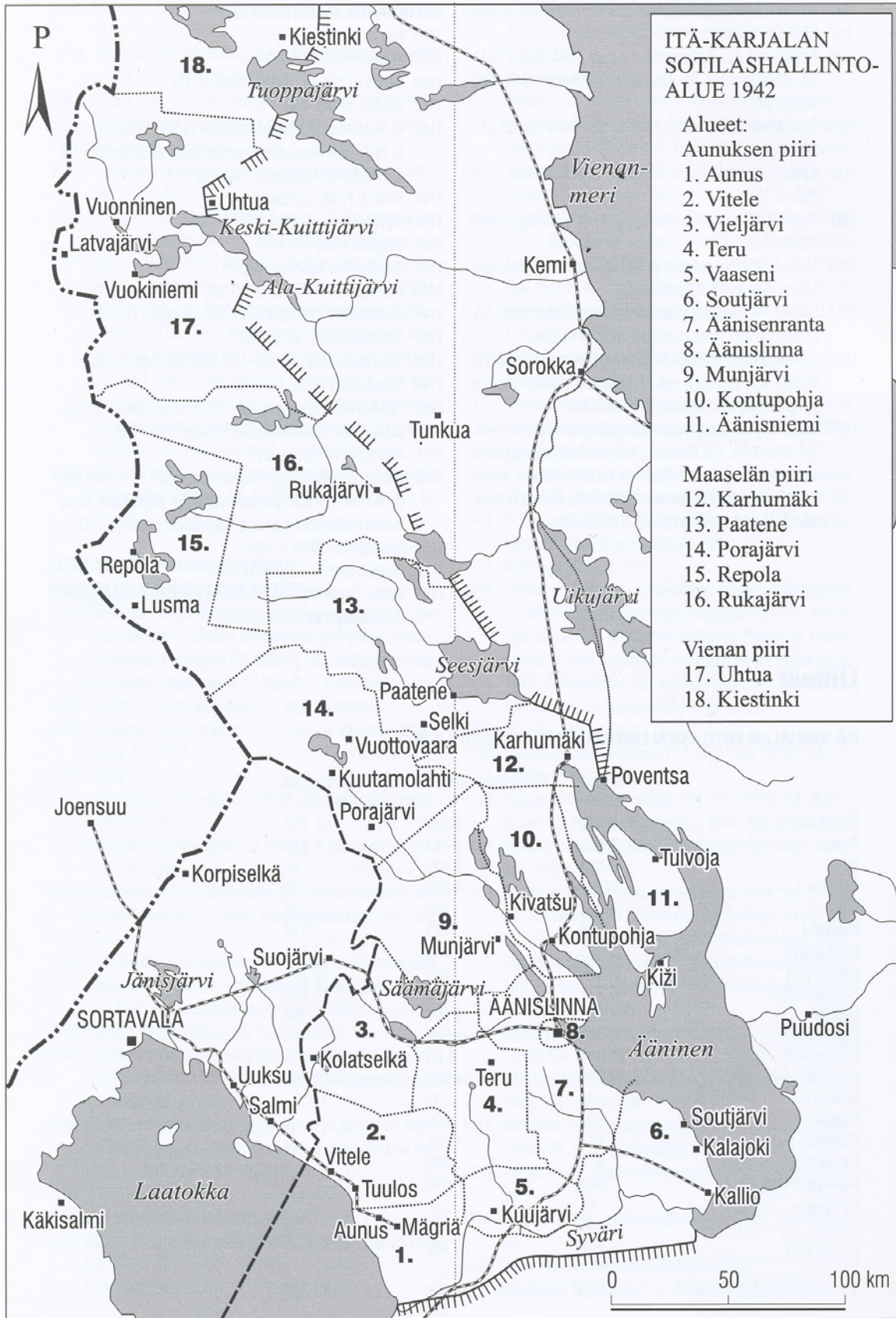
Itä-Karjalan sotilashallintoalue 1942 (Hyttiä 2008, 356).