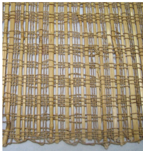
Kuva 20. Olkikaitaliina (3254:2). (AL)

Olkiliinassa (3254:1) loimena on käytetty puuvillalankaa ja kuteena rukiinolkea (kuva 19). Liinan koko on 46 cm x 126 cm. Se on kudottu palttinasidoksella tiiviiksi. Päihin on jätetty lyhyet hapsut, joita ei ole solmittu. Väriykseltään liina on luonnonvärinen. Olkikaitaliinassa (3254:2) on puolestaan loimena käytetty paperilankaa ja kuteena paperilankaa ja olkea