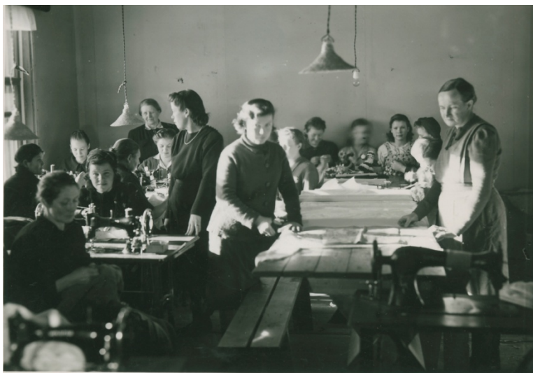
Kuva 41. Aunuksen työtuvan opetustila 1943. (VSA)

Työtuvan ompelimossa valmistettiin vaatteita ja muita tarvittavia tekstiilejä (kuva 41). Lisäksi ryhdyttiin ompelemaan vaatteita tilaustöinä Aunuksessa asuville ihmisille, itäkarjalaisille ja suomalaisille. Työtuvalla ommeltiin kaikkia mahdollisia vaatteita, valmistettiin naisten leninkejä, pienten lasten vaatteita ja miesten pussihousuja. 283