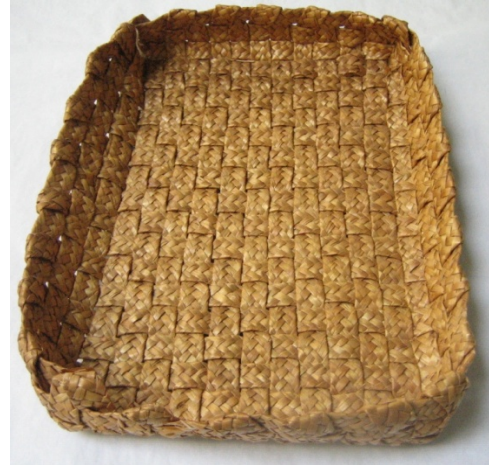
Kuva 25. Punottu olkivasu (647:2). (AL)

Lisäksi korimaisesti punottiin myös neliönmallisia olkivasuja (647:1-5), joissa on käytetty noin 1,5 cm leveää värjäämätöntä olkipalmikkoa, joka on punottu seitsemällä oljella (kuva 25). Olkivasun (647:2) koko on 21cm x 27 cm x 5 cm. Aineistossa olevien vasujen pohjan koko vaihtelee 17 cm x 15 cm ja 28 cm x 22 cm välillä. Reunan korkeus olkivasuissa on noin 4 cm.