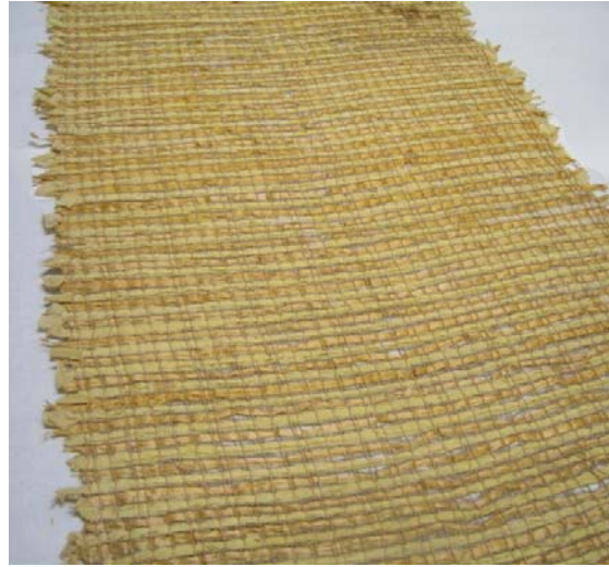
Kuva 21. Haapalastusta valmistettu liina (652). (AL)

Haapalastusta valmistetussa kaitaliinassa (651) loimena on käytetty paperilankaa ja kuteena haapalastua. Liina on väritykseltään punertava. Liinan koko on 25 cm x 160 cm. Pitkät reunat sekä päät ovat hapsuiset, eikä niitä ole solmittu. Kaitaliina (652) on valmistettu paperilankaloimeen haapalastusta (kuva 21). Haapalastu on vihertävää. Liina (652) on harvemmin kudottu kuin liina (651). Molemmat on kudottu palttinasiidoksella. Haapalastusta valmistetut kaitaliinat ovat valmistettu vuonna 1942.