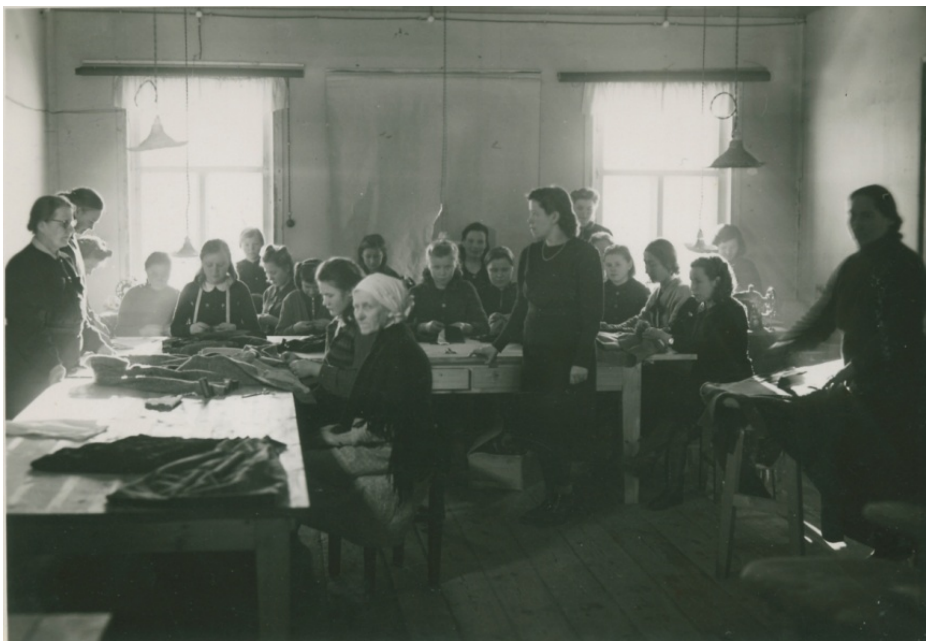
Kuva 38. Tallukoiden tekemisen opetusta. (VSA)

Vaikka Itä-Karjalassa toimi useita työtupia yhtä aikaa, jokaisella oli oma ohjelmansa, miten työskentelivät. Kaikissa työskentely oli kuitenkin suurin piirtein samanlaista, ja jokaisessa oli esimerkiksi ompelimo. 264 Aunuksen työtuvalla ompelimon toimintaan liittyi kiinteästi myös tallukoiden valmistaminen.