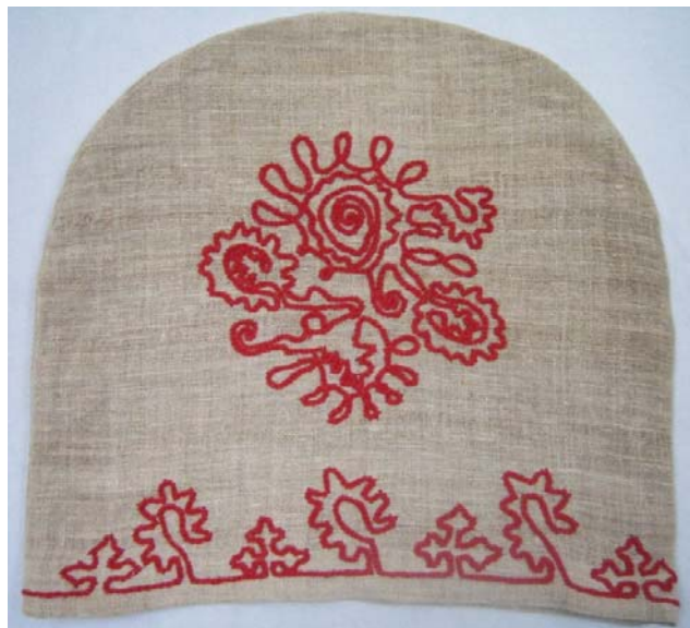
Kuva 11. Ketjuvirkkauskirjonnalla koristeltu pannumyssi (3816). (AL)

Pannumyssiin (3816) koko on 33 cm x 30 cm ja keskellä olevan koukeroisen kuvioinnin korkeus on n. 16 cm ja alareunan koukeroisen kasviaiheisen nauhan korkeus on n. 2 cm. Kuviointi on molemmissa pannumyssiissä samanlainen pannumyssiin kummallakin puolella, mutta ne eivät ole tarkasti samankokoisia. Alareunojen nauhakoristeet eivät kierrä jatkuvana pannumyssiin ympäri, vaan etu- ja takakappale ovat kirjottu erikseen.