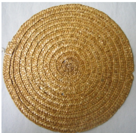
Kuva 26. Tabletti. (AL)