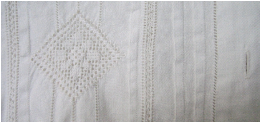
Kuva 18. Yksityiskohta reikäompeleilla koristellusta puserosta (47:2). (AL)

Virkki käsityömuseon kokoelmissa olevissa vaatteissa reikäompeleet ovat yksinkertaisempia ja pienempiä kuin koristetekstiileissä. Vaatetuksessa käytetyt reikäompeleet ovat olleet vaatteissa yksityiskohtina. Puseroissa käytetyt reikäompeleet ovat aiheiltaan geometrisia ruutukuvioita ja nauhoja. Puseroiden reikäommelkuvioissa on käytetty hammasrivireikäommelta (kuva 18).