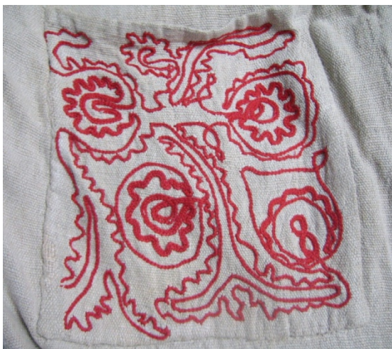
Kuva 5. Saunatakin hihan ketjuvirkkauksella koristeltu olkavarsi. (AL)