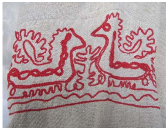
Kuva 6. Ketjuvirkkauskirjonnalla koristeltu saunatakin tasku. (AL)