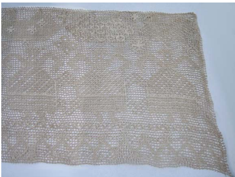
Kuva 16. Vuoteenreunus (43) kuvioaiheena ihmiset ja linnut. (AL)

vioinnissa on käytetty paulapistoja ohuemmallalla langalla ja paksummalla langalla on käytetty parsinpistoja.