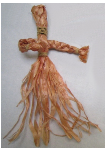
Kuva 34. Lastunukke akka. (AL)

Haapalastua valmistettiin lisäksi nukkeja ja pieniä kukkia (kuva 33). Pienten kukkasten tekemiseen käytettiin myös kreppipaperia. 262 Työtuvalla valmistettiin ainakin kahdenlaisia lastunukkeja. Toiset olivat pieniä, yksinkertaisia koristeita, joiden vartalot ja kädet muodostuivat paperinarulla sidotusta lastupalmikosta (kuvat 34 ja 35). 263 Museon kokoelmassa oli punaiseksi värjätystä lastusta palmikoituja 10–15 cm korkeita ja noin 9 cm leveitä nukkeja, joista oli sekä ukko että akka mallit.