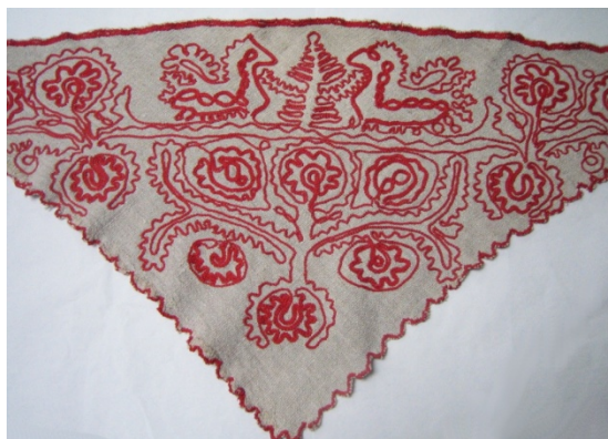
Kuva 4. Saunatakkiin liittyvä ketjuvirkkauksella koristeltu huivi. (AL)