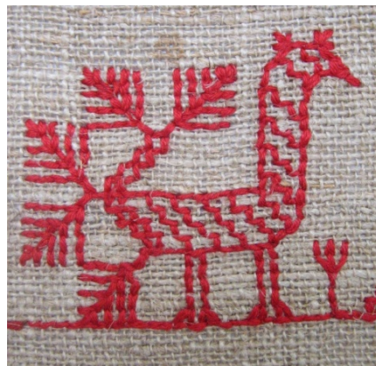
Kuva 8. Yksityiskohta luotoksittain ommellusta pikkuliinasta. (AL)