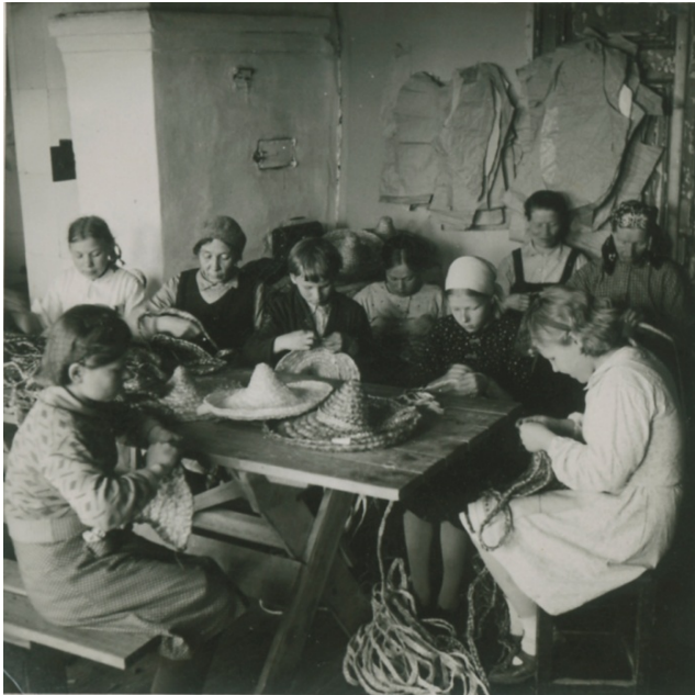
Kuva 22. Aunuksenlinnan olkihattujen valmistusta 1942.

Olkitöiden valmistuksesta ei työtuvalla järjestetty erillistä kurssia, vaan sitä opetettiin työtuvalla muuten, muun työskentelyn ohella. Olkitöitä valmistettiin sekä työtuvalla että kotitöinä. Kotityönä valmistettiin erityisesti olkipalmikkoa, mutta lopulta myös olkihattuja, kun valmistettavien hattujen mallit olivat selvillä. Työtuvalla olkitöihin erikoistuneet työntekijät kerääntyivät yhteen paikkaan valmistamaan erilaisia olkiesineitä (kuva 22). Tytöt oppivat vähitellen ompelemaan olkipalmikosta erilaisia töitä ja siirtyivät tekemään vaativampia tuotteita. 255