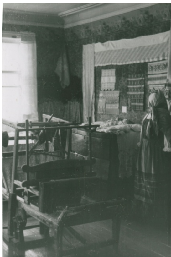
Kuva 46. Aunuksen työtuvan näyttelytila 1943 tai 1944