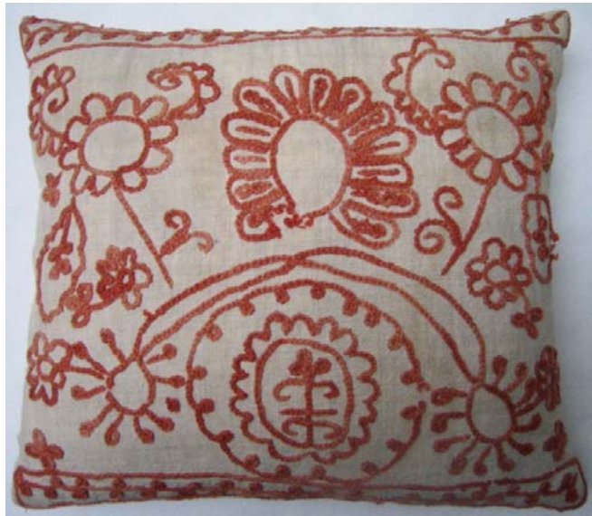
Kuva 12. Ketjuvirkkauskirjonnalla koristeltu tyyny (44). (AL)

Ketjuvirkattu kuvio voi muodostua useasta itsenäisestä kuviosta, tai koko pinnan täyttämä kuvio on yhtenäistä ketjuvirkkausta. Tyynyssä (44) (kuva 12) symmetrinen kuviointi koostuu kuudesta itsenäisestä kukkakuviosta sekä ylä- ja alareunan nauhakoristeesta. Kirjonnalla peitetään kuitenkin koko tyynyn pinta-ala sekä tyynyn etu- että takapuolella. Yksittäiset kuviot kuitenkin muodostuvat yhtenäisestä ketjuvirkkauskirjonnasta. Tyynyssä (44) kirjonta on tehty punaisella kerratulla pellavalangalla valkoiselle käsinkudotulle pellavalle. Tyynyn koko on 37 cm x 47 cm, ja se on ommeltu kiinni kolmelta sivulta koneella sekä harsittu yhdeltä. Tyyny on valmistettu vuonna 1943.