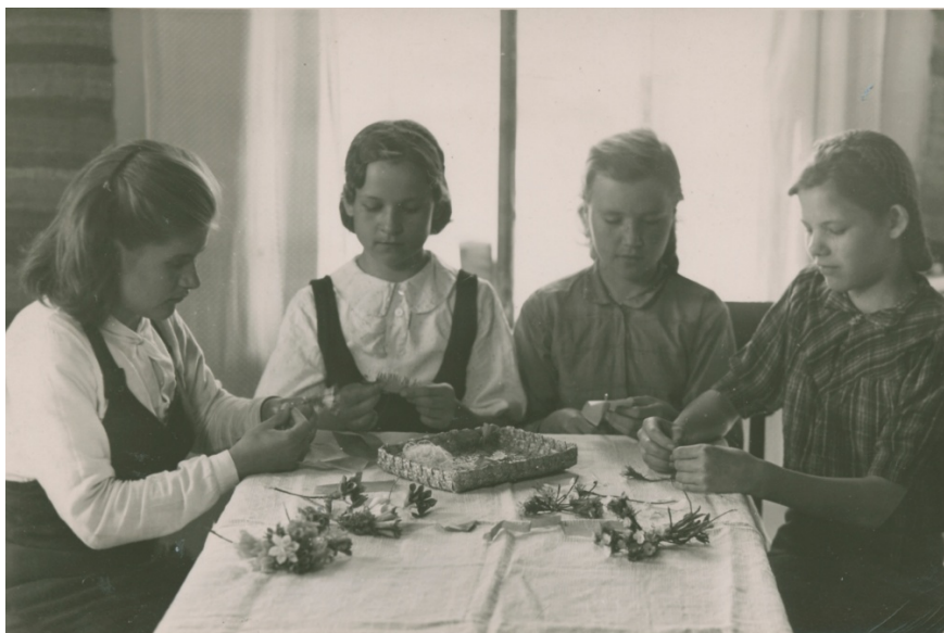
Kuva 33. Lastukukkien valmistusta 1943. (VSA)

Haapalastua valmistettiin lisäksi nukkeja ja pieniä kukkia (kuva 33). Pienten kukkasten tekemiseen käytettiin myös kreppipaperia. 262 Työtuvalla valmistettiin ainakin kahdenlaisia lastunukkeja. Toiset olivat pieniä, yksinkertaisia koristeita, joiden vartalot ja kädet muodostuivat paperinarulla sidotusta lastupalmikosta (kuvat 34 ja 35). 263 Museon kokoelmassa oli punaiseksi värjätystä lastusta palmikoituja 10–15 cm korkeita ja noin 9 cm leveitä nukkeja, joista oli sekä ukko että akka mallit.