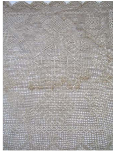
Kuva 15. Revinnäisliina (30) jonka koristeaiheina ovat geometriset muodot, ihmiset ja linnut. (AL)

Kaitaliinassa (30) kuvioaiheena ovat kasvit ja ihmiset ja eläimet ja geometriset muodot (kuva 15). Työn reunoissa kiertää kirjottu kehys. Kuviointi toistuu symmetrisenä vastakkaisesti pitkillä sivuilla. Kuviot on ommeltu kahdella erivahvaisella vaalealla langalla. Ku-