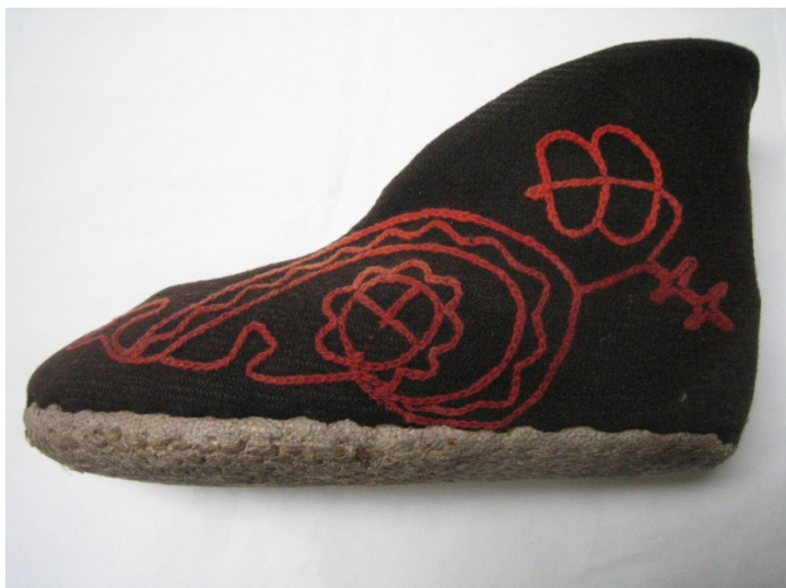
Kuva 40. Tallukan tapaan valmistettu aamutossu (68:1–2). (AL)

Aunuksen työtuvalla valmistettiin tallukkaperiaatteella myös tohveleita sisäkäyttöön. Niihin valmistettiin pohja samalla tavalla, kuin ulkokäyttöisiin tallukkaisiin. Muuten sisäkäyttöön tarkoitettut tallukkaat eivät olleet yhtä paksuja. Tohveleita koristeltiin lisäksi ketjuvirikkauskirjonnalla. 282