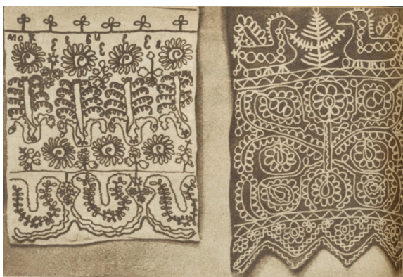
Kuva 3. Itä-Karjalan käsitöiden -näyttelyssä esillä olleita ketjuvirkattuja käspaikanpäitä. (Omin Käsin 4/1942, 6)

Tuotteiden kuvioinnin suunnittelussa esimerkiksi ketjuvirkkauskirjonnan kuvioita pyrittiin kopioimaan alueelta kerätyistä tekstiileistä, kuten käspaikan päästä. Tarkkaan kopiointiin ei kuitenkaan riittänyt kunnolla aikaa, ja kerättyjen tekstiilien kuvioinneista saatettiin kopioida ainoastaan pieniä osia. Pääasiana työtuvalla työskentelyssä oli, että tekniikka opittiin. Valmistettuihin tuotteisiin, kuten tohveleihin ei ollut olemassa määrättyä kuviota, vaan kaikista tuli koristeluiltaan yksilöllisiä. 223