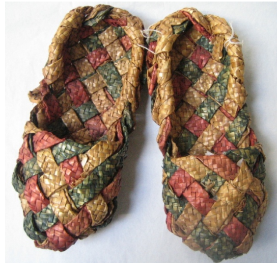
Kuva 23. Punomalla valmistetut, kolmiväriset olkivirsut (625). (AL)

Olkityönä valmistetuista jalkineista esimerkkinä on punomalla valmistetut olkivirsut (625) (kuva 23). Kolmivärisissä olkivirsuissa on käytetty punaista, vihreää ja luonnonväristä olkipalmikkoa. Punottaessa on käytetty kahta päällekkäistä olkipalmikkoa, jotka on letitetty seitsemällä oljella. Pohjan pituus virsuissa on 25 cm ja leveys 10 cm. Kaikki aineistossa olevat olkivirsut (625, 625:1-3) ovat samankokoisia, ja ne on punottu käyttämällä kahta päällekkäistä olkipalmikkoa.