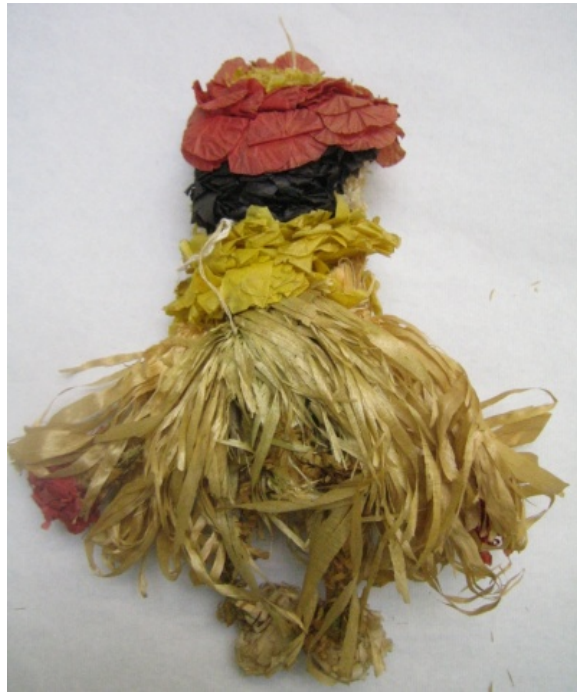
Kuva 37. Haapalastusta valmistettu nukke 435:3 takaa. (AL)