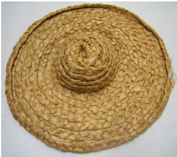
Kuva 32. Lastuhattu (627). (AL)

Lastuhattujen (626–628) valmistamiseen käytetty palmikko on valmistettu palmikoimalla kolmella haapalastunipulla. Lastupalmikko on näin ollen olkipalmikkoa paksumpaa. Työtuvalla valmistettujen lastuhattujen palmikko oli noin 2 cm leveää, ja siitä ommeltiin käsin hattuja.