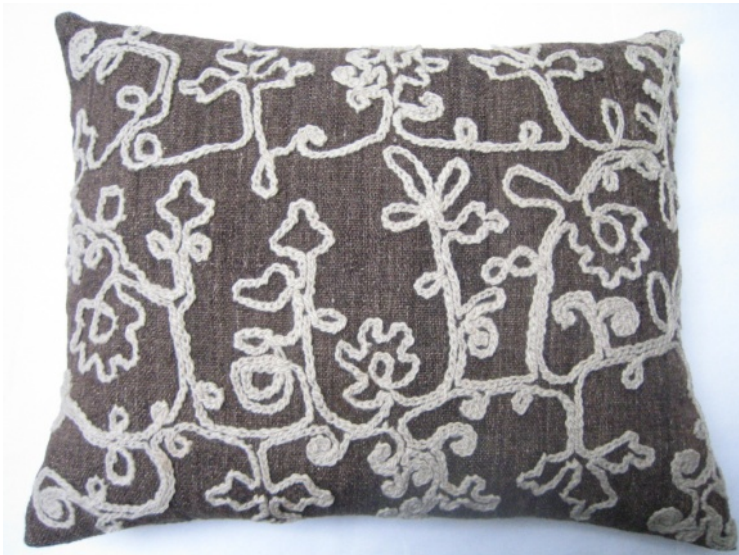
Kuva 13. Ketjuvirkkauskirjonnalla kuvioitu tyyny (772). (AL)

35 cm x 44 cm. Tämäkin tyyny on harsittu kiinni yhdeltä sivulta, mutta muuten se on ommeltu koneella. Kuviointina on tyylitelty lehtiaihe, joka on vain yhdellä puolella tyynyä.