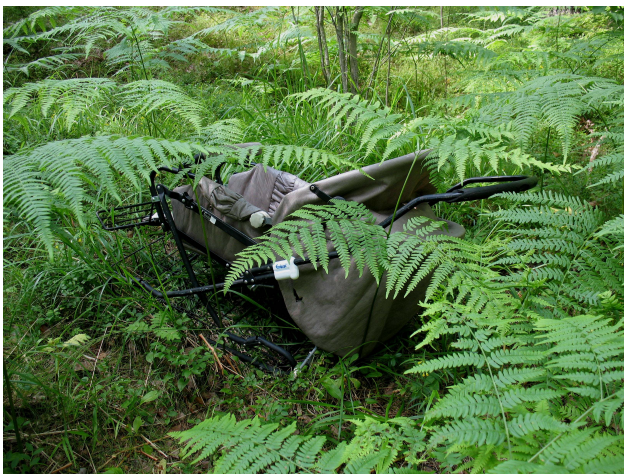
Pekan kuva: Luontoon kuulumatonta