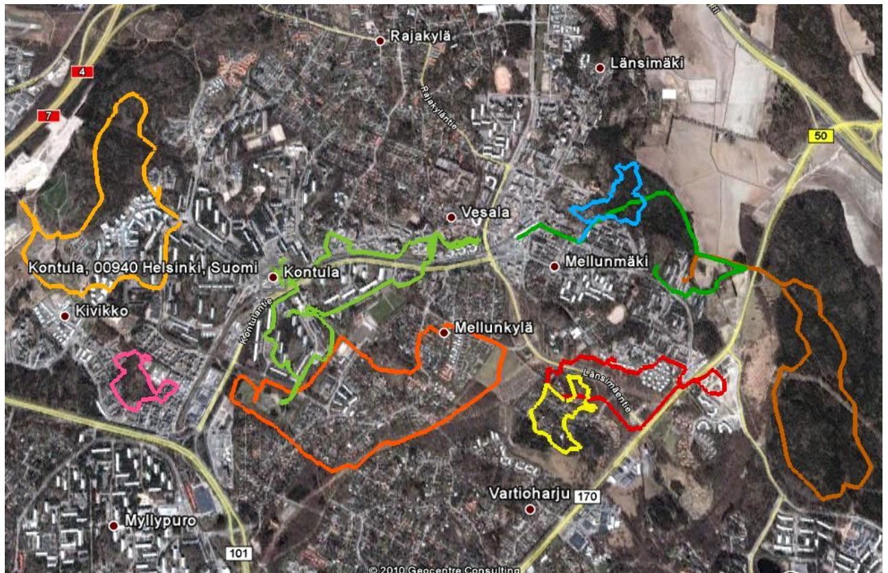
Kuva 3. Kävelyhaastatteluiden reitit

Kävely mahdollistaa liikkumismuotona reiteiltä poikkeamisen ja kiinnostavien näkymien perässä harhailemisen monia muita liikkumismuotoja paremmin. Haastatellut mellunkyläläiset eivät juuri suunnittele kävelyreittejensä etukäteen, vaan valitsevat reitilleen suunnan ja ovat valmiita seuraamaan viehättäväksi tai mielenkiintoiseksi kokemaansa ympäristöä.