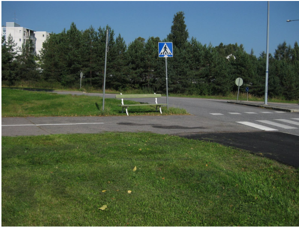
Ainoa penkki kävelyreitillä varrella