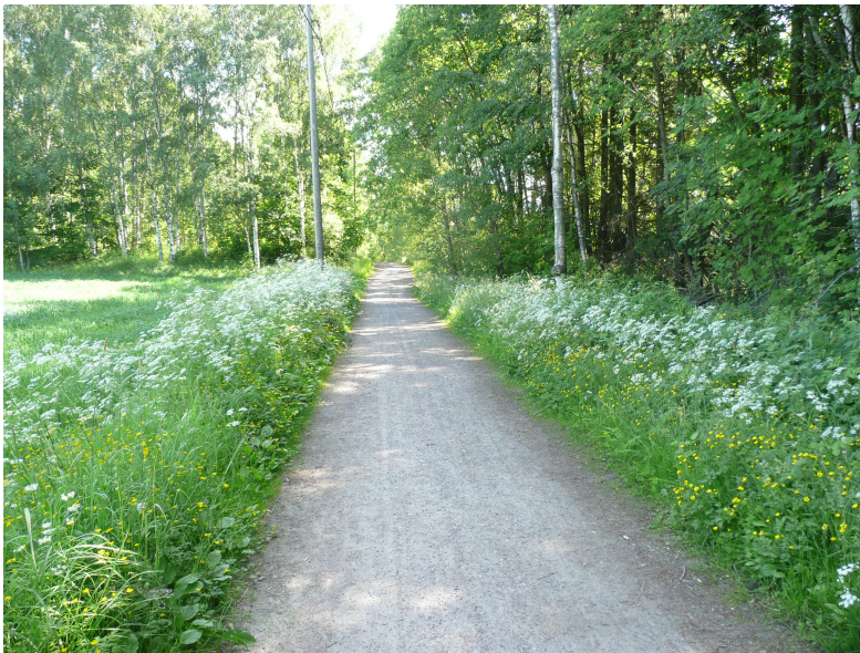
Kuva 2. Jonnan kuvateksti: Pellonpienareet, koiranputket - perintömaisemaa, suomileffaa, joku haikea kaipuu suomalaisiin maalaismaisemiin (vaikkei niistä olekaan omakohtaisia kokemuksia, kummallista!)

Ensimmäisten haastattelujen aikana, jotka tehtiin kahvilassa tai haastateltavan kotona puhuimme yleisesti siitä, mikä on tärkeää ja mikä epämiellyttävää asuinympäristössä. Lisäksi kävimme läpi haastateltavan asumishistoriaa ja eri ympäristöihin liittyviä muistoja. Haastateltavat ovat syntyjään ympäri Suomea ja asuneet Mellunkylässä eripituisia ajanjaksoja. Lyhin asumishistoria Mellunkylässä on kolme vuotta alueella