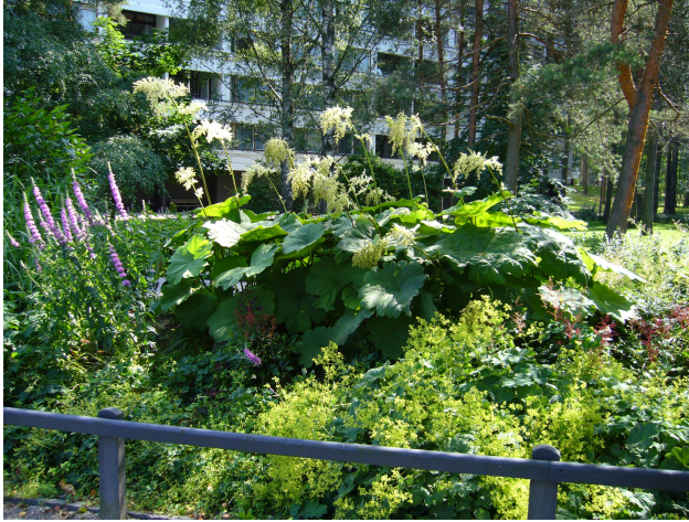
Siirin kuva. Kontulan asukaspuiston istutuksia.