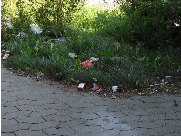
Eeva kuva: Roskia