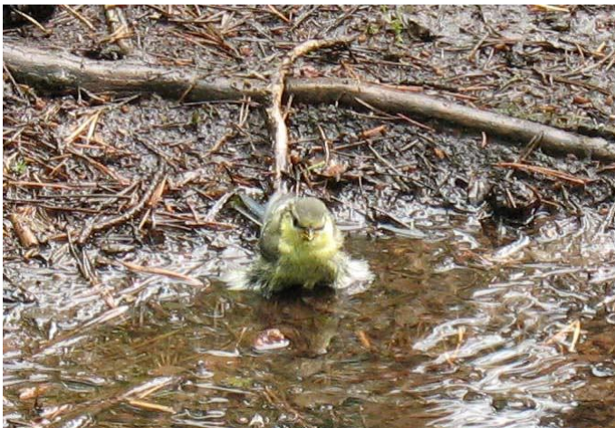
Pekan kuva: Peseytyvä linnunpoika