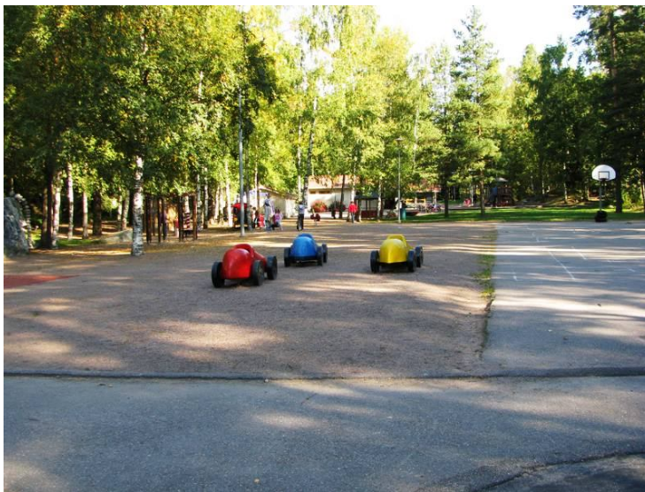
Kuva 8. Mikan ja Riikan kuva Mellunmäen asukaspuistosta

Viheralueista etenkin puistot sekä leikki- ja urheilukentät ovat tärkeitä aikuisten ja lasten kohtaamispaikkoja. Yhtenä puistojen tärkeimmistä tarkoituksista voikin nähdä olevan kannustamisen erilaisten ihmisten kohtaamisiin (Low et al. 2005, 209). Monien haastateltujen muistot kiinnittyivät etenkin lapsuuden aikaisiin leikkipuistoihin, joissa