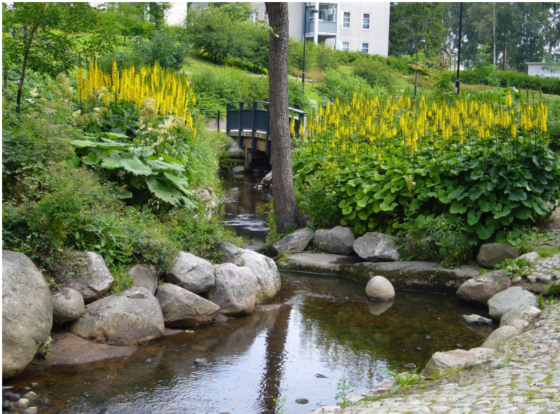
Kuva 7. Siirin ottama kuva Vesalan Aarrepuistosta

Ympäristön hoitamattomuutta, roskaisuutta ja epämääräisyyttä pidettiin suurimpina negatiivisina tekijöinä viheralueilla. Rakennetuilla viheralueilla ja istutuksissa arvostettiin esteettistä suunnittelua, hyvää hoitoa ja huolenpitoa. Rakennetun ja toisaalta luonnontilaisen viherympäristön arvostus jakoi haastateltavia, mutta kukaan metsissä