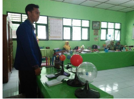
Optimalisasi Penggunaan Laboratorium