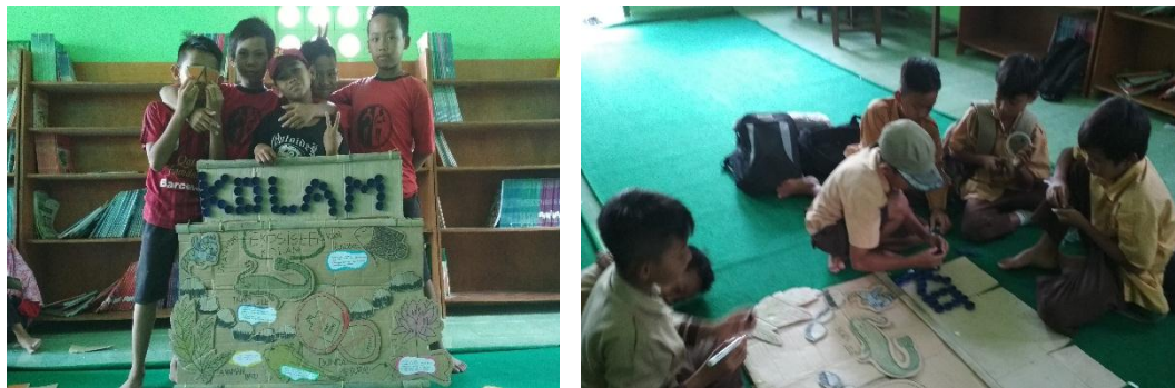
Kaderisasi Adiwiyata (Kader Kolam Sekolah)