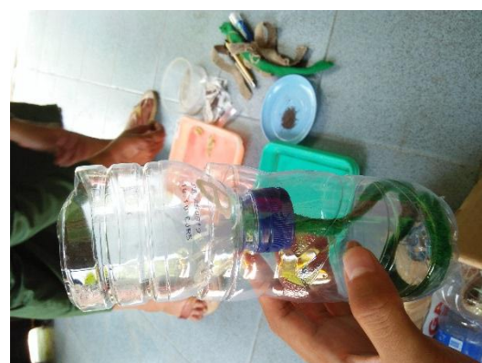
Dokumentasi 4. Pembuatan Hidroponik