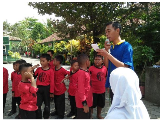
Class Meeting “Peringatan Hari Pahlawan”