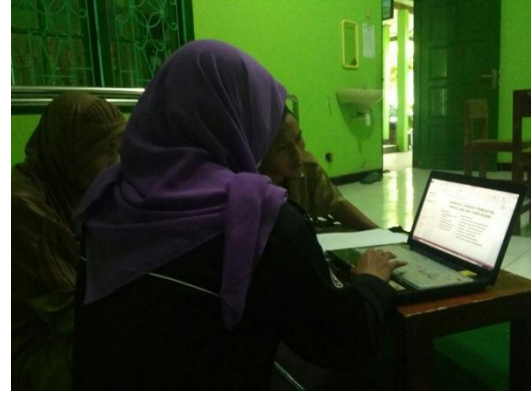
Pelatihan MS. PowerPoint