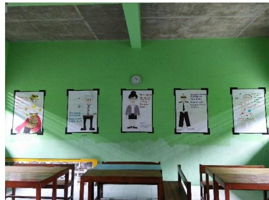
Pengelolaan Fisik Kelas