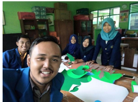
Dokumentasi 2. Pembuatan Mading Sekolah