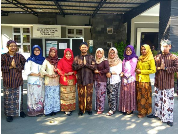
Foto 1. Memakai baju adat Jawa pada setiap tanggal 20