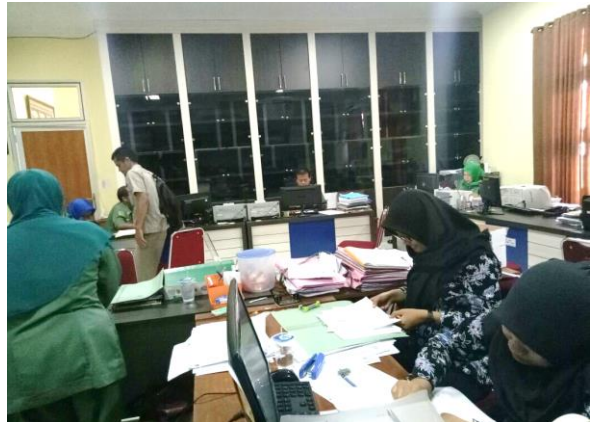
Foto 4. Kegiatan pengarsipan SPJ