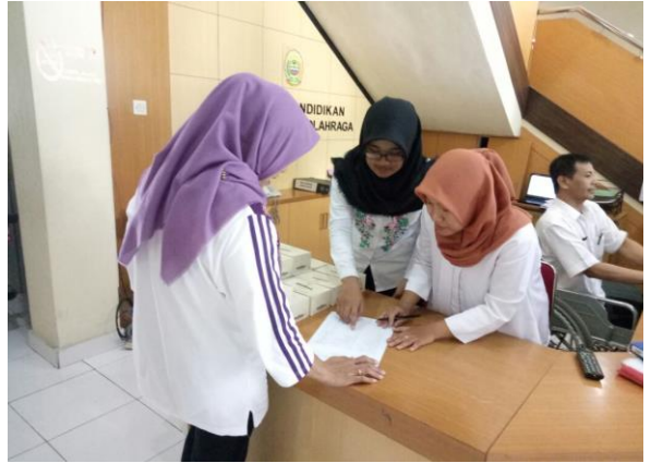
Foto 2. Penanggungjawab presensi kegiatan