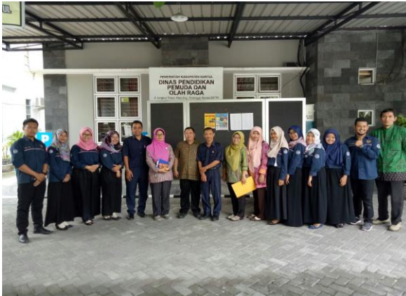
Foto 3. Kunjungan Jurusan AP