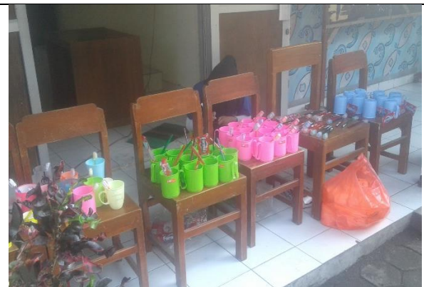
Gambar . Peralatan untuk Sikat Gigi Bersama