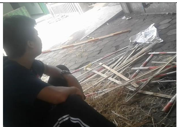
Gambar . Pembuatan Kerangka Taman dari Bambu