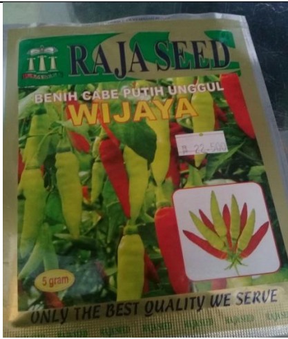
Gambar . Benih Tanaman Cabai