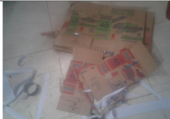
Gambar . Alas Bingkai Slogan