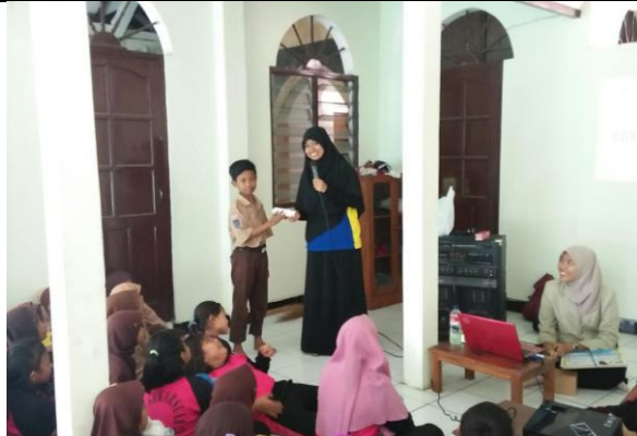
Gambar . Pemberian Hadiah Bagi Siswa yang Berhasil Menjawab Pertanyaan