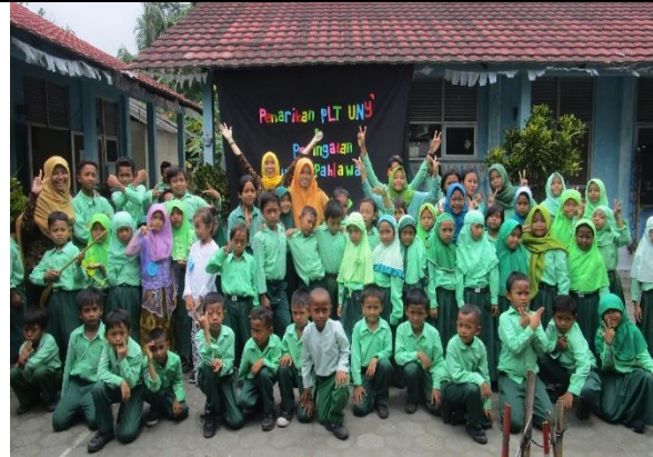
Gambar . Foto Bersama Siswa SDN 1 Sekarsuli