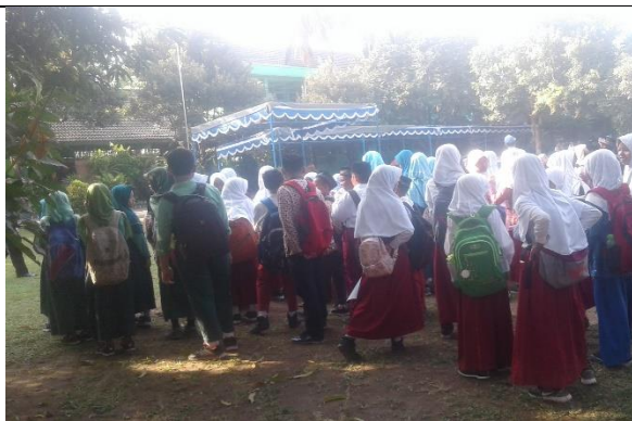
Gambar . Pendampingan Lomba MTQ