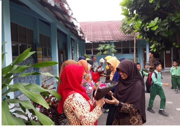
Gambar . Pemberian Buket Bunga dalam Rangka Hari Guru Internasional