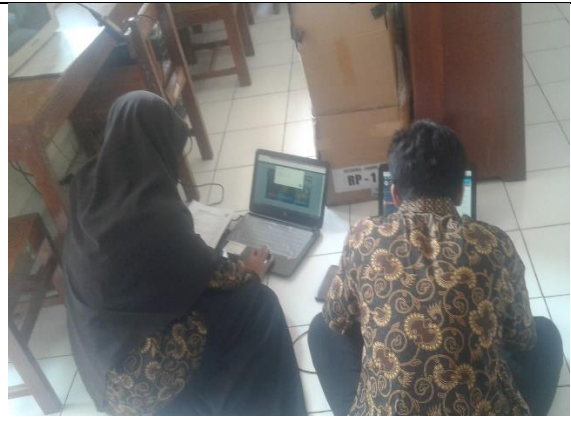
Gambar . Pengisian Data Dapodik