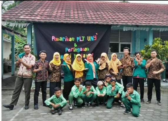
Gambar . Foto Bersama Mahasiswa Magang III UST