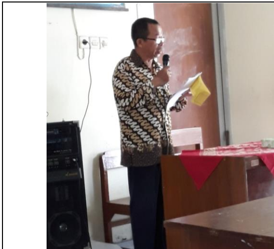
Gambar 1. Penerjunan Mahasiswa PLT oleh DPL