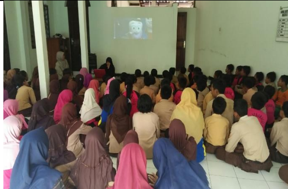
Gambar . Penyampaian Materi “Merawat Gigi” oleh Mahasiswi UGM