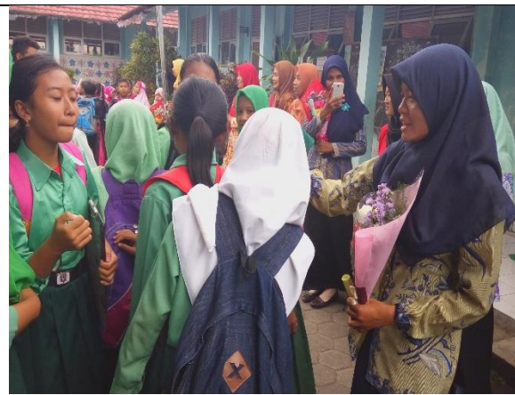
Gambar . Siswa Mengucapkan Selamat Hari Guru Internasional