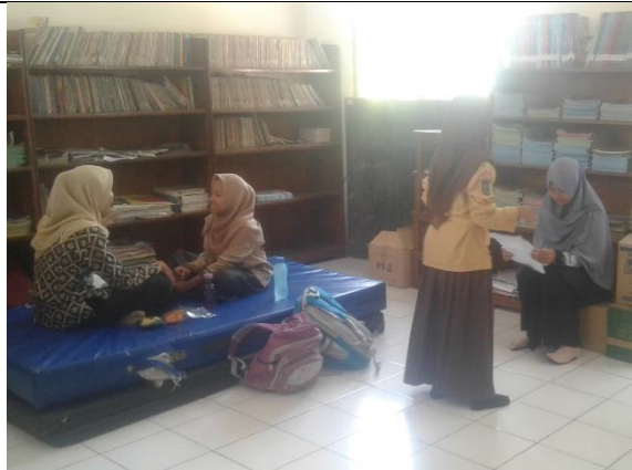
Gambar . Pendampingan Latihan Lomba MTQ