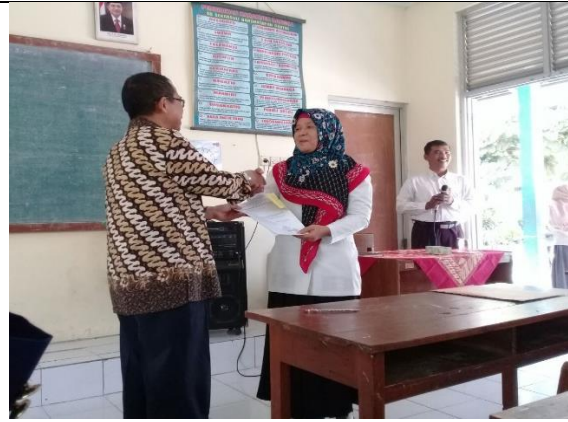
Gambar 4. Serah Terima Mahasiswa PLT