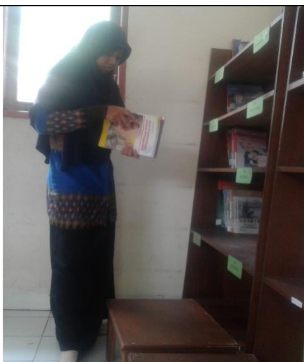
Gambar . Penataan Buku yang Telah Diberi Label