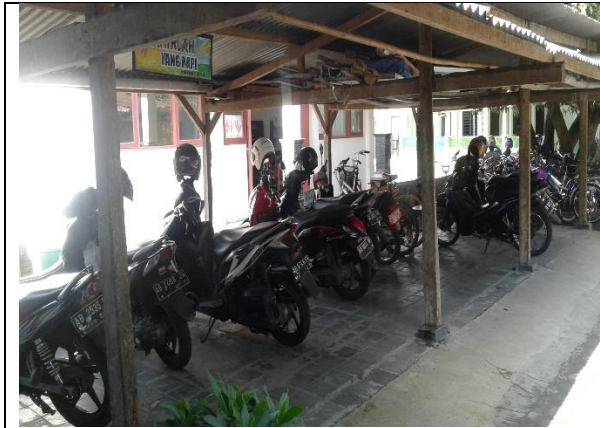
Gambar . Observasi Lingkungan Sekolah