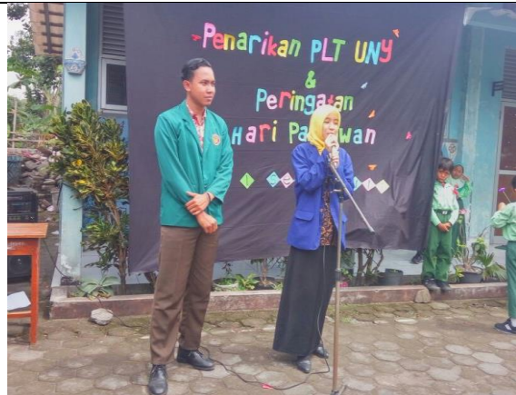
Gambar . Juri Duta Pahlawan