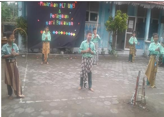
Gambar . Penampilan Tari Pong-pongan