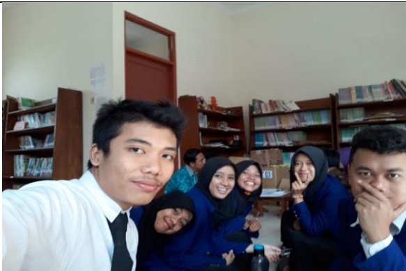
Gambar . Diskusi Team PLT