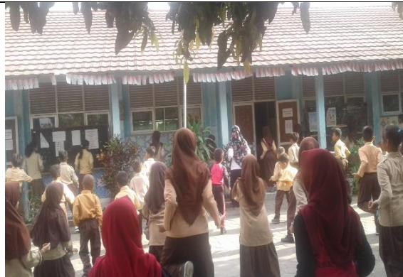
Gambar . Senam Setiap Hari Jumat