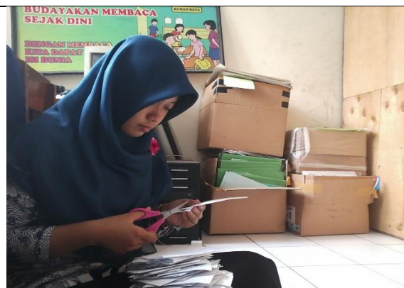
Gambar . Pemotongan Kantong Buku Perpustakaan