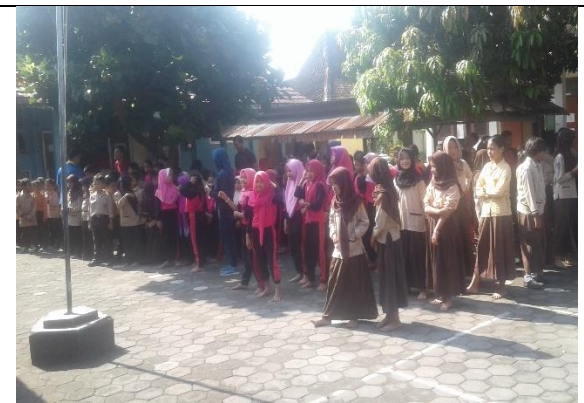
Gambar. Siswa Bersiap Melakukan Sikat Gigi Bersama