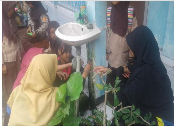
Gambar . Kerja Bakti