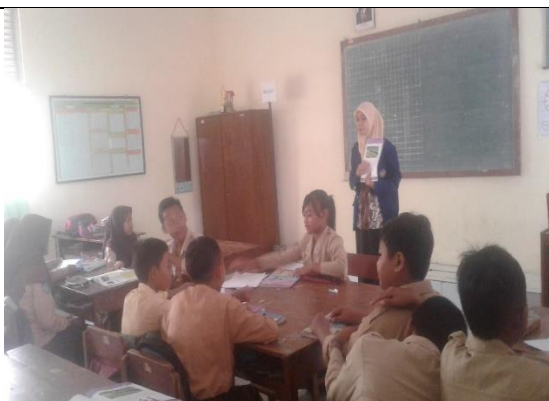
Gambar . Praktik Mengajar Terbimbing