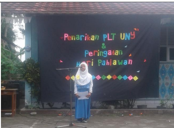
Gambar . Peserta Duta Pahlawan Kelas 5