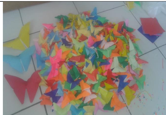
Gambar . Pembuatan Hiasan Kupu-kupu