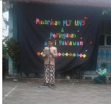
Gambar . Peserta Duta Pahlawan Kelas 4