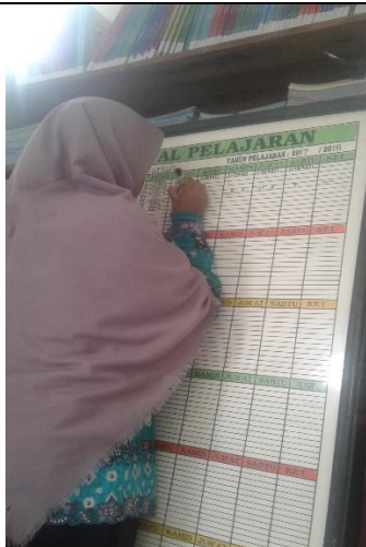
Gambar . Penulisan Ulang Jadwal Pelajaran