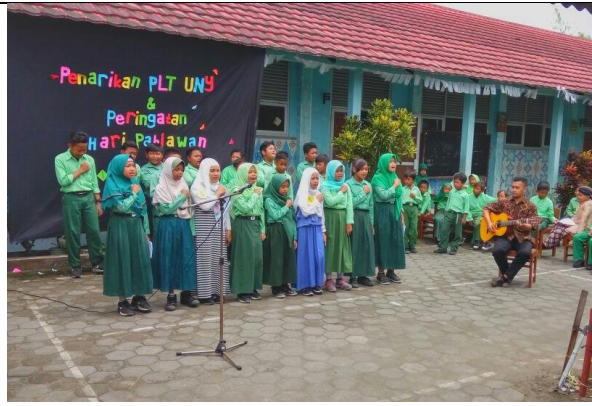
Gambar . Penampilan Musikalisasi Puisi dan Menyanyi Lagu Daerah