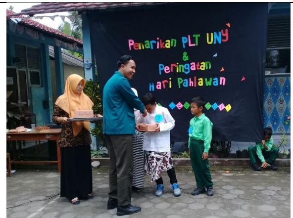
Gambar . Pembagian Hadiah Pemenang Duta Pahlawan