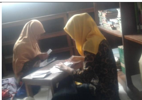
Gambar . Pembuatan Kantong Buku Perpustakaan