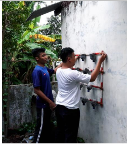
Gambar . Pembuatan Tanaman Gantung Dari Botol Bekas