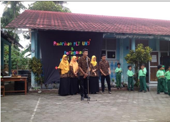
Gambar . Pamitan Mahasiswa PLT