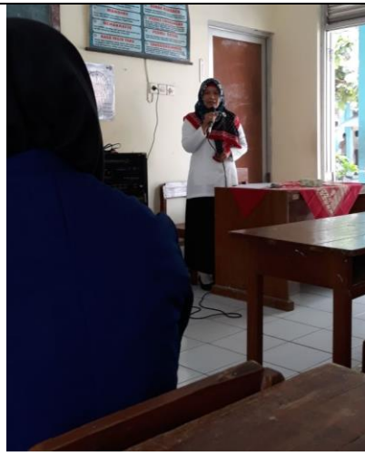
Gambar 2. Penerimaan Mahasiswa PLT dari Pihak Sekolah