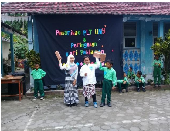
Gambar . Pemenang Duta Pahlawan