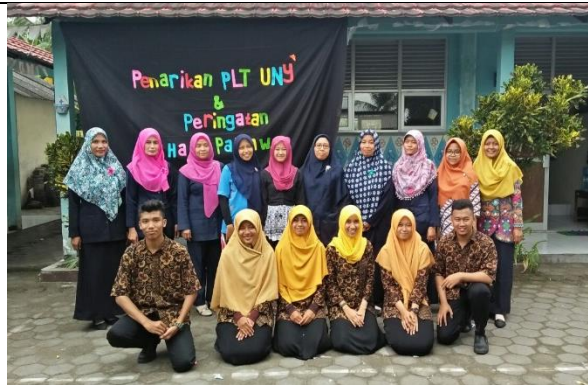
Gambar . Foto Bersama Guru SDN 1 Sekarsuli