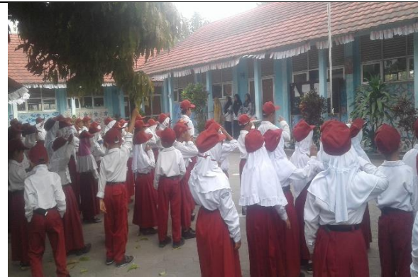
Gambar . Upacara Bendera Setiap Hari Senin