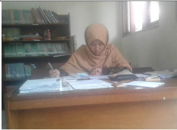
Gambar . Rekapitulasi Surat Masuk