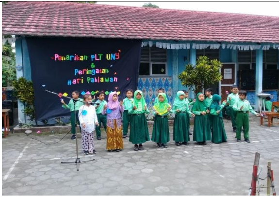
Gambar . Penampilan Menyanyi Guruku Tersayang