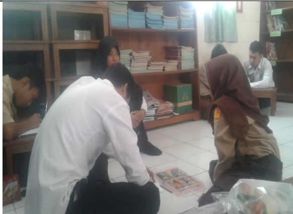
Gambar . Pendampingan Peserta Lomba MTQ