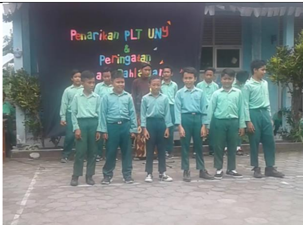
Gambar . Penampilan Menyanyi Lagu Wajib Nasional dan Daerah