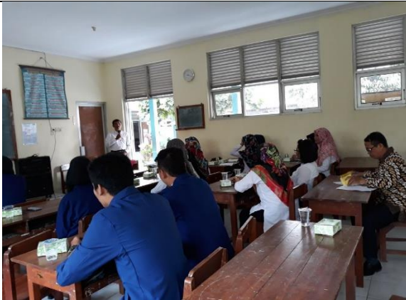
Gambar 3. Penerjunan Mahasiswa PLT