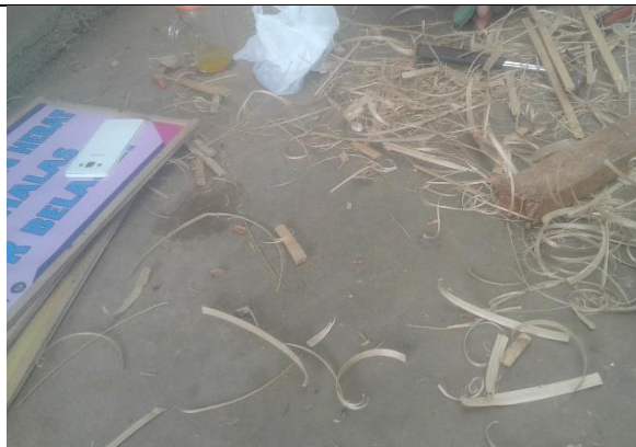
Gambar . Pembuatan Bingkai Slogan