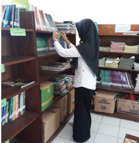
Gambar . Pemasangan Katalog Buku