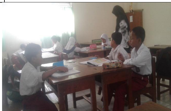
Gambar . Observasi Kegiatan Pembelajaran