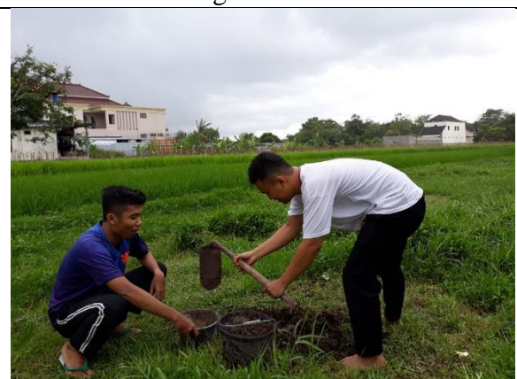
Gambar . Persiapan Tanah untuk Menanam