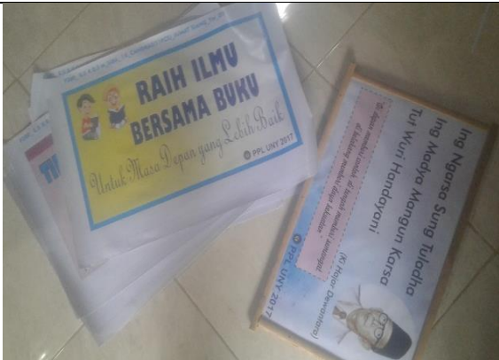
Gambar . Pembuatan Banner Slogan