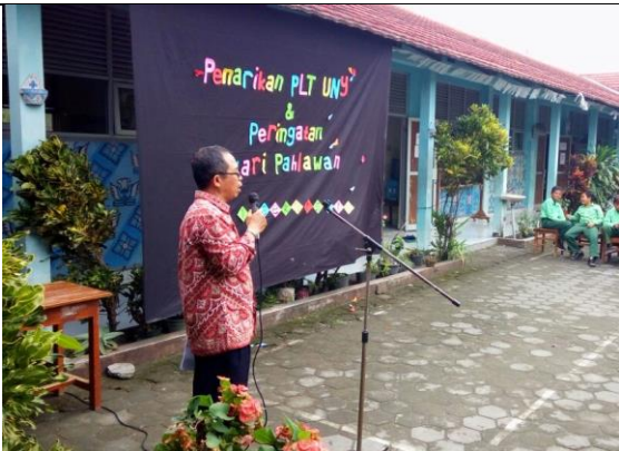
Gambar . Penarikan Mahasiswa PLT oleh DPL