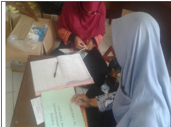
Gambar . Pemberian Label Buku Perpustakaan