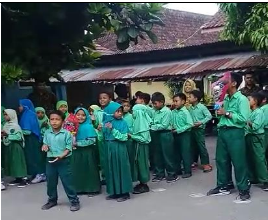
Gambar . Siswa Menyanyikan Lagu “Guruku Tersayang” dalam Rangka Hari Guru Internasional