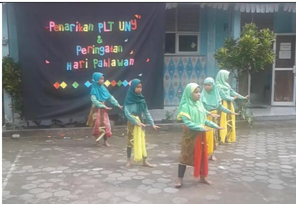
Gambar . Penampilan Tari Rena