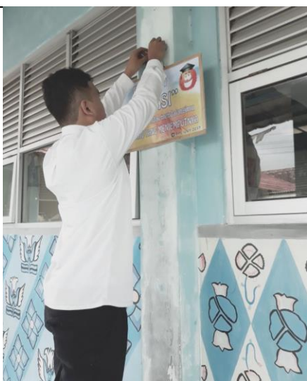
Gambar . Pemasangan Banner Slogan