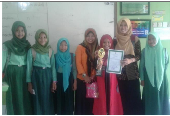
Gambar . Juara 2 Cabang Lomba Pidato