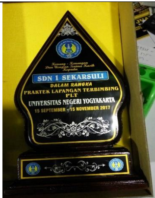
Gambar . Kenang-kenangan dari Mahasiswa PLT