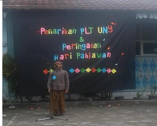
Gambar . Peserta Duta Pahlawan Kelas 1