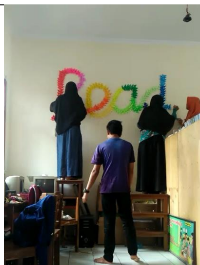
Gambar . Pemasangan Hiasan Kupu-kupu