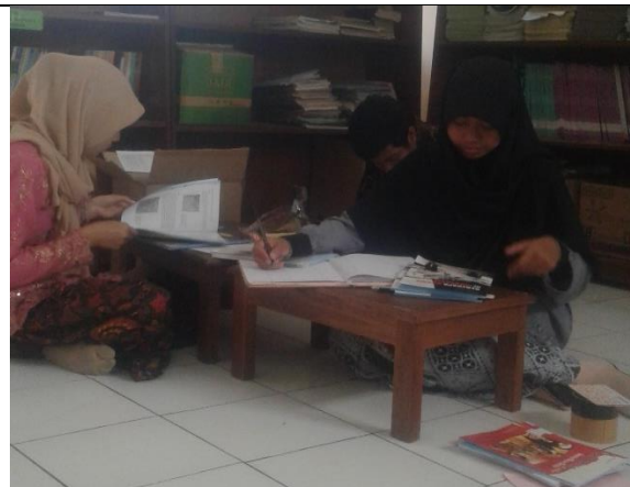
Gambar . Pendataan Buku Perpustakaan