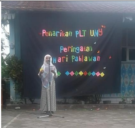
Gambar . Peserta Duta Pahlawan Kelas 5