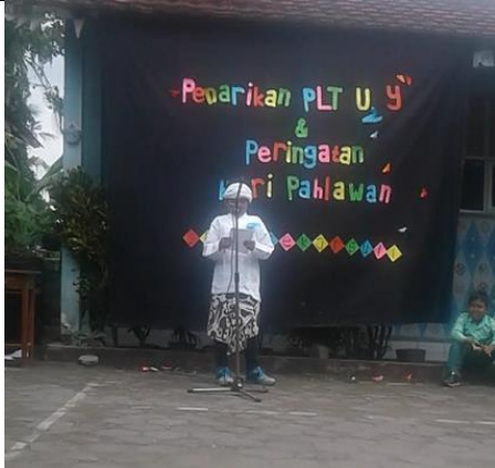
Gambar . Peserta Duta Pahlawan Kelas 3