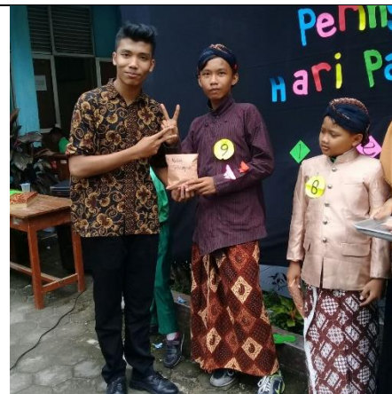
Gambar . Pembagian Hadiah Kelas Terkompak, Terkreatif dan Terunik