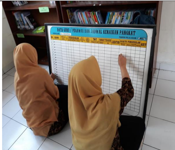
Gambar . Penulisan Ulang Data Guru dan Pegawai