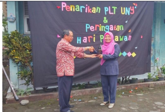
Gambar 6. Penyerahan Kenang-kenangan dan Ucapan Terimakasih