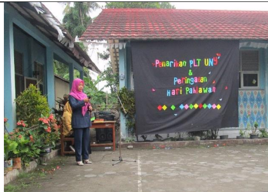
Gambar . Pelepasan Mahasiswa PLT dari Pihak Sekolah