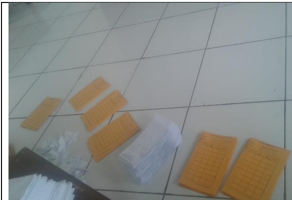
Gambar . Pemotongan Kartu Peminjaman Buku