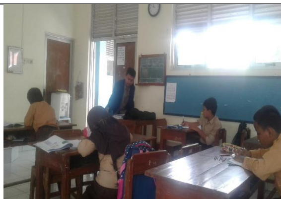
Gambar . Praktik Mengajar Mandiri