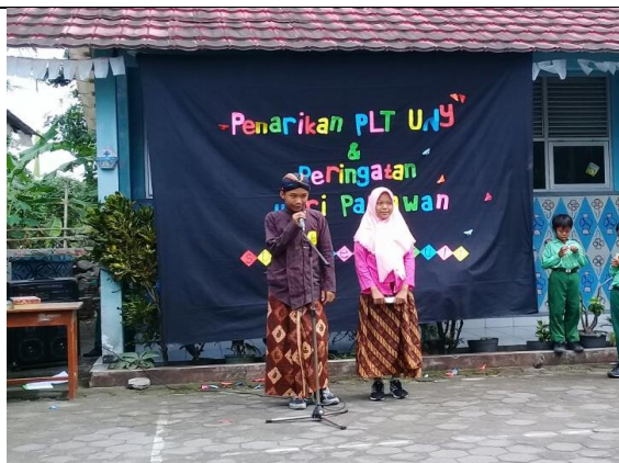
Gambar . Peserta Duta Pahlawan Kelas 6