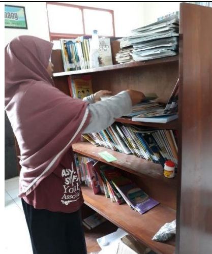
Gambar . Penataan Ulang Buku Perpustakaan