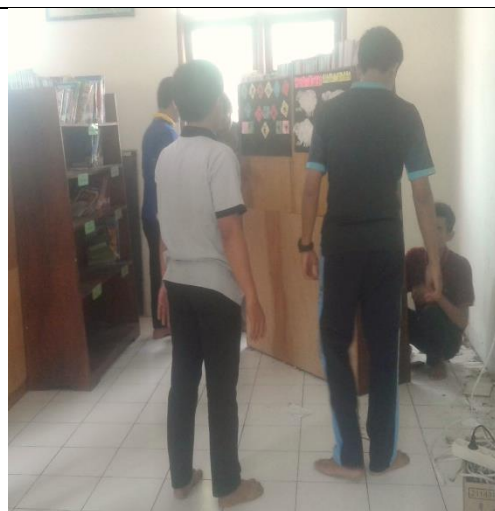
Gambar . Penataan Ulang Perpustakaan