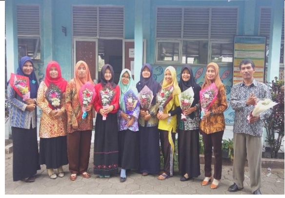
Gambar . Hari Guru Internasional