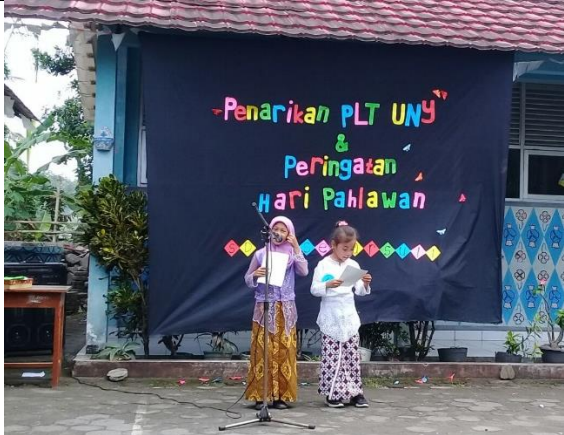
Gambar . Peserta Duta Pahlawan Kelas 2