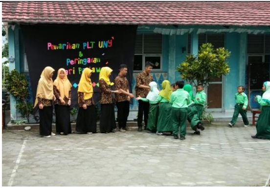
Gambar . Jabat Tangan dengan Siswa