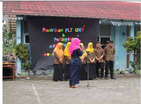
Gambar . Tanggapan dari Koordinator Guru Pendamping PLT