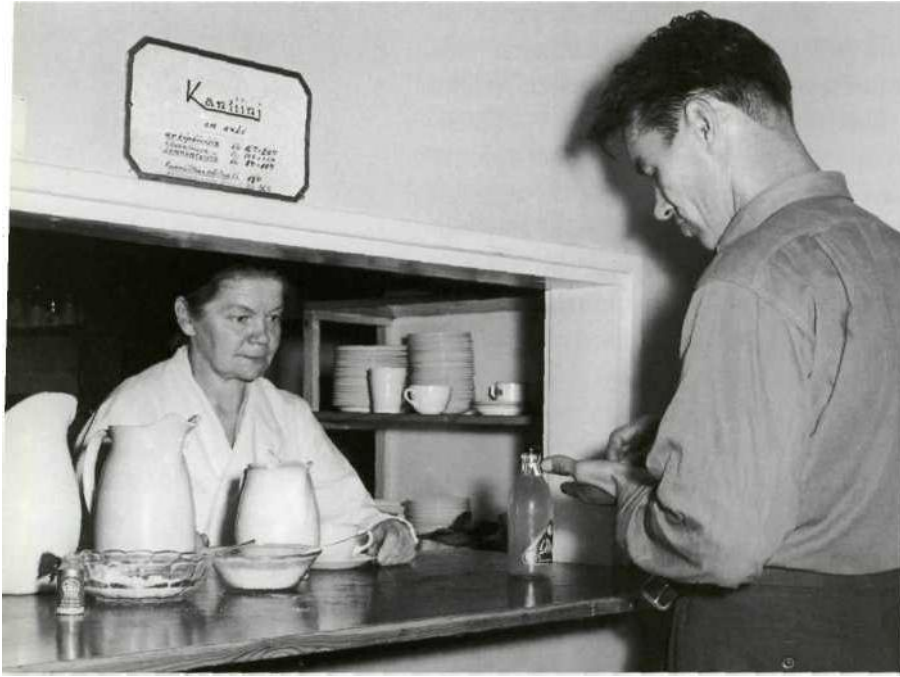
Katulähetyksen kanttiinissa. Laatuksava.