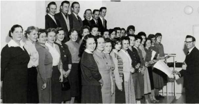
Naiset olivat Vartiokylän kirkkokokouksen kantava voima. Kirkko ja kaupunki -lehden arkisto. Laatuksena.