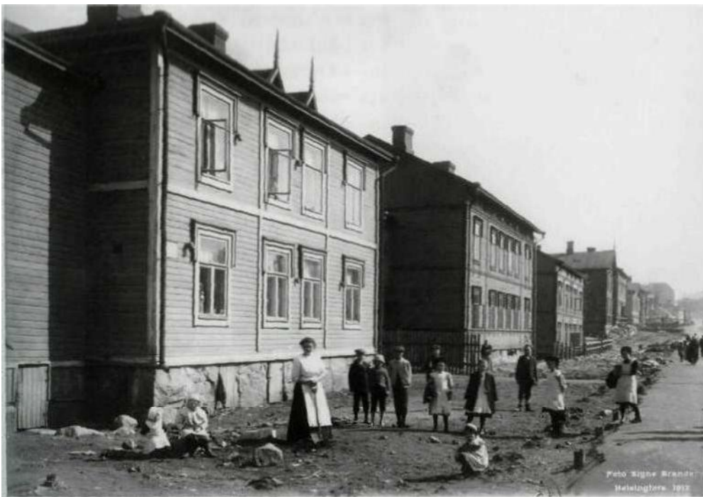
Harjun huvila-alueen eli Kinaporin työväen asutusta Vaasankadulla vuonna 1912.

»huvilayhdyskuntiin» kuten Kulosaaren tai Helsingin esikaupunkialueille, mutta jätti kirjansa vanhaan paikkaan. Vastaavasti seurakuntien alueille muutti paljon sellaista väkeä, joka jätti kirjansa entiselle paik-kakunnalle. Erityisesti Helsingissä, mutta myös koko Suomessa ongelmia aiheutta-nutta tilannetta yritettiin parantaa vuonna 1932 annetulla uudella asetuksella. Se ei poistanut ongelmia kokonaan. Kaikki hel-sinkiläiset eivät olleet kirjoilla omassa seurakunnassaan. Vielä 1960-luvulle tultaessa tilanne oli ongelmallinen. Seurakuntien kanslisteille tilanne aiheutti vaivannäköä ja lisätyötä, ja siksi useissa seurakuntien jakamissa lehtisissä ja vuosikertomuksis-sa helsinkiläisiä muistutettiin henkikir-joitustietojensa huolellisesta hoitamisesta. Tilanne synnytti myös huhupuheita, jotka kävivät ilmi Helsingin seurakuntien Kirkko ja kaupunki -lehden julkaisemasta huo-lestuneen seurakuntalaisen kirjoituksesta. Hän kertoi kuulleensa huhuja siitä, että