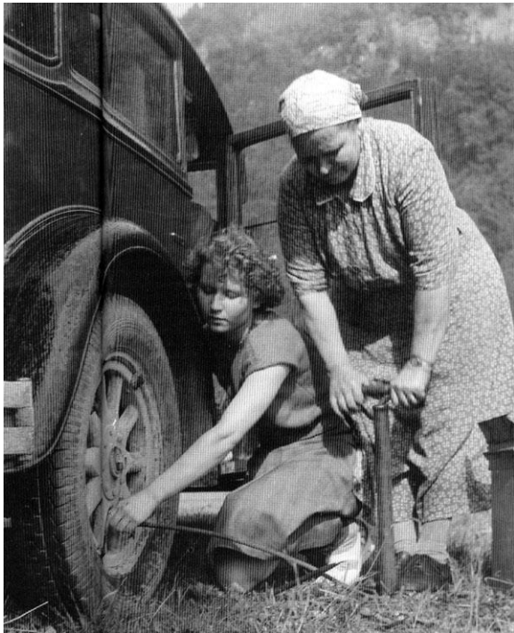
Sodasta selviytynyt Suomi tähyisi lähes käsivoimin kohti parempaa tulevaisuutta. Teollisuuden tuotantokoneisto oli kulunut ja maa kärsi energiapulasta. Moottoriajoneuvoja oli sodan päättyessä noin ja 1940-luvun lopullakin vain noin 65 000, joista henkilöautoja oli 23 000.

Toisaalta Suomen erityisasema saneli myös keinot, joihin Yhdysvaltojen ja muiden länsivaltojen oli turvauduttava, jos Suomi - tietenkin vain yhtenä palasena kansainvälisessä suurvaltapelissä - aiottiin pelastaa lännen leiriin tai, realistisemmin, ainakin estettäisiin Suomen täydellinen kytkös Neuvostoliittoon. Kun avoin poliittinen tuki, puhumattakaan sotilaallisesta, oli poissuljettu Suomen kannalta vaaralliseksi käyvien Moskovan reaktioiden vuoksi, jäljelle jäi talous.