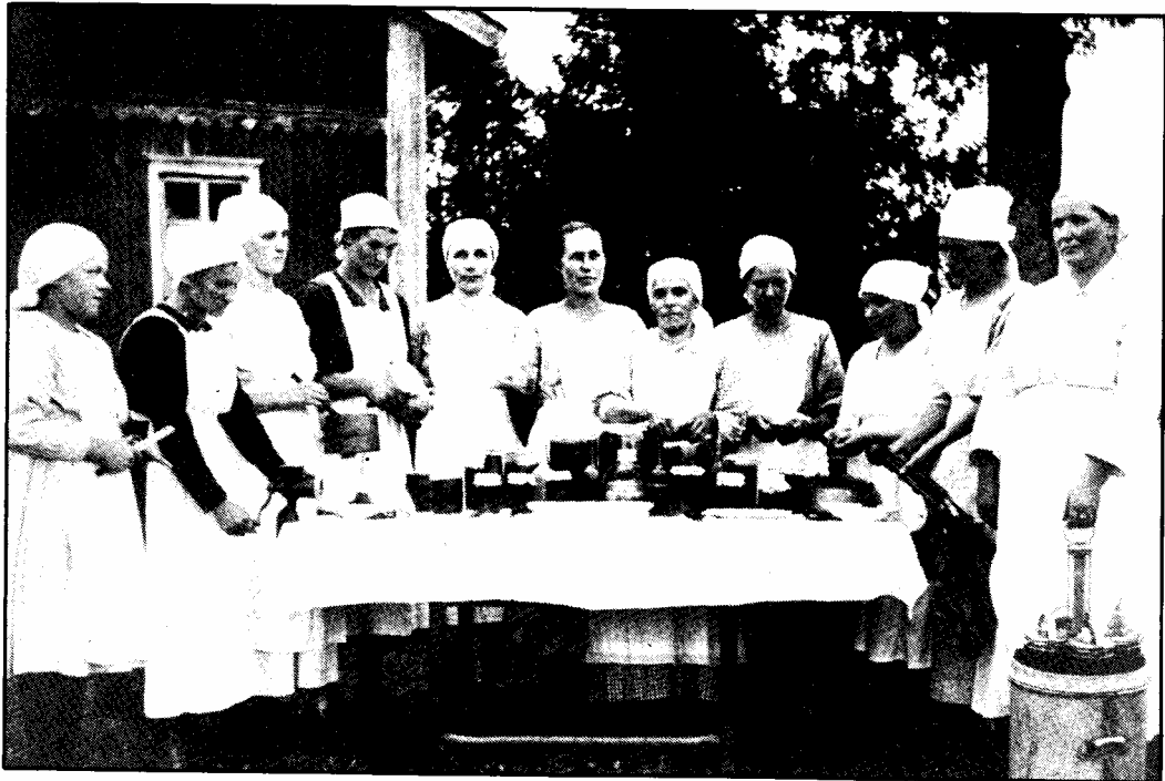
Marttaliiton säilykekurssit Suistamon Jalovaa- rassa 1920-luvulla. — ML.