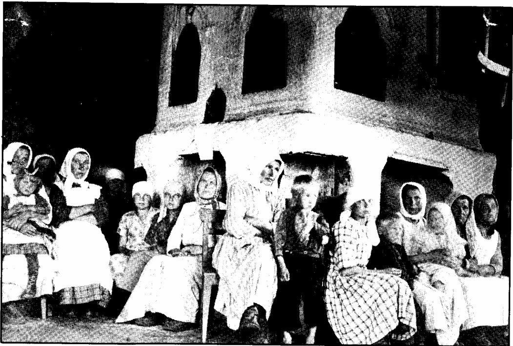
Marttaesitelmää kuunnellaan Sallan Kuolajärven Kurtissa. — ML.