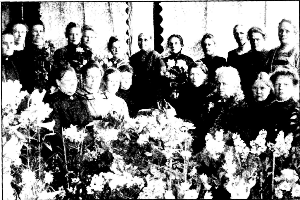
Hyväntekeväisyysyhdistyksissä toimivat puuhakkaat ylä- ja keskiluokan naiset valtasivat vuosisadan vaihteen jälkeen myös raittiusyhdistykset. Kymin hyväntekeväisyysyhdistys 1912.