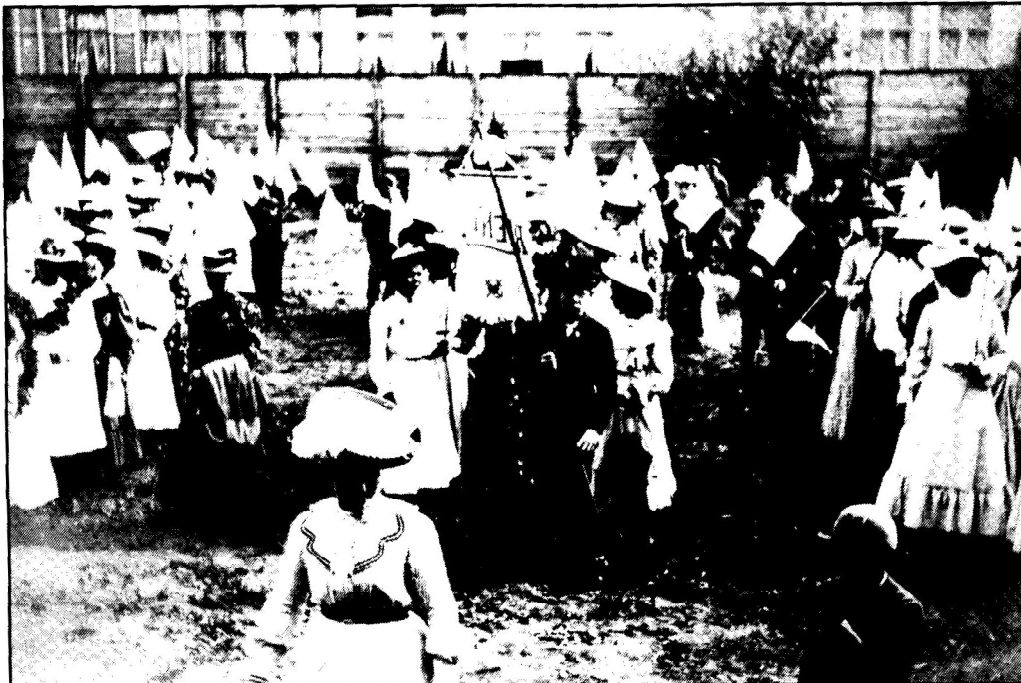
Naisvaltainen raittiusmarssi järjestäytyy raittiusseura Taiston pihalla Tampereella 1890-luvulla. — TKA.