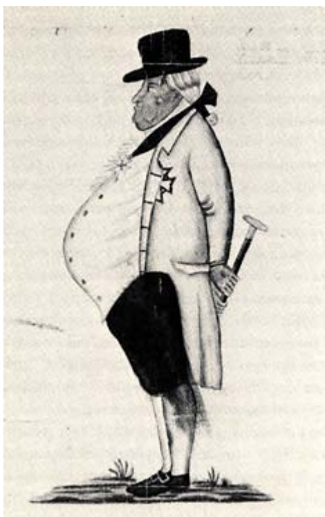
38. Nils von Rosenstein. Osignerad karikatyr. Kungl. biblioteket.

Poeterna borde med löjets hjälp bekämpa laster och dårskaper och filosoferna ersätta kristna villfarelser med ett slags förnuftets moralkatekes, som predikade "ljus, sanning och dygd". Hela Kellgrens patos låg i dessa ord.