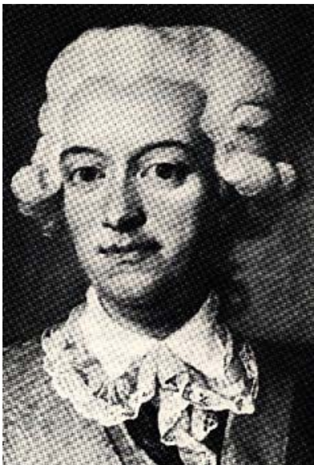
37. Gustav III. Målning av Lorens Pasch d. y. Detalj. Konstakademien

hovet, beundrade Voltaire och diskuterade redan 1760 med den fjortonårige prinsen häpnadsväckande tes, att vetenskapen och konsterna fördärvat människorna. Ett par år senare lästes vid aftonunderhållningen på slottet högt ur Helvétius' farliga De l'esprit. Mer än någon annan gav drottningen själv, Lovisa Ulrika, sin prägel åt den intellektuella atmosfären vid hovet. I det stora bibliotek hon byggde upp på Drottningholm, fanns så gott som all viktigare fransk litteratur alltifrån 1600-talet, med hjälp av Grimms Correspondance littéraire inhämtade hon löpande skvaller och litterära nyheter från Paris. Först och sist var Voltaire hennes idol, närd av hans prästhat och ironier förmedlade hon sin entusiasm till sonen. För den unge Gustav III blev Voltaire den oöverträffade, av honom lärde han sig att genomsåda det ömkliga