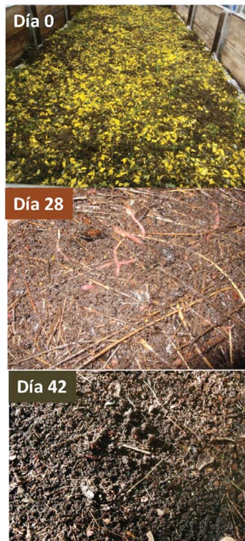
Figura 1.- Reactor de vermicompostaje de retama negra. Las imágenes muestran la evolución de la retama durante el proceso

El procesamiento de la retama negra tuvo lugar en un vermirreactor con una superficie de 6 m 2 (1,5 x 4 m) que contenía una cama de vermicompost maduro de 12 cm de espesor con una población total de lombrices de 280 ± 9 individuos m -2 , incluyendo 111 ± 10 lombrices maduras m -2 , 169 ± 7 juveniles m -2 y 120 ± 3 capullos m -2 , con una biomasa de 79,1 ± 5,2 g m -2 (Figura 1). Encima de la cama se dispuso una red plástica de 5 mm de luz de malla, que permite el paso de las lombrices a la capa de retama extendida homogéneamente sobre ella sin afectar de este modo al procesado del residuo y para facilitar la toma de muestras durante el proceso de vermicompostaje. La capa de retama, de 12 cm de espesor, se cubrió con una malla de sombra que reduce las pérdidas de agua, manteniéndola con una humedad óptima para las lombrices.