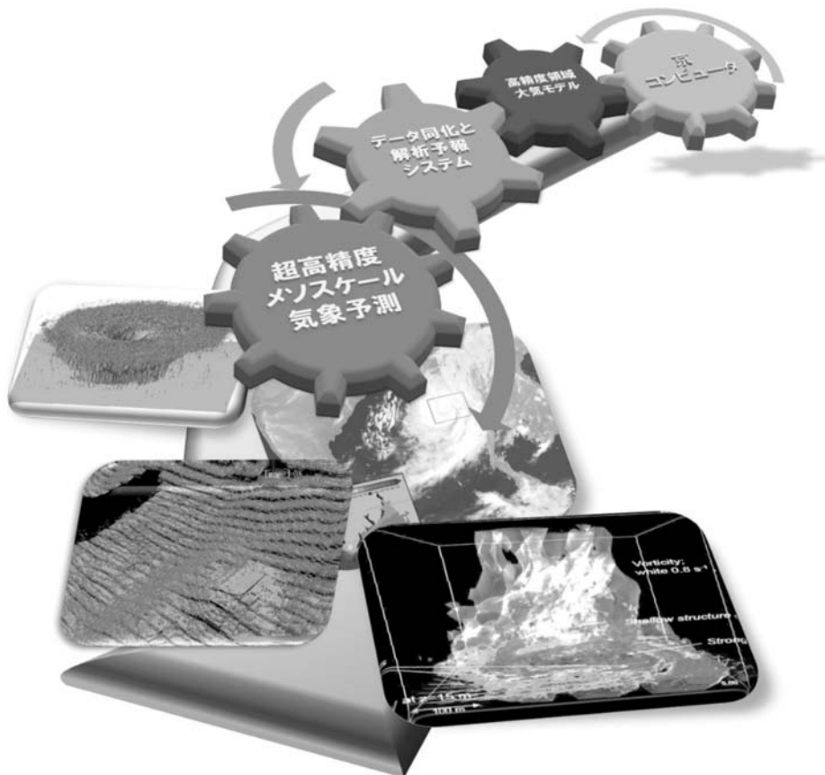
第1図 第6回超高精度メソスケール気象予測研究会のチラシに用いられた図。