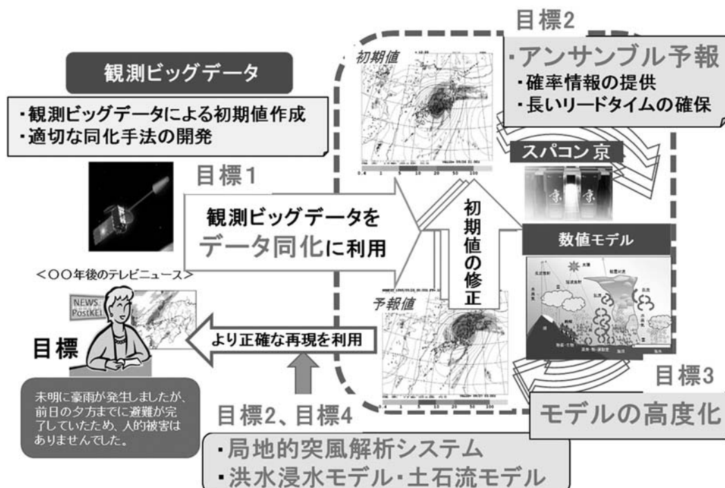
第4図 ポスト「京」重点課題4サブ課題A「革新的な数値天気予報と被害レベル推定に基づく高度な気象防災」の概念図。ポスト「京」重点課題4、ホームページ ( http://www.jamstec.go.jp/pi4/index.html )より。

HPCI 戦略プログラムでのメソスケール気象予測課題の研究進捗を確認し成果を発信する場として、第1表に示した研究会を開催してきた。ここまで6回の研