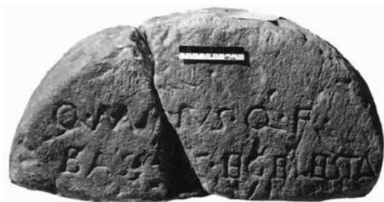
LÁM. III. Inscripción de Quintus Manilus Bassus, el egelestano (CIL, III, I, 66).

5. El cipo funerario de Quintus Manilus Bassus , el egelestano (Lám. III) (MANGAS y OREJAS, 1999), no es incluido por la mayoría de los investigadores dentro de la epigrafía relacionada con la minería y metalurgia en el Alto Guadalquivir (PASTOR et al. , 1981; LÓPEZ PAYER et al. , 1983). Nosotros sí creemos interesante recogerla, ya que con Egelasta se relacionan unas importantes minas de sal que algunos autores localizan en nuestra área de estudio (PEÑA et al. , 1995). Este cipo fue descubierto en torno a 1866, según Hübner, cerca de la mina de Men Baca , entre Linares, Cástulo y Vilches (CIL. II 5.091); por el contrario, Domergue lo ubica en la mina de Palazuelos (DOMERGUE, 1987).