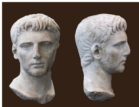
Fig. 10. Octavio tipo B, Marcelo o Cayo tipo V. Musée de l'Arles et de la Provence Antique. (Arles, Francia). N.º de inventario CRY 51.I.22.