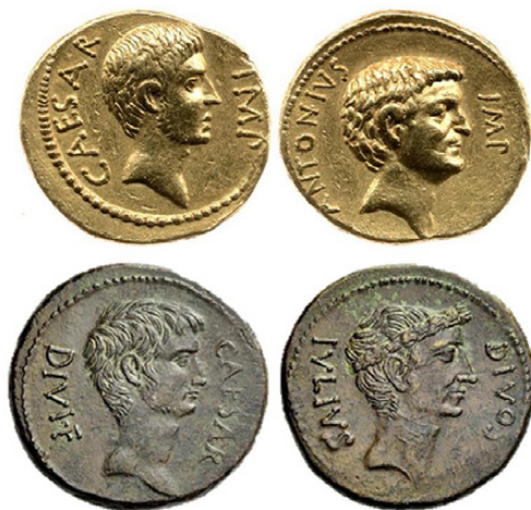
Fig. 3. A) RRC n.º 529/1 Centro/Sur Italia (Octavio). 40-39 a.C.

Anv. Busto de Octavio con ligera barba a derecha. CAESAR · IMP