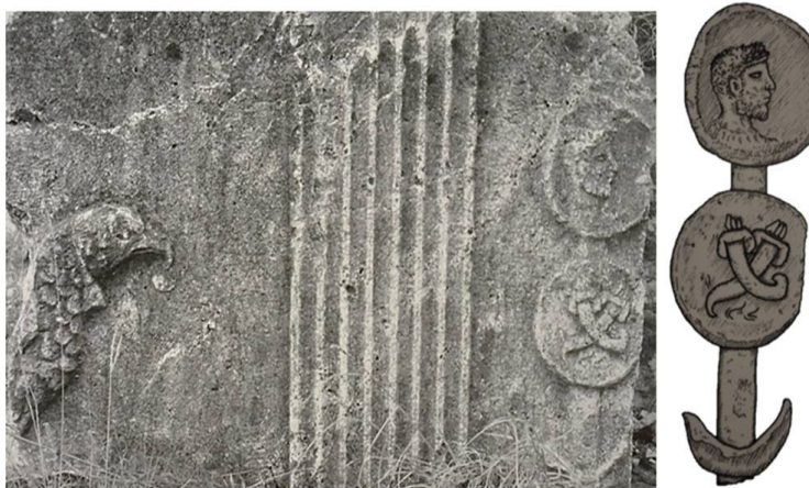
Fig. 5. Imago de Octavio. Relieve del Anfiteatro de Capua Vetere (Campania, Italia). (Töpfer, 2011: Tafel 79 SD. 3 y Kavanagh, 2013:47).

los estandartes tendría un valor propagandístico evidente. Siendo un ejemplo del creciente personalismo de los generales políticos de finales de la República y de su afán por hacerse presentes en el medio militar. Los signum poseían un enorme valor para el ejército no sólo en el ámbito de lo táctico sino también en el emocional. El carácter sagrado del estandarte no se documenta en las fuentes clásicas pero se sabe que se trataba de un objeto sagrado de culto, que contaba con un espacio propio dentro del campamento para consignarlos. En esta línea para Kavanagh los líderes se habrían beneficiado del valor sagrado que transmitía el estandarte: el estandarte es sagrado, Octaviano figura en él, Octavio es divino.