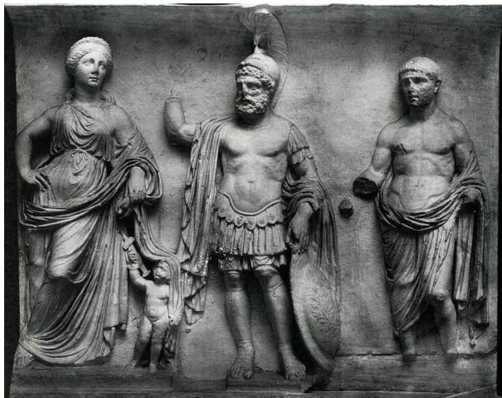
Fig. 7. Bajorrelieve de Alger. Época julio-claudia. Museo Arqueológico de Argel (Argelia). (Fishwick 2003:77).

En dicha escultura el dios Marte es representado con barba cerrada, como honorable figura paterna (ZANKER 1992, 236). No obstante lo más significativo es la iconografía que presenta su coraza. Según Zanker aparece en ella una gran corona cívica que lo relaciona con Augusto en calidad de salvador, mientras que los grifos hacen referencia a las armas de Marte, además de ser entendidos como una personificación de la venganza divina y también como animales de Apolo.