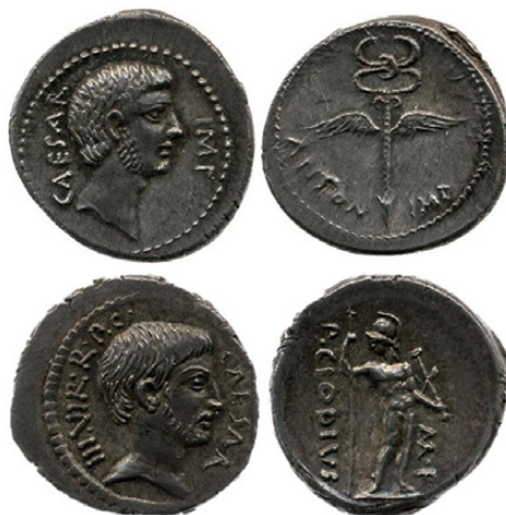
Fig. 4. A) RRC n.º 529/2 Ceca móvil (Octavio). 40-39 a.C.

Rev. Busto de César laureado a derecha. DIVOS · IVLIVS (British Museum Roman Republican Coins). http://www.britishmuseum.org/research/publications/online_research_catalogues.aspx