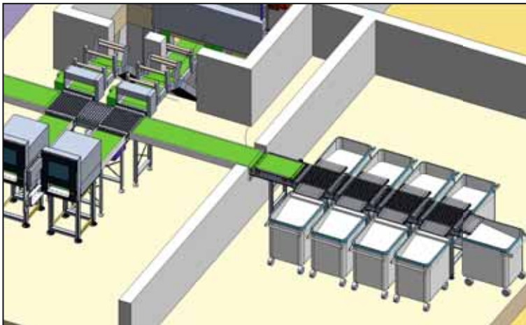
Abb. 1: Buchrückgabeanlage mit Federwagen und Förderbändern 18

Die Lager- und Buchförderanlage für das Magazin der ULB Düsseldorf würde folgende Komponenten benötigen: Eine in die Förderanlage integrierte Buchrückgabeanlage mit Sortierfunktion, die die zurückgegebenen Medien nach Standorten und weiteren definierten Kriterien wie z. B. vorgemerkte Medien sortiert. Dabei würde eine neue Generation von Anlagen zum Einsatz kommen, die die zurückgegebenen Medien sowohl in Federwagen für Bestände, die manuell verfahren werden sollen, als auch in Transportbehälter für den automatischen Transport der Medien ins Magazin oder in sogenannte Zwischenpuffer einsortieren können. Der Sorter der Buchrückgabeanlage kann auf diese Weise Freihandbestände, z. B. Lehrbücher, in die Federwagen einsortieren, gleichzeitig aber auch Magazinbestände den Transportbehältern zuordnen und über die Förderanlage direkt in das Büchermagazin transferieren. Die Federwagen würden vom Bibliothekspersonal in die Freihandbereiche zur manuellen Einsortierung in die Freihandregale verfahren. Bestände, die automatisch zurück ins Magazin befördert werden, würden im Magazin an Sortierstationen von Bibliotheksmitarbeitern manuell aus den Transportbehältern genommen, auf ihren Zustand und ihre Vollständigkeit geprüft und anschließend manuell in die Lagerbehälter nach Signaturen geordnet eingestellt. Die Lagerbehälter werden automatisch von der Förderanlage zurück in das Speicherregal gefahren. Dort stellt ein Regalbediengerät den Behälter an seinen Platz zurück.