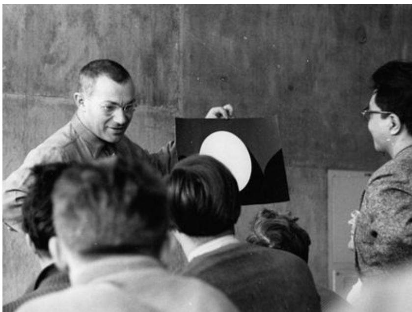
Figura 6. Max Bill impartiendo el curso básico en el edificio de la HfG, 1956.

Peterhans, a petición de Mies, creó un nuevo curso llamado Visual Training con el objetivo de enseñar a mirar, desarrollar el sentido crítico en la toma de decisiones y aprehender las cuestiones básicas de la forma en relación a la arquitectura: la proporción, el ritmo y el equilibrio. 7