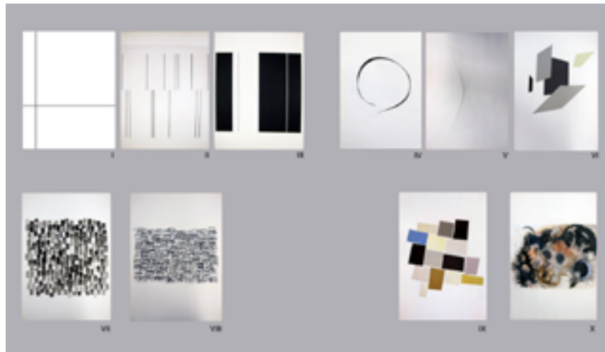
Figura 7. Atlas Visual Training, panel I. Ejercicios realizados por los alumnos de la HfG en 1953 según la distribución cronológica del seminario en cuatro semestres en el Programa de Arquitectura del IIT. Primer semestre ejercicios I a III, segundo semestre ejercicios IV a VI, tercer semestre ejercicios VII y VIII, cuarto semestre ejercicios IX y X.

La solución no es única, sino que depende de la investigación personal de cada alumno. Por ejemplo, el enunciado del ejercicio n° 4 describe el trazado de una curva sobre el plano que divida el espacio, permitiendo que este fluya o una curva-membrana que trabaje en el espacio atándolo y condensándolo. En los ejercicios de los alumnos de la Escuela de Ulm se pone de manifiesto que las respuestas al enunciado poseen analogías estructurales pero el tratamiento de la forma es el que diferencia el carácter final de la solución: la curva, que se cierra sobre sí misma, se hace permeable al espacio en que se inserta bien fragmentándose o bien variando su grosor.