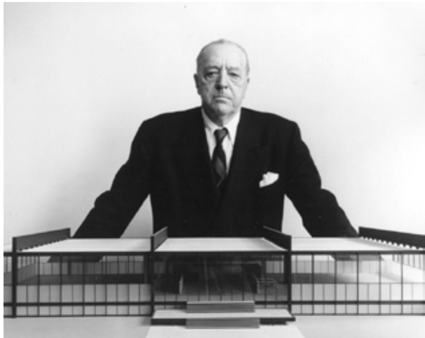
Figura 5. Mies van der Rohe ante una maqueta del Crown Hall.

Mies Van der Rohe, que había coincidido con Peterhans en la última etapa de la Bauhaus 5 , se hace cargo de las enseñanzas de Arquitectura en el Armour Institute de Chicago 6 , que posteriormente se transformará en el IIT. Recién llegado a Norteamérica no domina el inglés, y pide a Peterhans su colaboración para traducir sus pensamientos y escribir juntos el plan de estudios. Esta primera recopilación de ideas se titula “Programa para la educación en Arquitectura”.