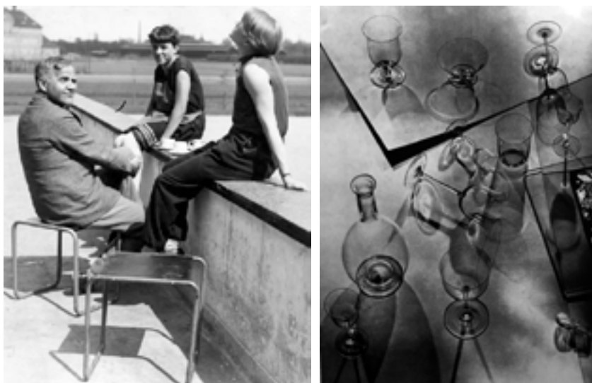
Figura 3. Walter Peterhans. Sin título (Copas III) 1929