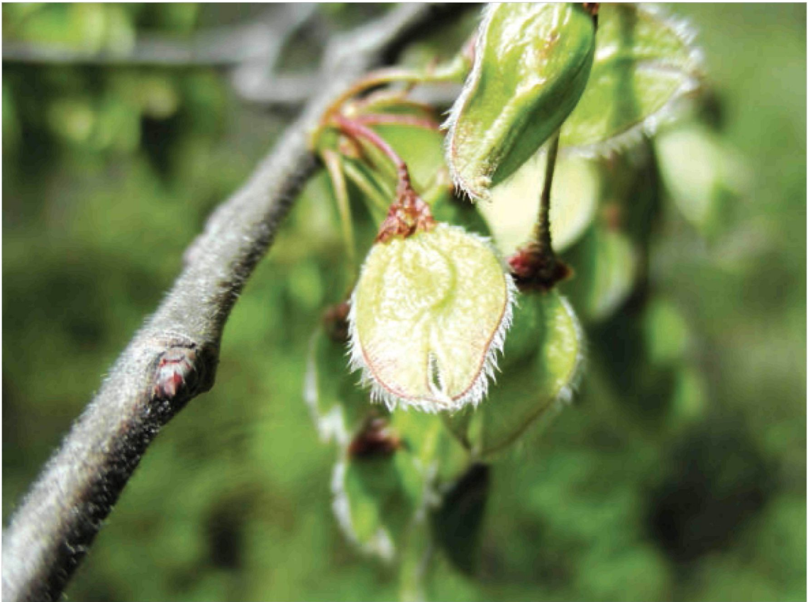
Figura 1. Sámaras de Ulmus laevis , pedunculadas y con margen ciliado, como rasgo diferenciador respecto a Ulmus minor . Población de Valdelatas (Madrid).

do que su variabilidad genética en nuestro país es superior a la de las poblaciones europeas, siendo la Península Ibérica uno de sus refugios glaciares (Fuentes-Utrilla et al. , 2014).