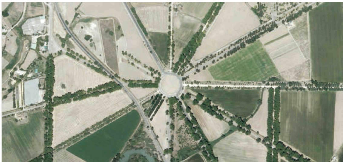
Figura 3. Rotonda de las Doce Calles, Paisaje Cultural de Aranjuez (Madrid). Foto aérea del 2014.

Cabe destacar que gran parte de las plantaciones divulgativas a realizar en Aranjuez están dentro del Paisaje Cultural, inscrito en la Lista de Patrimonio Mundial de la UNESCO el 14 de diciembre de 2001 (Fig. 3). El área que lo configura incluye elementos naturales y atributos históricos, los cauces de los ríos Tajo y Jarama y sus sotos, gran parte de los sistemas de riego y estructuras hidráulicas tradicionales, la totalidad de las huertas históricas, los jardines, el trazado de calles y plazas arboladas, el Palacio Real y el casco urbano de Aranjuez del siglo XVIII. En esta configuración tienen especial importancia los caminos históricos que son objeto de restauración en el proyecto, cuyo fin es ejemplificar y difundir la recuperación del uso del olmo común como árbol ornamental fuertemente ligado a la cultura española. Se da la cir-