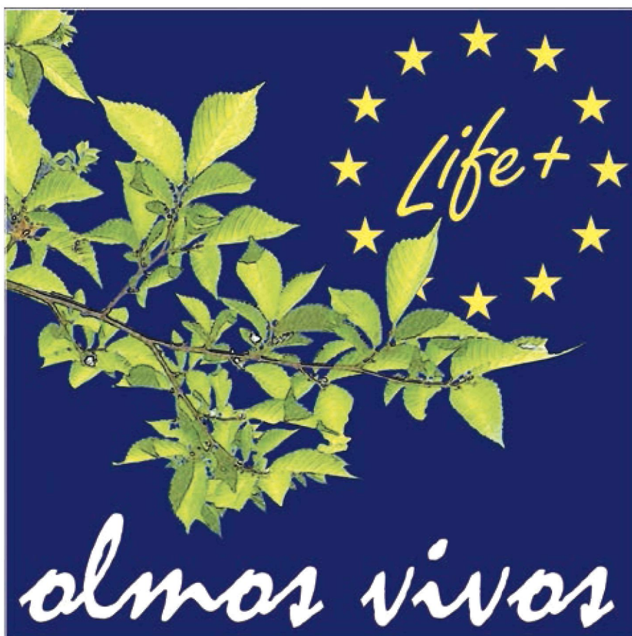
Figura 2. Logo oficial del proyecto LIFE Olmos Vivos (LIFE13 BIO/ES/000556).

El proyecto se encuentra englobado en el proyecto LIFE+ “Olmos Vivos” (LIFE13 BIO/ES/000556), que además de las plantaciones aquí descritas y de la producción de la planta necesaria para ello, conlleva una serie de acciones paralelas enfocadas a la divulgación de sus acciones y resultados, y a la integración de los olmos en las políticas forestales y en la legislación de protección de la naturaleza ( Fig. 2 ).