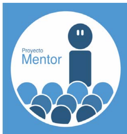
Figura 3 Logo del Proyecto Mentor

Dentro de este proceso de difusión, se considera fundamental que los alumnos de la Escuela identifiquen rápidamente los carteles del PM, a través de un logo propio. En el caso de la ETSIDI-UPM, el logo utilizado e identificativo del PM fue el ganador de un concurso abierto a todos los alumnos de la Escuela, que se presenta en la figura 3.