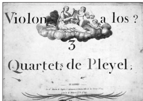
Figura 6. Las Urosas.