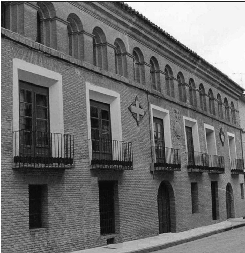
Figura 1. Casa de Navascués en Cintruénigo, Navarra.

La casa donde vivió y murió don Tomás de Navascués 5 , donde se guarda su biblioteca de música y donde se ejecutaban las piezas que la componen, en aquel tiempo se señalaba con el número 6 de la Carrera de Tarazona en la villa de Cintruénigo (fig. 1).