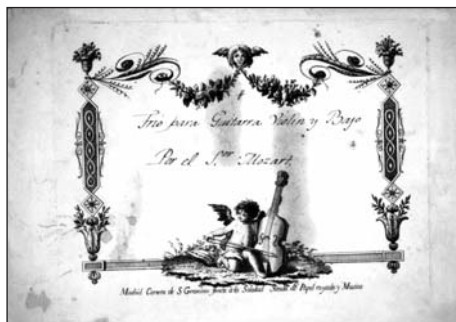
Figura 5. Mintegui.

Contemporáneo al material manuscrito, se conservan obras impresas de editores extranjeros. No debemos olvidar que la imprenta musical en España no adquirió una producción significativa hasta muy avanzado el siglo XVIII y que además, no llegó a consolidarse hasta el siglo XIX. Sin embargo, como veíamos, la demanda generada por la corte y la incipiente burguesía dio pie a una importante actividad de importación de partituras extranjeras 41 . En este sentido, se conservan además, ejemplos de música impresa de editores extranjeros con la portada de almacenistas madrileños como el «Almacén de Música de Churrucilla y compañía, calle de Relatores, número 6, cuarto baxo», que podríamos datar a finales del XVIII además de una edición Artaria (n.º de plancha 239) y una edición Imbault (n.º de plancha 704) cuyas portadas son manuscritas, que podríamos datar hacia 1789.