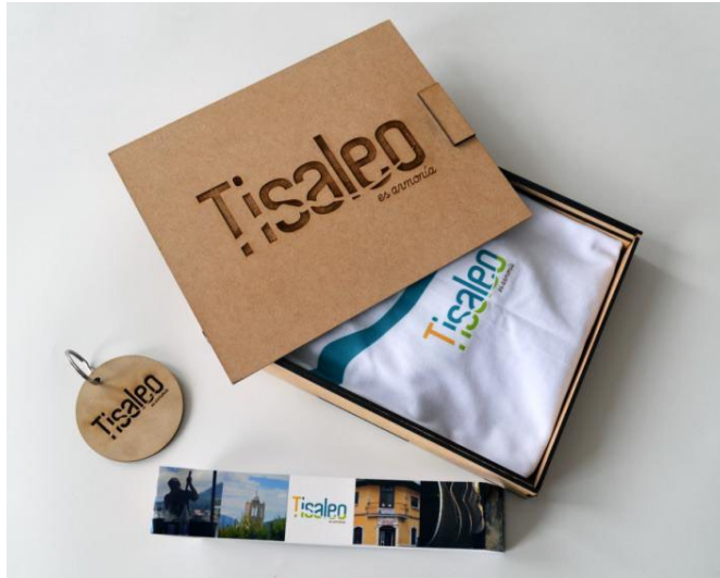
Figura 9. Kit de regalo consistente en camiseta y llavero incluidos en una caja de madera con la aplicación del identificador del Equipo 2. La línea del Carihuairazo adquiere relieve sobre las letras, grabadas con láser en la madera.

La propuesta del Equipo 3 (Figura 5) es un ejercicio de creación y modificación de una fuente tipográfica. El perfil del volcán es menos visible, y se presenta como un trazo sutil que surge de la letra “i” y se va desvaneciendo hacia la derecha, donde adquiere fuerza el mango de la guitarra, un producto artesano típico de Tisaleo, que se enlaza con el rabo de la letra O. La cromática utilizada se basó en los colores de la bandera de Tisaleo, en un ejercicio de degradado del color cian a verde y de verde a rojo (Figura 10).