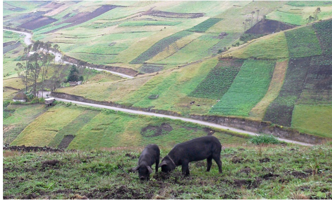
Figura 12. El valor del paisaje trabajado por la mano del hombre, campos de cultivo en Tisaleo.

Los argumentos presentados por el grupo de investigación resaltan la importancia de orientar el desarrollo del ecoturismo atendiendo a conocer el perfil de viajero, considerando prioritario que una marca destino incorpore algunos elementos que contribuyan a identificar algún rasgo con poder de imagen. Así como la imagen de “Juan Valdez” para el café colombiano, en el caso de la sierra andina no se ha encontrado información que permita que un municipio como Tisaleo sea ubicado turística o geográficamente. Ante ello, se considera necesario el tener presente en el diseño de marca dicha debilidad, ante la cual puede contrarrestar en positivo la imagen de cordillera andina y su paisaje cultural e histórico como el relatado caso de la resistencia inca.