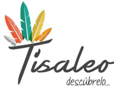
Figura 6. Imagotipo corporativo Grupo 4.