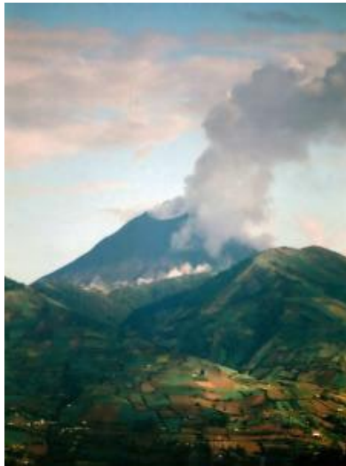
Figura 1. Vista del volcán Tungurahua desde Tisaleo.