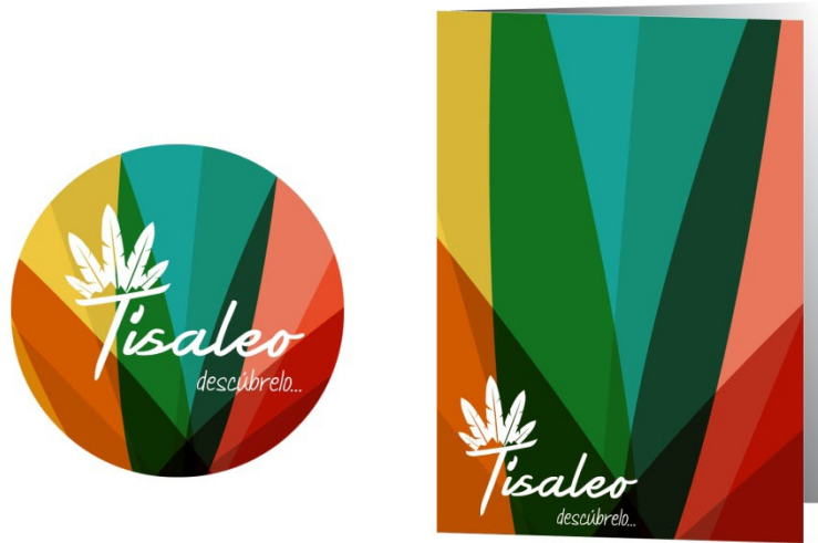
Figura 11. Aplicación del imagotipo en negativo blanco sobre combinación cromática en pins (izquierda) y en carpetas corporativas (derecha).

Con respecto a la tipografía primaria, los equipos 1, 3 y 4 utilizaron una caligráfica con serifa que permite establecer lazos con el carácter tradicional y artesano de Tisaleo. Por su parte, el Equipo 2 se distancia de este lenguaje y apuesta por un tipo de letra palo seco, que contrasta con la manuscrita empleada en el eslogan.