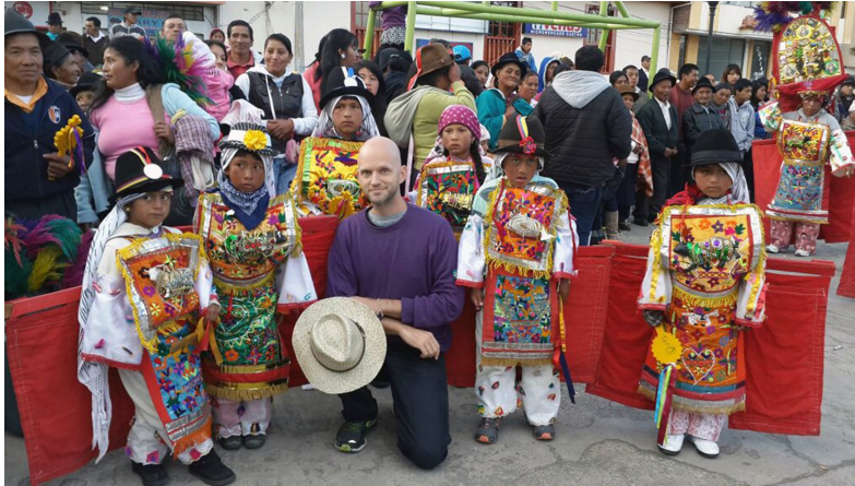
Figura 2. Turista extranjero durante las fiestas de las Octavas del Corpus Christi, 11 de junio de 2015.

El Plan Nacional del Buen Vivir o “Sumak Kawsay” en idioma quechua, desarrollado por la Secretaría Nacional de Planificación y Desarrollo de la República del Ecuador (Acosta, 2010) presta especial atención al respeto de la diversidad cultural del país y la convivencia armónica con el medioambiente. Se trata de un programa de desarrollo socioeconómico para el país que contempla, entre otras muchas estrategias, el impulso del ecoturismo basado en el rico legado natural, sociocultural y patrimonial del Ecuador (SENPLADES, s.f.).