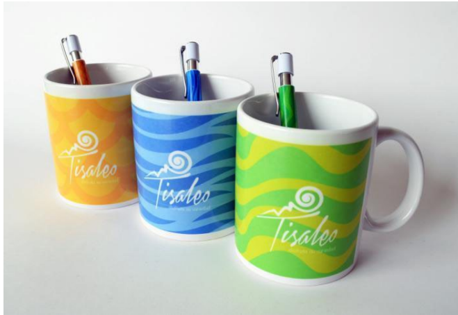
Figura 8. Aplicación en tazas de desayuno y bolígrafos de los colores y texturas presentes en el isotipo del identificador del Equipo 1. En estos ejemplos, el imagotipo aparece en blanco.