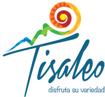
Figura 3. Imagotipo corporativo Grupo 1.

Se presenta, en primer lugar, el trabajo realizado por los cuatro grupos de estudiantes de Diseño Gráfico Publicitario de la Universidad Técnica de Ambato.