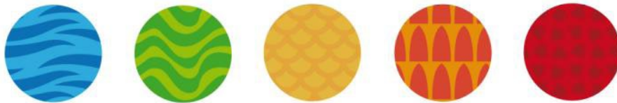
Figura 7. Colores y texturas presentes en el isotipo del identificador del Equipo 1.

El paisaje propio de Tisaleo ha sido un factor determinante para los estudiantes. Así, las cuatro propuestas de imagotipo integran una síntesis del característico perfil descabezado del volcán Carihuairazo 1 , situado a solo 6,5 kilómetros de Tisaleo, desde donde es perfectamente visible en días claros y despejados. En el caso del isotipo del Equipo 1 (Figura 3), la línea que define el perfil del Carihuairazo se dibuja utilizando como base la parte superior de la T de Tisaleo. A continuación, esta línea se encierra sobre sí misma, a modo de espiral, como símbolo de unión y permanencia en el tiempo del cantón, a la vez que, mediante la utilización de una gama de colores cálida, juega con el concepto de la representación del sol en el mismo paisaje natural. Este isotipo presenta una variación de colores y texturas que se han inspirado en elementos propios de la naturaleza y la cultura del cantón: los lagos y nevados se representan con el color azul, los pastos y cultivos con el verde, la arquitectura patrimonial con el amarillo, el arraigo de la tradición con el naranja y la producción de objetos de artesanía con el rojo (Figura 7). Esas mismas texturas se utilizan, además de en el isotipo, en otras piezas gráficas y material P.O.P. (Figura 8).