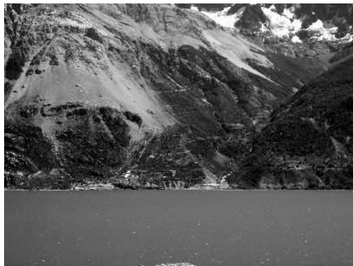
Fig.1 Puerto Cristal en el contexto del Lago Carrera