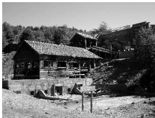
Fig. 4 Mina La Escondida