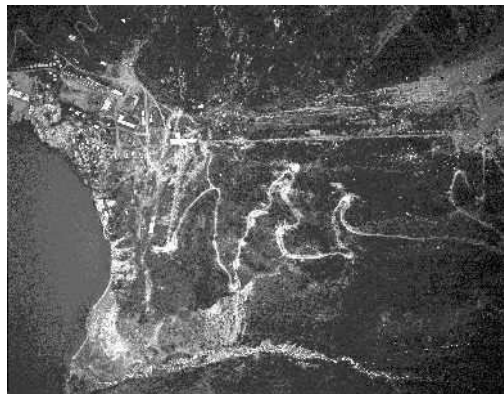
Fig.2 Puerto Cristal