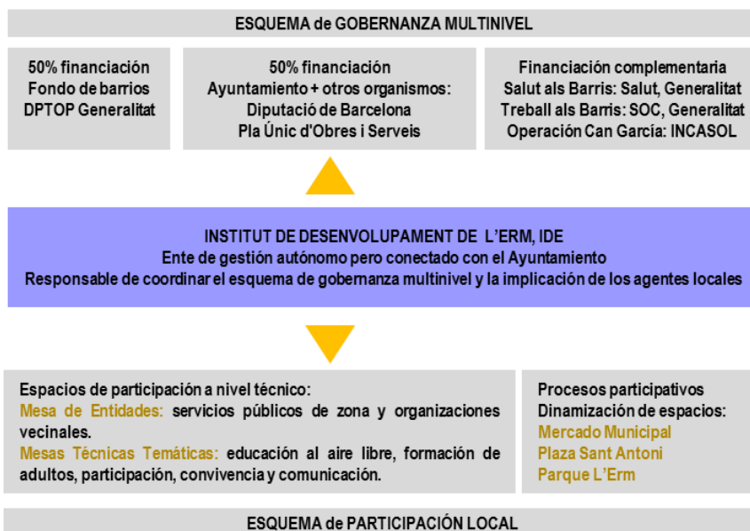
Figura 2: Esquema cooperativo y participativo. Elaboración propia a partir de información del IDE.

áreas y niveles administrativos, dentro de una estrategia común cuya financiación corre a cargo de organismos públicos regionales y municipales. También se encarga de crear espacios de participación técnica y de promover procesos participativos, para implicar a entidades y vecinos clave, con el apoyo de facilitadores externos.