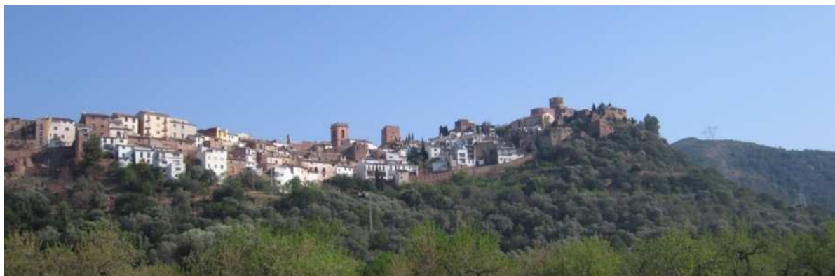
Figura 2: Conjunto urbano histórico de Villafamés (Castellón)

Otro conjunto urbano como el de Patones (Madrid) presenta un aspecto muy distinto tras la restauración de sus fachadas eliminando los revocos tradicionales. En la Figura 3 se muestra este pueblo, apreciándose claramente una imagen de caserío con elementos revocados de color claro y cubiertas de teja. La eliminación del acabado exterior daría lugar a un aspecto muy diferente, fácilmente imaginable a partir de la Figura 4.