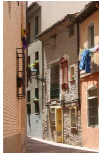
Figura 19: Fachada desollada de ladrillo en Zaragoza

El comportamiento de los muros desollados de ladrillo es similar al de los de piedra. La Figura 198 y la Figura 19 corresponden a viviendas restauradas en Zaragoza, en las que se ha eliminado el revoco exterior, dejando a la vista el muro de ladrillo. Este tipo de aparejos estaban realizados con ladrillos hechos a mano y cocidos en hornos tradicionales, por lo que no tiene un comportamiento óptimo en condiciones externas, por su elevada porosidad y, en la mayor parte