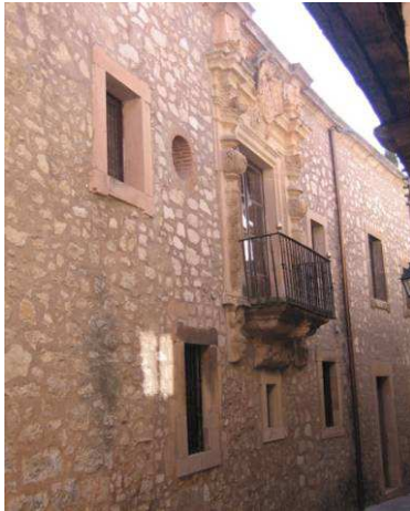
Figura 15: Fachada en Sepúlveda (Segovia).

ante la deformación de la composición formal, se crean falsas juntas sobre la parte rehundida de las piedras de jambas y dinteles para asemejarlas al resto del muro, lo que, evidentemente, no se consigue, empeorando aún más el aspecto del conjunto.