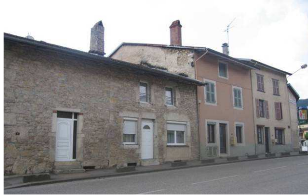
Figura 5: Viviendas populares de los Alpes Franceses cerca de la frontera Suiza.

aparecen dos áreas de fachada, una construida en origen para que la piedra quedara vista y otra parte transformada eliminando el mortero tradicional sobre soporte de piedra no construida para ser vista. A veces, incluso, las fachadas de piedra vista se solían revestir con revocos, imitando la propia piedra, con objeto de preservar su conservación.