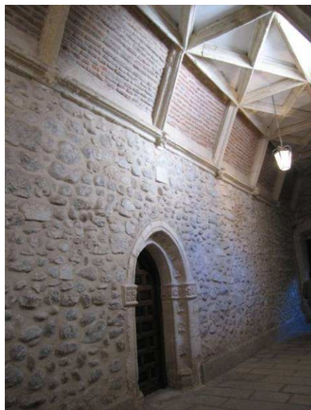
Figura 1: Interior del Monasterio de El Paular (Madrid).

Como ejemplo y a escala próxima, aunque se trata de un caso de interior, esta desfiguración espacial y de texturas se aprecia muy claramente en el corredor del Monasterio del Paular (Figura 1); la aparición y muestra de los diversos materiales del soporte en distintos planos de los paramentos antes cubiertos, piedra y ladrillo, que además de mostrar aparejos pobres (ya que no eran materiales para ser vistos, sino con un acabado igual que el plano horizontal superior) ahora muestran la construcción y texturas derivadas de la facilidad de la puesta en obra (por peso, tamaño y forma) pero ocultan y rompen la unidad del espacio original unificado, alto y longitudinal en el que sólo resaltaban las nervaduras y embocaduras de piedra labrada.