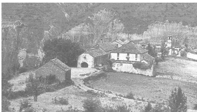
Figura 28: Conjunto de Susín en el pirineo aragonés a principios del siglo XX (Huesca)

Se pueden encontrar interesantes ejemplos en el Pirineo aragonés como, por ejemplo en Susín (Huesca) (Figura 28 y Figura 29). Se trata de un conjunto rural en un clima frío de alta montaña, construido con muros de piedra de la zona, recubiertos por un revoco de mortero de barro y cal que protege de las inclemencias.