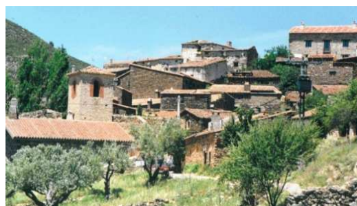
Figura 4: Caserío restaurado en Patones (Madrid)

El problema del “desuello” se extiende como un mal entendimiento de los edificios históricos, sin que se salve prácticamente ningún territorio, tanto a nivel de la edificación popular como en el de los edificios monumentales, en gran parte del mundo. En la Figura 5 puede apreciarse la diferencia entre el aspecto original y el aspecto descarnado, con un muro de piedra desigual desbastada y de relleno, y huecos enmarcados por grandes piedras de un aspecto ciclópeo o primitivo en los Alpes.