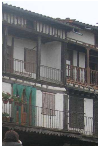
Figura 21: Entramados tradicionales en La Alberca (Salamanca).