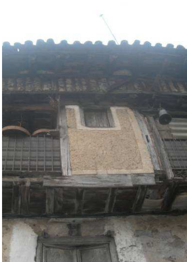
Figura 20: Entramados tradicionales en La Alberca (Salamanca).

En origen, los muros base entramados se cubrían con revocos para evitar no sólo la fotodegradación de la madera sino también los movimientos derivados de los cambios de humedad que se producen al quedar a la intemperie, especialmente en climas secos. De hecho, para proteger aún más de la pudrición los apoyos y las cabezas de los elementos horizontales estructurales, se colocaba por el exterior sobre ellos un tablón que impedía que el agua penetrase en la dirección de las fibras de los mismos, y que era fácilmente sustituible (Figura 20, Figura 21 y Figura 22).