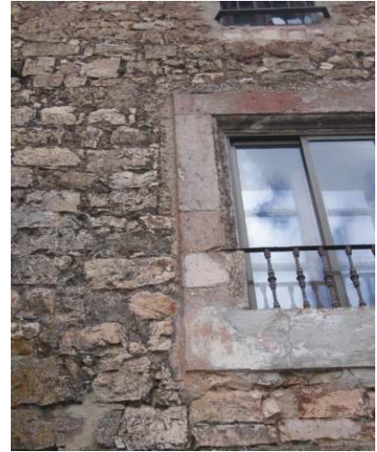
Figura 12: Detalle de embocadura

Es posible encontrar en este mismo lugar ejemplos de fachadas que ofrecían una solución ordenada y culta, geométricamente precisa en edificios representativos (Figura 13).