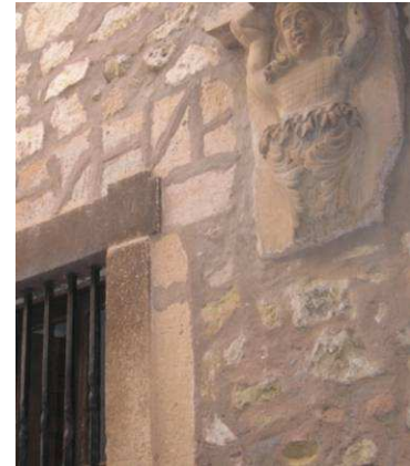
Figura 17: Detalle falsas juntas. Sepúlveda (Segovia).