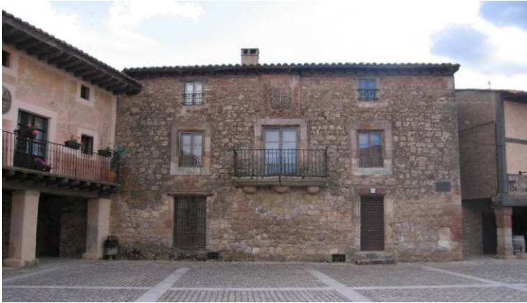
Figura 11: Fachada desollada en la Plaza de Medinaceli (Soria)