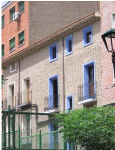
Figura 18: Fachada desollada de ladrillo en Zaragoza