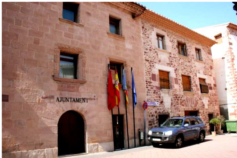
Figura 6: Fachadas de piedra en Villafamés (Castellón)