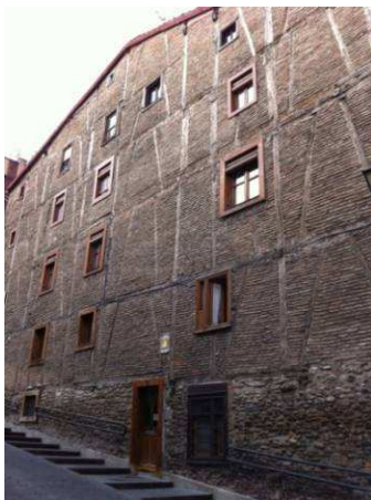
Figura 26: Fachada desollada de entramado de ladrillo en Vitoria.