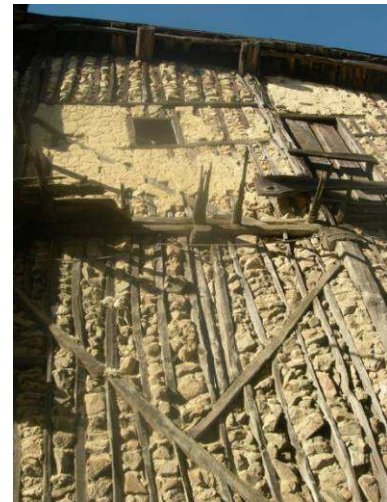
Figura 22: Entramados tradicionales en La Alberca (Salamanca).

Aunque en las restauraciones que eliminan el revoco se protegen estos elementos con algún tipo de barnices protectores, el aspecto original (Figura 23 y Figura 25) de estas construcciones se modifica. En algunos casos, aunque se respeta la presencia del mortero en los paños del muro se dejan a la vista los elementos de madera, incluyendo los frentes de forjado, con el consiguiente riesgo de pudrición de las cabezas de las viguetas y vigas. (Figura 25). Esta composición, que busca equivocadamente cierta imagen tradicional, es muy distinta a la original y ofrece una solución peor desde el punto de vista del comportamiento del muro frente a los agentes exteriores.