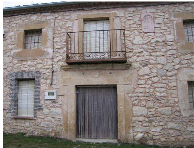
Figura 14: Fachada desollada en Torre Val de San Pedro (Segovia)

En los muros descarnados, sin embargo, como se ve en la Figura 14, aunque los sillares de jambas y dinteles estén labrados remarcando resaltes rectos, lo que se aprecia son los elementos pétreos completos, descubriendo sus espesores y bordes desiguales. La imagen resultante es primaria, primitiva, menos culta y cuidada, y contradictoria con las apariencias y composición originales.