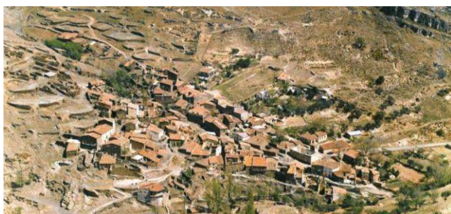
Figura 3: Conjunto urbano histórico de Patones (Madrid)

Otro conjunto urbano como el de Patones (Madrid) presenta un aspecto muy distinto tras la restauración de sus fachadas eliminando los revocos tradicionales. En la Figura 3 se muestra este pueblo, apreciándose claramente una imagen de caserío con elementos revocados de color claro y cubiertas de teja. La eliminación del acabado exterior daría lugar a un aspecto muy diferente, fácilmente imaginable a partir de la Figura 4.