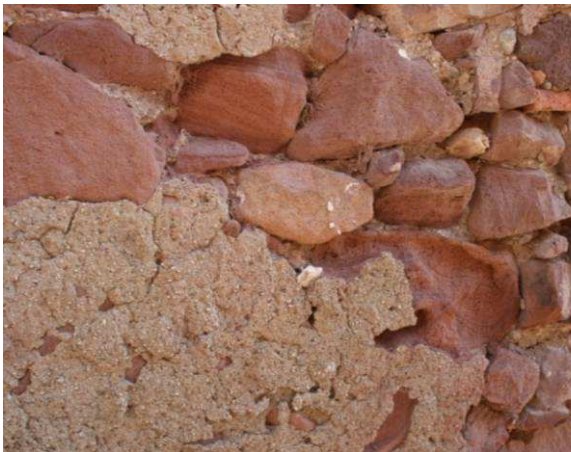
Figura 8: Detalle de fachada deteriorada de piedra con mortero tradicional en Villafamés (Castellón)

Los morteros tradicionales para proteger los muros, eran de espesores medios notables (aprox. 4 cm), ya que no sólo cubrían los elementos más salientes, sino que rellenaban los huecos e irregularidades que quedaban entre ellos y la capa base del revestimiento. Como se observa en las Figura 8 y la Figura 9, la desaparición de esta capa superficial deja a la vista un muro con elementos de piedra irregulares y sin labrar. El abandono de muchas edificaciones históricas ha dado lugar a que esta imagen deteriorada, lejana al aspecto tradicional e histórico, sea habitual en muchas de nuestras ciudades y pueblos.