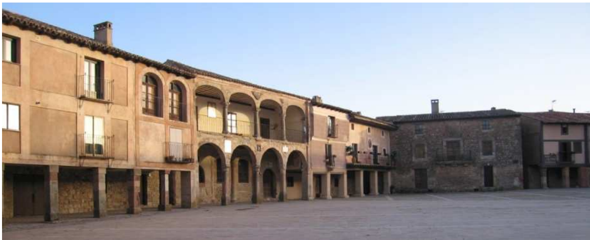
Figura 10: Fachadas en la Plaza Mayor de Medinaceli (Soria)

Como ejemplo puede observarse la Plaza Mayor de Medinaceli (Soria). El “despellejado” de la casa que forma la esquina del oeste de la plaza, como se observa en la Figura 10, ocasiona una ruptura visual de la escena urbana. Esta fachada destaca negativamente frente al resto del conjunto, que está compuesto por fachadas revocadas en las que los huecos se cercan con embocaduras de piedra o quedan remarcados con revocos con geometrías rectas, quedando también resaltados los escudos y elementos decorativos de piedra.