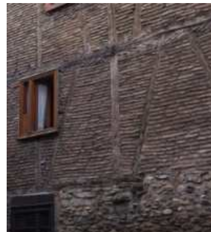
Figura 27: Fachada desollada de entramado de ladrillo en Vitoria.