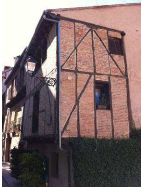
Figura 23: Entramados en Segovia.