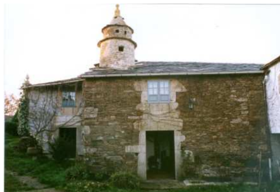
Figura 31: O Pazo (Orense)

Para comprobar el comportamiento de los tres tipos de muros planteados: de fábrica de ladrillo y de piedra macizas de 40 cm, y muro de entramado de ladrillo de 20 cm de espesor, se ha realizado una simulación de todas ellas, con y sin revestimiento. El análisis se ciñe a la localidad de Villafamés (Valencia). Los datos climáticos considerados son los correspondientes a Castellón de la Plana, por ser el municipio más cercano. Asimismo, se considera un ambiente urbano con un coeficiente de albedo de 0.20, un día soleado en el que las edificaciones carecen de obstrucciones solares, con temperaturas interiores fijas comprendidas en el rango establecido por el RITE, de 21°C en invierno y de 24°C en verano, suponiendo que las edificaciones disponen de sistemas de climatización y unas condiciones de viento exterior de 3 m/s, siendo ésta la velocidad más común de acuerdo con los datos de las Rosas de los Vientos del Instituto Nacional de Meteorología 1971-2000. Las simulaciones se realizan para los días 15 de los meses de enero y de agosto por ser éstos los de temperaturas más extremas.