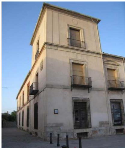
Figura 13: Fachada de piedra revocada Palacio del Duque de Medinaceli (Soria)

Es posible encontrar en este mismo lugar ejemplos de fachadas que ofrecían una solución ordenada y culta, geométricamente precisa en edificios representativos (Figura 13).