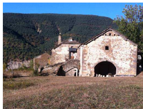
Figura 29: Construcciones tradicionales en Susín (Huesca)

Los revocos protegían y minimizaban las dilataciones por cambios térmicos en el interior de los muros, evitando las fisuraciones y las penetraciones de frío y calor. Asimismo, al ofrecer una superficie que evita que el agua penetre, evita el deterioro por heladicidad, otra causa de problemas térmicos y estructurales.