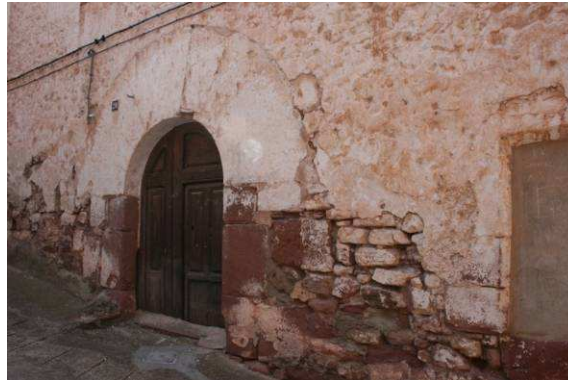
Figura 7: Fachada de fachada de piedra con arco de acceso de piedra en Villafamés (Castellón)

mejorar la resistencia del conjunto. Sin estas labores de mantenimiento, el muro sufre un deterioro importante como muestra la Figura 9.