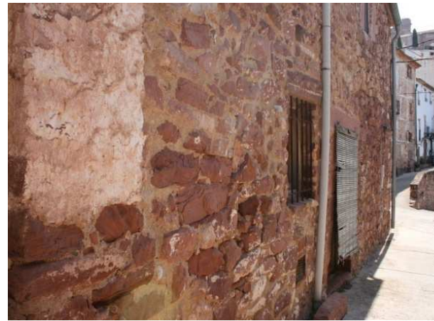
Figura 9: Sustitución del revoco tradicional exterior por sólo relleno de juntas en Villafamés (Castellón)

La eliminación de estos acabados, intentando dejar vista la piedra base antes cubierta, obliga a rellenar los huecos entre las piedras o ladrillos con morteros de rejuntado impermeables. Estos morteros suelen ser en base de cemento, cuya incompatibilidad con los soportes tradicionales ha sido ampliamente probada en las últimas décadas, a lo que se suma la modificación estética del conjunto, con la aparición de juntas de gran espesor que terminan por hacer que la apariencia