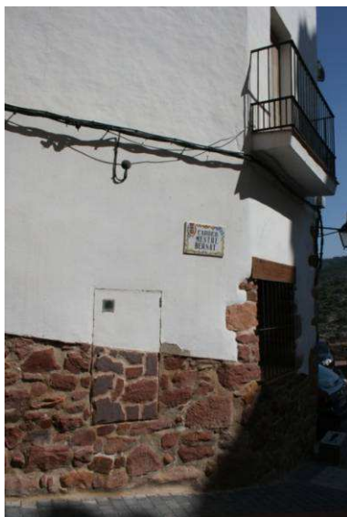
Figura 32: Fachada de piedra revocada y zócalo de piedra visto. Villafamés (Castellón)