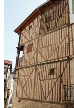
Figura 25: Entramado tradicional restaurado eliminando revoco en elementos de madera en La Alberca (Salamanca).

También encontramos en muros de entramado de ladrillo ejemplos de “desollado” de los paños para dejar a la vista el muro desnudo. En la Figura 26 y en la Figura 27 con más detalle se aprecia esta práctica y, de nuevo, las embocaduras de huecos recuerdan la eliminación del revoco tradicional. En el paramento se descubren los aparejos pobres y se ponen en peligro los elementos estructurales ahora a la intemperie, en los que sólo cabe realizar protecciones superficiales.