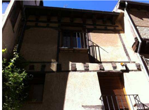
Figura 24: Entramado tradicional restaurado eliminando revoco en elementos de madera en La Alberca (Salamanca).