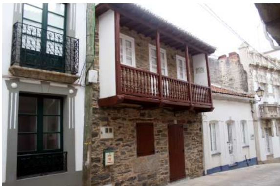
Figura 30: Ares (A Coruña)