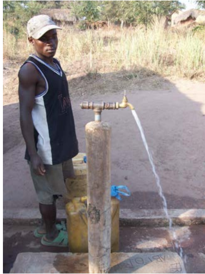
Figura 2. Punto de agua en Sunuka, Tanzania (Mancebo, 2011).