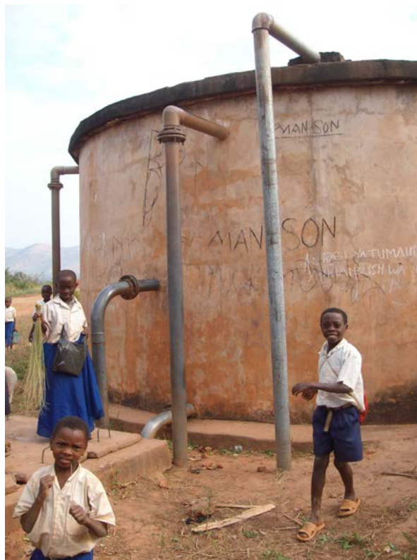
Figura 3. Depósito de agua en Mwandiga en Kigoma, Tanzania (Mancebo, 2010).

De manera que a las dificultades propias de una ingeniería realmente apropiada, a menudo basada en sistemas de bajo coste irremplazables, se suman las complicaciones derivadas de una identificación acertada que detecte a priori las debilidades y fortalezas, los riesgos, y las recomendaciones a tener en cuenta. Y todo ello sin olvidar la garantía de sostenibilidad. Así, como otro ejemplo válido en agua: la presión por frecuencia de uso en puntos de agua para consumo humano en sistemas de abastecimiento comunales es muchísimo mayor que en cualquier punto similar de un hogar de un país desarrollado ¿aplicamos entonces los mismos criterios de diseño y selección de materiales?, o, mejor, aumentemos nuestro rango de estudio y de profesionalidad.