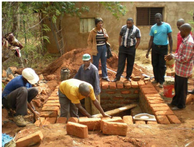
Figura 2. Asistencia técnica en un proyecto de saneamiento en Tanzania.