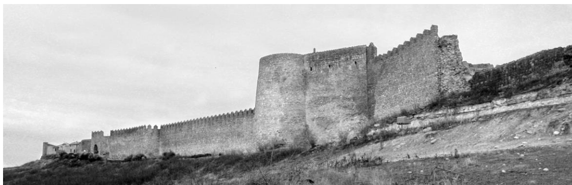
Figura 1. Perspectiva del tramo sur de la muralla, el castillo y el cubo troncocónico que les une.

Estas son algunas de las circunstancias que nos hacen lanzarnos a una búsqueda de valores históricos, documentales, artísticos, paisajísticos e, incluso, evocativos para constatar el grado de importancia en el momento actual y poder actuar sobre el monumento.