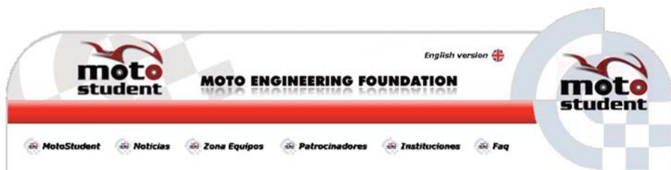
Figura 4. Cabecera y logo de la página web de MotoStudent

MotoStudent está organizada por la Fundación “Moto Engineering Foundation”, que es una entidad sin ánimo de lucro que tiene por objeto impulsar los contactos y las actividades de formación e innovación entre la industria de vehículos de dos ruedas y cuadriciclos, la Universidad y cualquier otra entidad relacionada con el sector del motor. Dentro de los patronos de esta fundación podemos reseñar: Dorna Sports, S.L., ANESDOR, la Real Federación Motociclista Española, MotorLand Aragón y la Universidad de Zaragoza, entre otros.