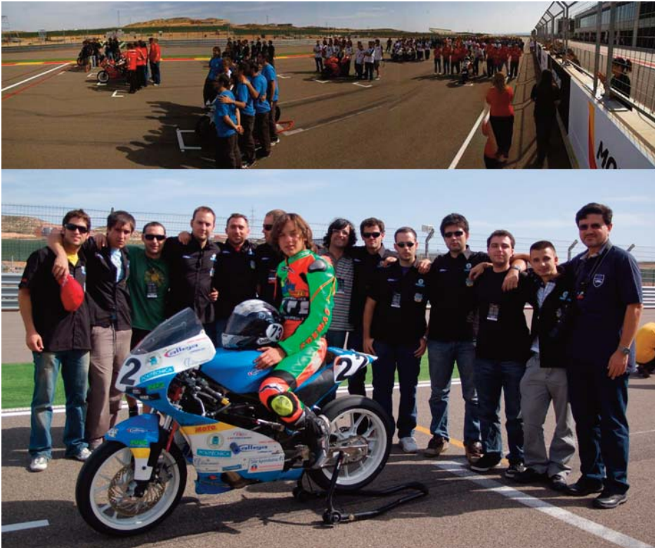
Figura 5. Parrilla de salida en la 1ª edición de MotoStudent 2009-2010

MotoStudent es una competición internacional bianual consistente en diseñar y desarrollar, por parte de equipos universitarios, un prototipo de moto de competición de pequeña cilindrada que compite con su evaluación pertinente. Los estudiantes deberán demostrar en un periodo de 18 meses que pueden desarrollar un prototipo de estas características y el modelo empresarial necesario para lograrlo, lo que justificarán con los oportunos estudios económicos y de negocio.