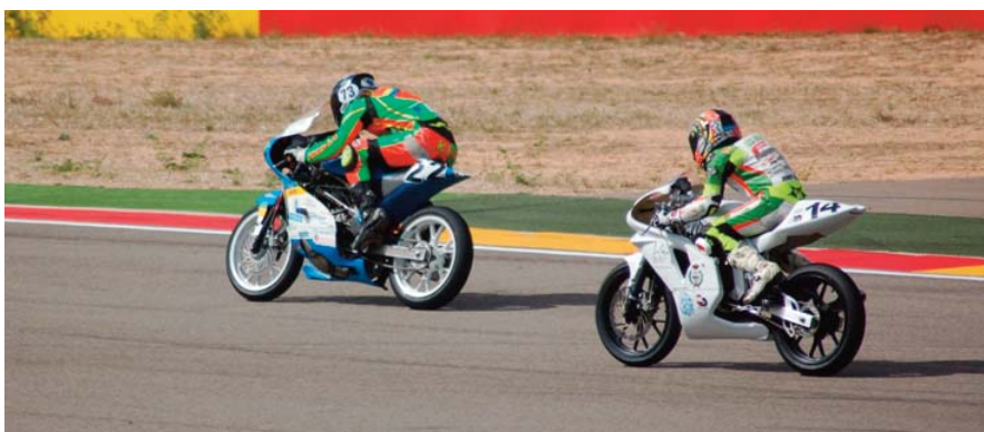
Figura 6. Carrera cronometrada de la 1ª edición de MotoStudent 2009-2010

Los objetivos que se persiguen alcanzar con la participación de los estudiantes en la competición son: