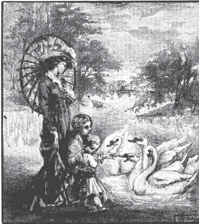
FIGURA 3 | “Los niños se reúnen para alimentar [a los cisnes] con los restos de su picnic”.