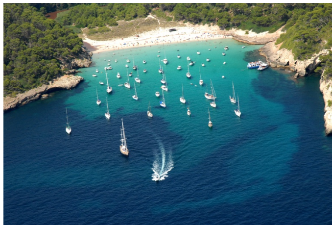
Figura 1. Fondeos localizados en Cala Trebalúger. Agosto de 2010 por la tarde.

Se han realizado tres vuelos que han permitido localizar y contar los barcos fondeados a lo largo del litoral: (2/08/09 -8.00 AM, 9/08/10 -8.00 AM y 16.00 PM). A pesar de que como datos referidos a tres momentos concretos, deben ser considerados más como un acercamiento al problema que como un muestreo, son la única fuente fiable con la que se cuenta para evaluar la situación.