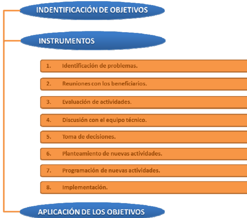
Figura 3: Participación de los beneficiarios locales aplicando el modelo de aprendizaje social como herramienta para la planificación y ejecución de los proyectos de desarrollo rural