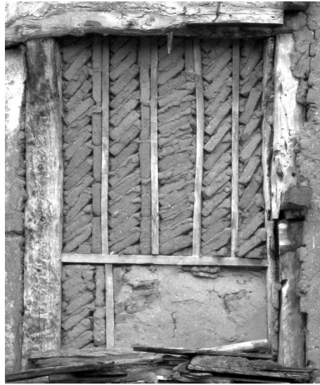
4. Sistema constructivo de muro armado con entramado de madera y plementería de adobe. Boceguillas (Segovia)