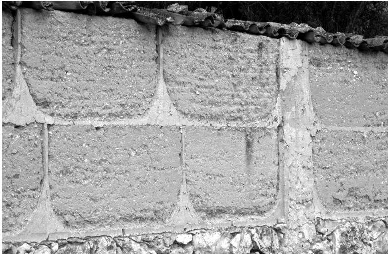
1. Tapia con brecas. Aranjuez (Madrid)

en coincidencia, en ambos casos, con la extensión e influencia en nuestro país de las corrientes más renovadoras de la arquitectura moderna .