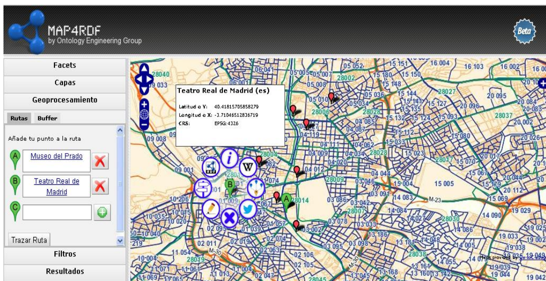
Figura 4. Visualización de map4RDF y sus funcionalidades

Adicionalmente, pensando en la usabilidad de la aplicación y en que el usuario de la misma pudiera interactuar con todas las funcionalidades añadidas a map4RDF de una manera directa, se ha implementado una funcionalidad que permite desplegarlas en torno al POI seleccionado por el usuario. Un ejemplo del resumen de las funcionalidades implementadas se muestra en la Figura 4. De esta manera, el usuario tiene un fácil acceso a la información relevante de un POI, ya que a través de este resumen se puede acceder a las diferentes funcionalidades implementadas. Todas las funcionalidades de map4RDF descritas con anterioridad se encuentran desplegadas en el sitio web de GeoLinked Data ( http://geo.linkeddata.es ).