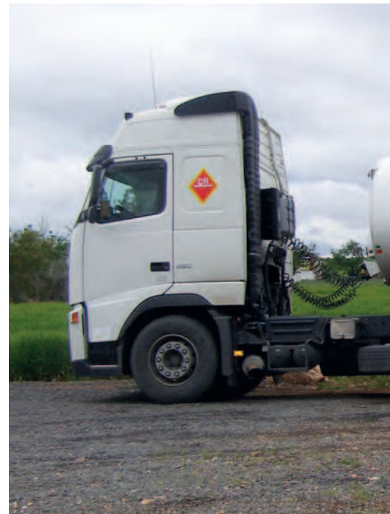
TABLA 2 / Distribución de los gastos variables a lo largo de la vida de un tractor.

El agricultor no puede ser un mero "consumidor" y se ha de convertir en "comprador profesional". Se ha de reconocer que no es fácil comprar un tractor. La compra será un proceso de análisis inteligente, para ello hay que ser conscientes de los gastos imputables a la vida de un tractor ( Tabla 2 ). Se debe huir de comprar por colores o "direses" de cafés.