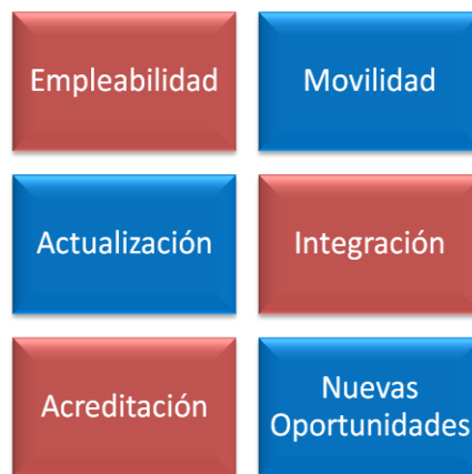
Figura 1. Beneficios del post Grado internacional en Salud Ocupacional

En ambos casos (Maestría y Experto), los alumnos participantes recibirán la asistencia y el servicio académico de la Universidad de Alcalá en las principales ciudades de los países que integran la geografía latinoamericana y caribeña, en horarios flexibles que se acuerdan con los alumnos década localidad. Es decir, los profesionales y técnicos matriculados recibirán en su región de origen o en la ciudad donde reside y en días y horarios en mutuo acuerdo, una formación y una acreditación que incrementará sus niveles de empleabilidad, movilidad, actualización e integración a una comunidad del conocimiento, que le permitirá identificar y aprovechar nuevas y mejores oportunidades laborales y empresariales.